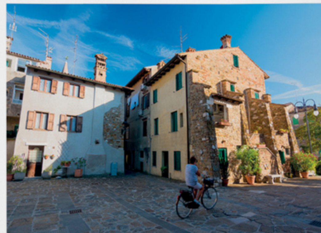
Spoznavanje narave v rezervatu lahko združimo še z obiskom bližnjega Gradeža, ljubkega pristaniškega mesteca.

Še beseda o rastlinju: tu samoniklo raste več kot 650 cvetnic, od tega jih je 22 na italijanskih rdečih seznamih ogroženih vrst, dve sta evropskega pomena. Samosvoje in zanimive so tudi slanuše, na sol v zraku in na tleh prilagojene rastline, ki jih poznamo tudi iz naših solin. Stara kmetija na otoku Cona je preurejena v center za obiskovalce. Od tu se lahko odpravimo na krajšo, enourno ali daljšo, peturno pot. Utrjene stezice vodijo po nizkih nasipih in se vijejo med trsjem, kanali, jezerci in močvirji. Lahko se sprehodimo sami ali pa se vnaprej dogovorimo za jahanje ali voden ogled peš, s kanujem ali kolesom.