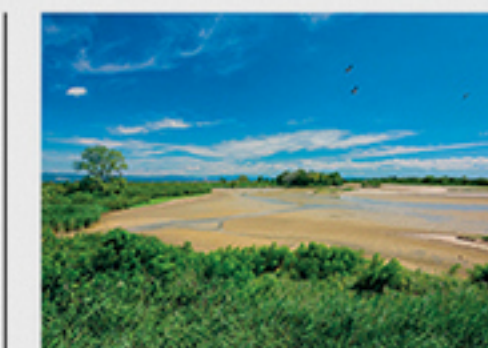
Otok Cona vrvi od življenja, hkrati pa je prostor miru in tišine, kjer smo ljudje le gostje. Na zaščiteneh točkah za opazovanje ptic je zapovedana in zaželena tišina.