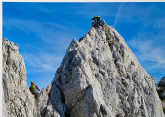
Strmi stolpi Na Možeh

Čez ruševnati kucelj (za njim iztek vlečnice) in skozi gosto ruševje (obstaja izsek) se po levi strani pod grebenom čez skalnat rob povzpemo na južni strani do šleba (I). Po njem splezamo na greben (II) in čez krušljivo ploščo na prvi stolp (krušljivo, I–II). Kratek sestop na severno stran nas pripelje v ozek strm kamin, po katerem dosežemo sedlo med prvim in drugim Možeh (I), tako da na koncu zlezemo pod zagozdeno skalo. Brez telav splezamo na sosednji, drugi stolp (I), po ozki in izpostavljeni, a trdni grebenki rezi pa sestopimo na škrbino (II–III). Od tu se lahko desno vzpemo še na sosednji stolp ali pa prečimo levo do ruševja (I–II). Tu se spustimo 10 metrov po vrvi na travnatu sedlece (ta del je možno obiti po južni strani, ni pa prav lahko). Tu imamo možnost pobega: s sedelca se spustimo levo po meliških in strmih gozdu vse do smučič na Zelenici. Na vrsti je zadnji, tretji (če štejemo samo sedla, drugače četrti) stolp. Splezamo v škrbino, od tam pa levo čez ploščo na ostri vrh (II). Na drugi strani sestopimo po gladki plošči (I–II) ter skozi ruševje in čez skrotje dosežemo široko rukevnto sleme. Po krajšem prečenju skozi ruševje splezamo čez dva skrotasta, zelo krušljiva vršiča v grebenu (I) do začetka velikega melišča ob zanimivem ostrem stolpu. Do sem je najlažji pristop iz Suhga ruševja,