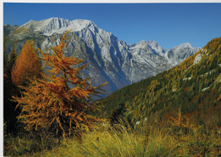
Bavški Grintavec, desno Zapotoški vrh

jedenlec pomagajo čez skalni skok na desni, potem pa sledimo stezici nad slap in v ključih navzgor čez strmo gozdno pobočje do križpotja (kamor z leve pripelje stezica od kampa v vasi Trenta). Desno gre steza proti grapi in Ušju, mi pa zavijemo levo spet v ključih skozi grapi in čez grapo v desno čez strmo gozdno pobočje (mestoma slabo vidna stezica, možiči). Po prečnici pridemo spet do prve, višje pa do druge grape. Nekaj časa se vzpenjamo ob njej, potem čez gozdno pobočje in po naslednji grapi do travnikov. Na levi strani je plitva zaraščena travnata grapa, ob njej nadaljujemo do bukovega gozda in končno do idiličnega sedla Staro Utro z lovsko kočjo (na staro vojaško cesto pridemo že pred prelazom).