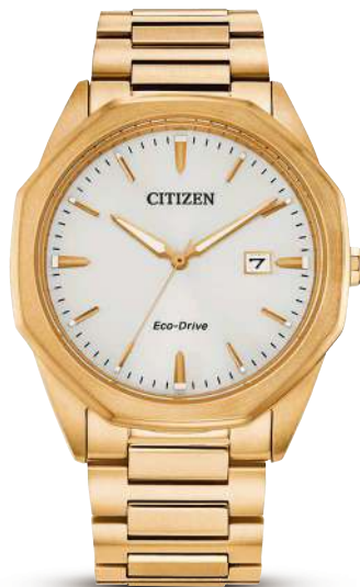
BM7492-57A $525.00 41 mm SSP SC SSP FCP SP WR100