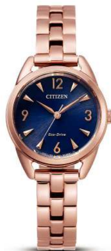
EM0688-78L $350.00 27 mm SSP MC SSP FCP SP WR