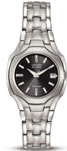
EW1400-53H $450.00 25 mm TIC MC TIC FCP PC WR