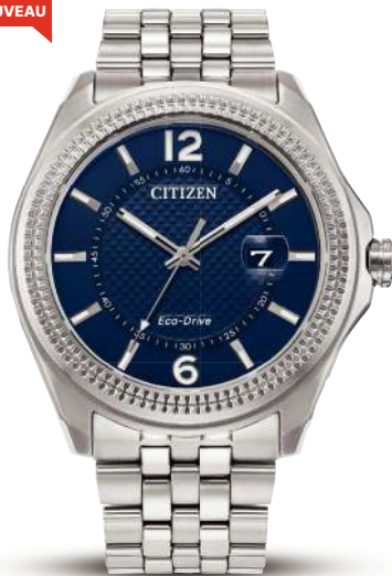
AW1740-54L $495.00 42 mm SS MC SS HDP SP WR100