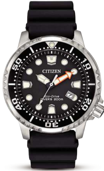
BN0150-28E $475.00 44 mm SS CM PU BKL - 200M