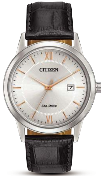
AW1236-03A $275.00 40 mm SS MC LTHR BKL - WR