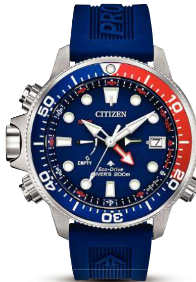
BN2038-01L $950.00 46 mm SS MC PU BKL - 200M