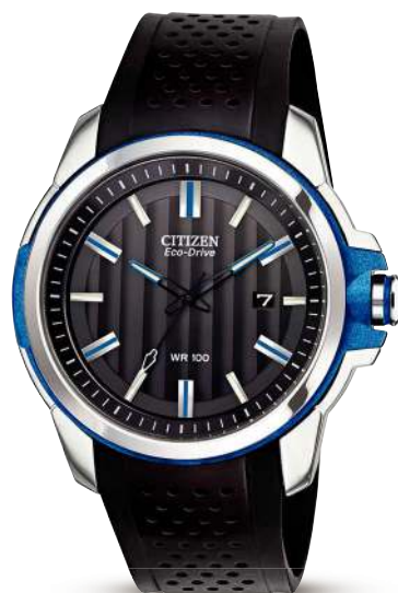
AW1151-04E $325.00 45 mm SS MC PU BKL - WR100