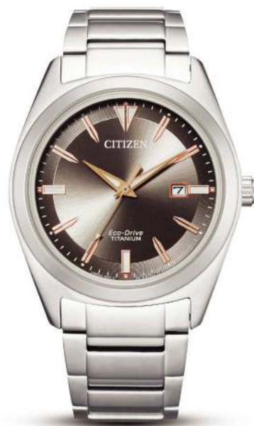
AW1640-83H $495.00 42mm TIC MC TIC FCP SP WR50