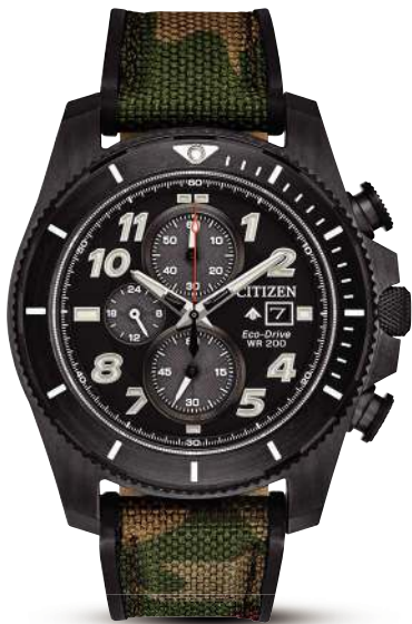
CA0727-12E $695.00 44 mm SSC CS NYPU BKL - WR200