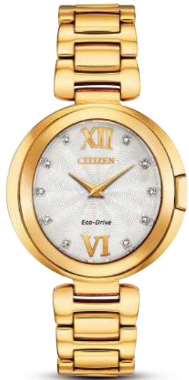
EX1512-53A $750.00 34 mm SSP SC SSP DCP PC WR50