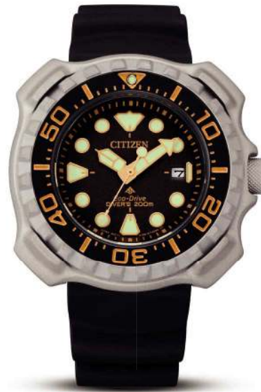
BN0220-16E $725.00 47 mm TIC MC PU BKL – 200M