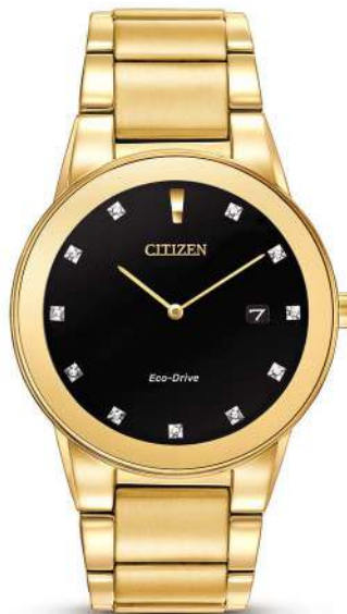
AU1062-56G $525.00 40 mm SSP MC SSP FCP SP WR