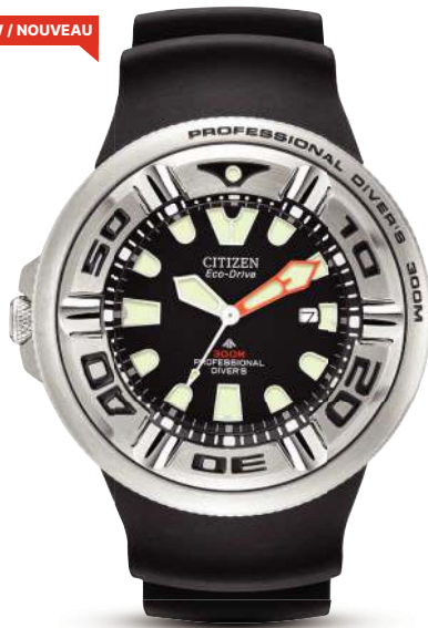
BJ8050-08E $750.00 48 mm SS CM PU BKL - 300M