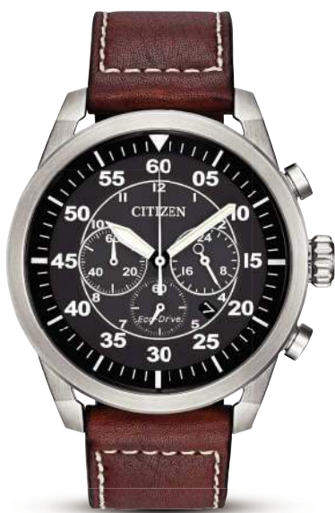
CA4210-24E $475.00 45 mm SS MC LTHR BKL - WR100