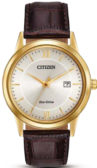
AW1232-04A $295.00 40 mm SSP MC LTHR BKL - WR