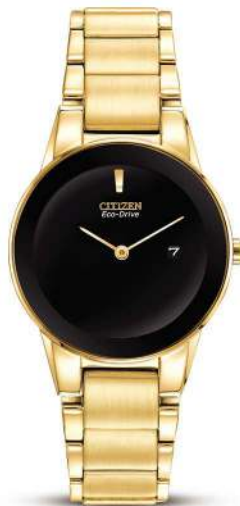
GA1052-55E $425.00 30 mm SSP MC SSP FCP SP WR