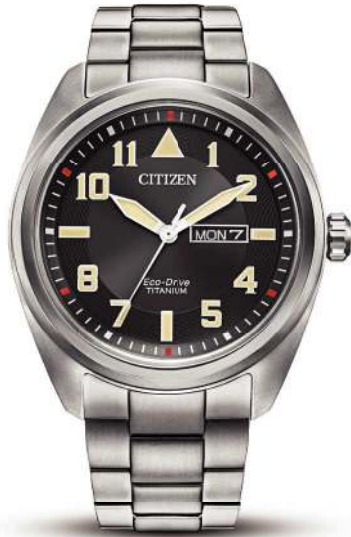
BM8560-53E $495.00 42 mm TIC SC TIC FCP PC WR100