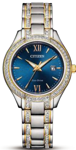
FE1234-50L $475.00 30 mm SSP MC SSP FCP SP WR50