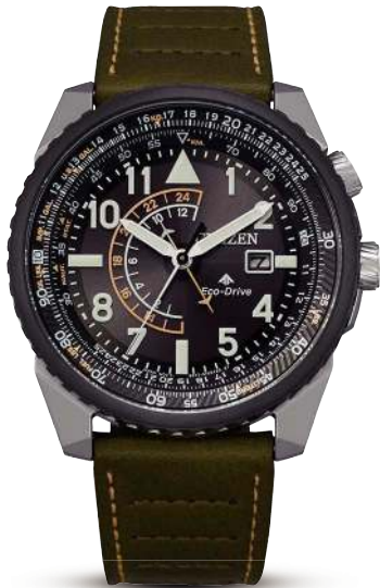
BJ7138-04E $625.00 42 mm SSP MC LTHR BKL - WR200