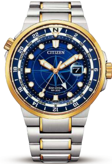
BJ7144-52L $695.00 44 mm SSP SC SSP HDP SP WR200