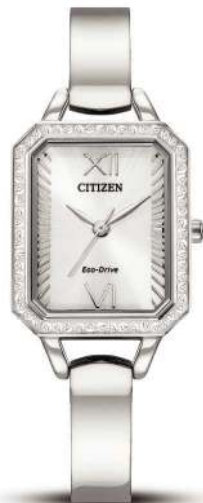
EM0980-50A $395.00 23X28 mm SS MC SS JLP SP WR50