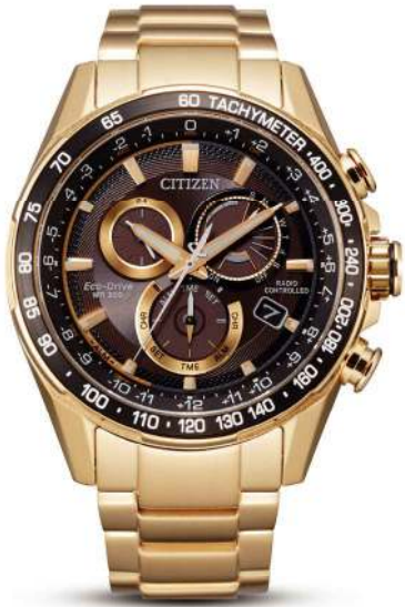
CB5912-50E $895.00 43 mm SSP SC SSP HDP PC WR200