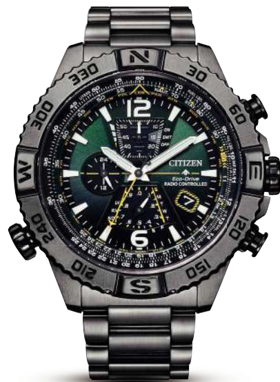
AT8227-56X $995.00 48 mm SSP SC SSP HDP PC WR200