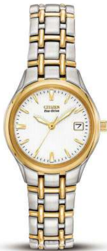
EW1264-50A $395.00 25 mm SSP MC SSP FCP SP WR