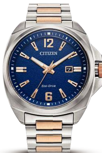
AW1726-55L $595.00 42 mm SSP SC SSP FCP SP WR100