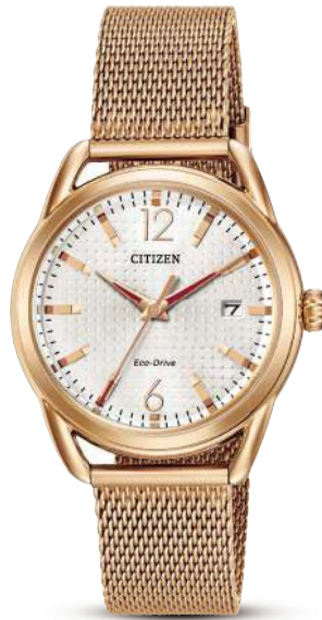
FE6083-72A $350.00 36 mm SSP MC SSP BKL - WR