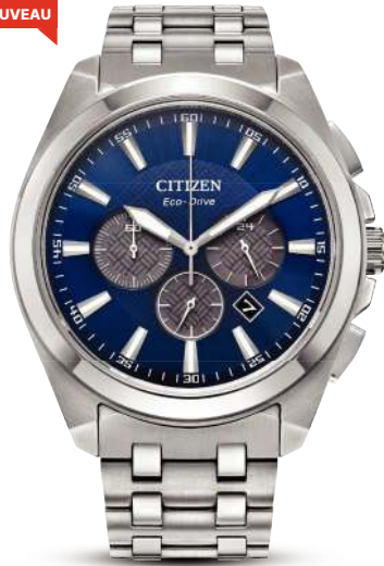
CA4510-55L $625.00 41 mm SS SC SS FCP SP WR100