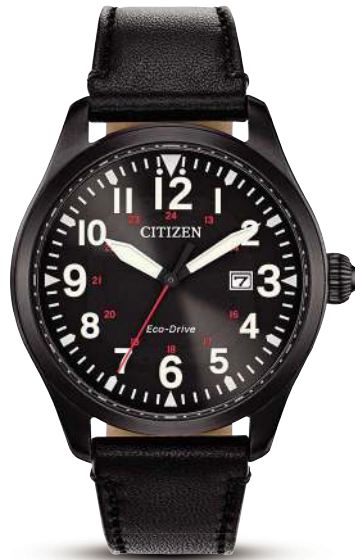
BM6835-15E $350.00 42 mm SSP MC LTHR BKL - WR100