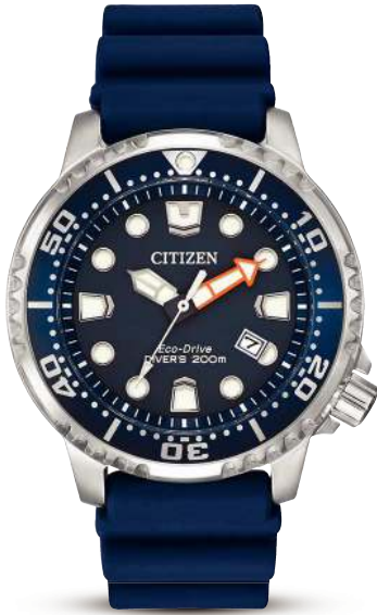
BN0151-09L $475.00 44 mm SS CM PU BKL - 200M