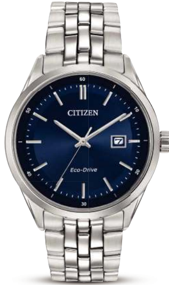
BM7251-53L $475.00 41 mm SS SC SS FCP SP WR100