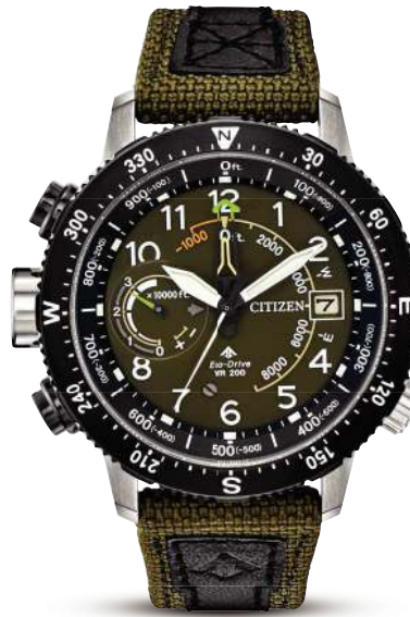
BN5050-09X $825.00 46 mm SSP CM NYLN BKL - WR200

CORDURA® is a registered trademark of INVISTA for durable fabrics. CORDURA® est une marque déposée des tissus durables INVISTA.