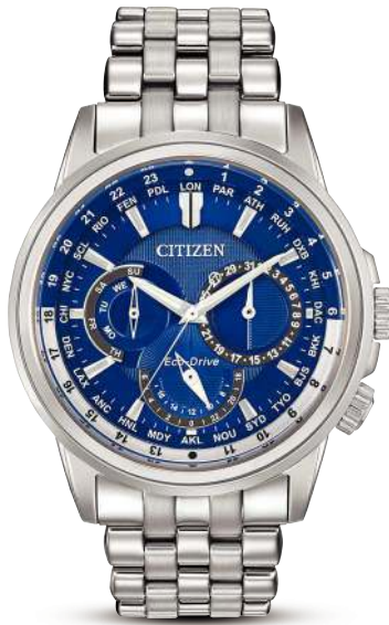
BU2021-51L $625.00 44 mm SS CM SS DCP SP WR100