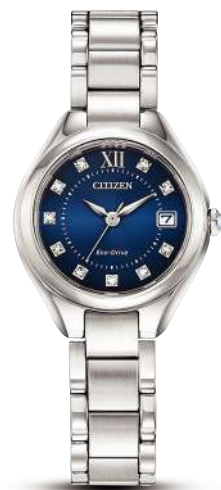
EW2540-83L $375.00 26 mm SS SC SS FCP SP WR50