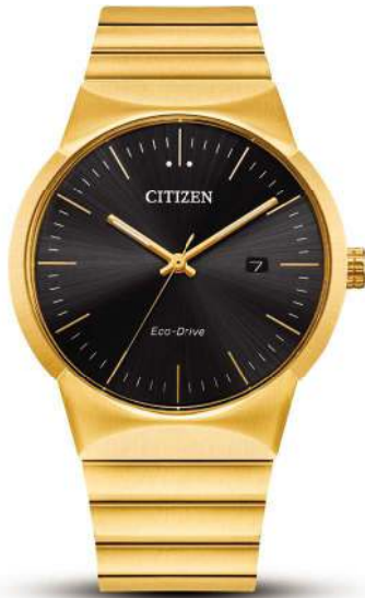
BM7582-56E $475.00 40 mm SSP MC SSP FCP PC WR