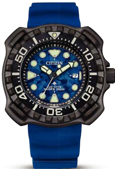
BN0227-09L $725.00 47mm TIC MC PU BKL - 200M