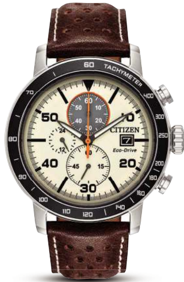
CA0649-06X $450.00 44 mm SS MC LTHR BKL - WR100