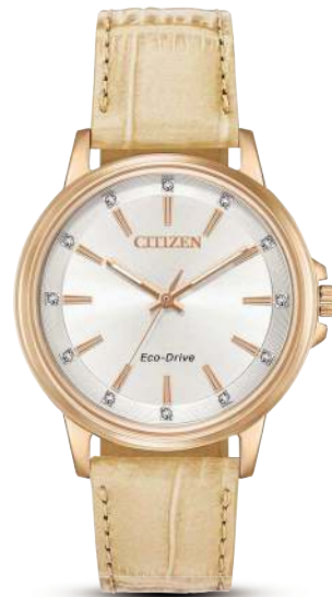
FE7033-08A $325.00 37 mm SSP MC LTHR BKL - WR50