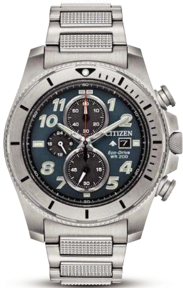
CA0720-54H $750.00 44 mm SSC CS SSC SCP SP WR200