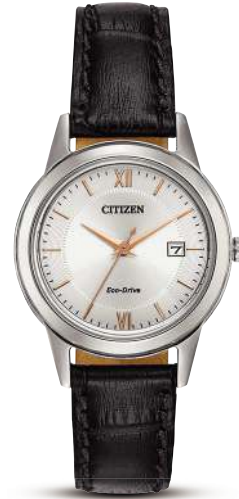
FE1086-04A $275.00 29 mm SS MC LTHR BKL - WR