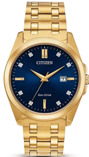
BM7103-51L $575.00 41 mm SSP SC SSP FCP SP WR100