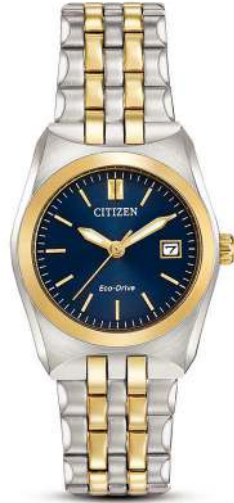
EW2294-53L $395.00 28 mm SSP MC SSP FCP SP WR100