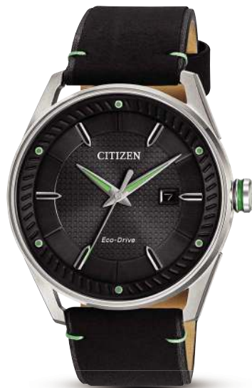
BM6980-08E $295.00 42 mm SS MC LTHR BKL - WR100