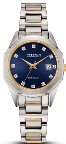
EW2584-53L $625.00 28 mm SSP SC SSP FCP SP WR50