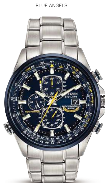
AT8020-54L $850.00 43 mm SSP CS SS HDP SP WR200