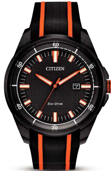
AW1608-01E $350.00 45 mm SSP MC PU BKL - WR100