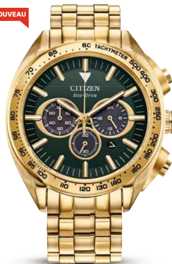
CA4542-59X $895.00 43 mm SSP SC SSP HDP PC WR100