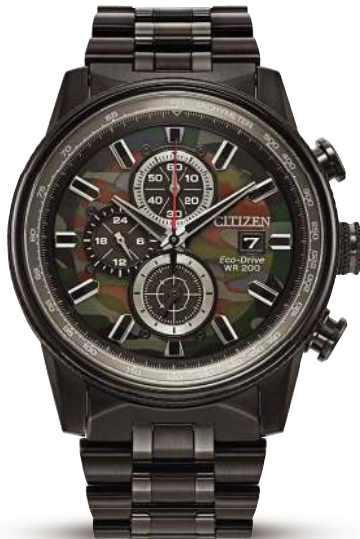
CA0805-53X $695.00 43 mm SSP MC SSP HDP SP WR200