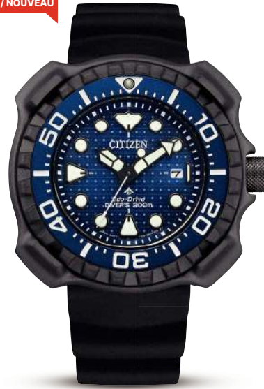
BN0225-04L $825.00 47 mm TIC MC PU BKL – 200M