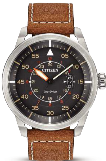
AW1361-10H $295.00 45 mm SS MC LTHR BKL - WR100