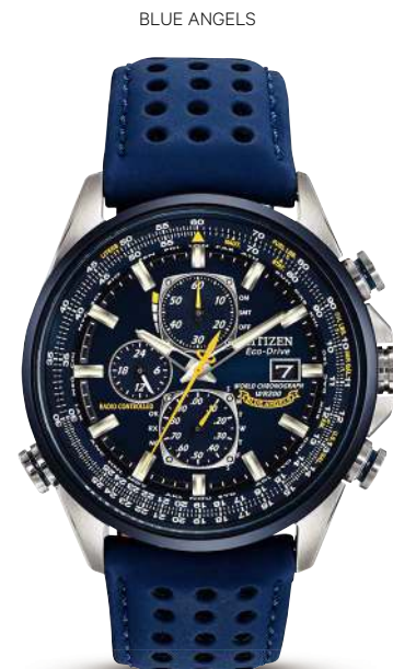
AT8020-03L $795.00 43 mm SSP CS PUL BKL - WR200