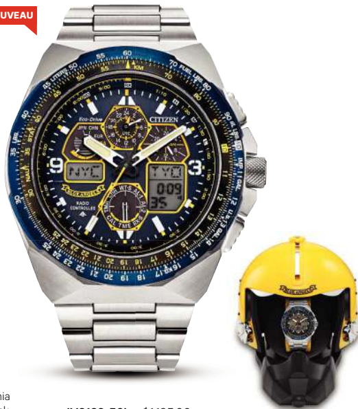
JY8128-56L $1,195.00 46 mm SSP SC SSP HDP PC WR200

Le logo officiel des Blue Angels apparaît au dos du boîtier.