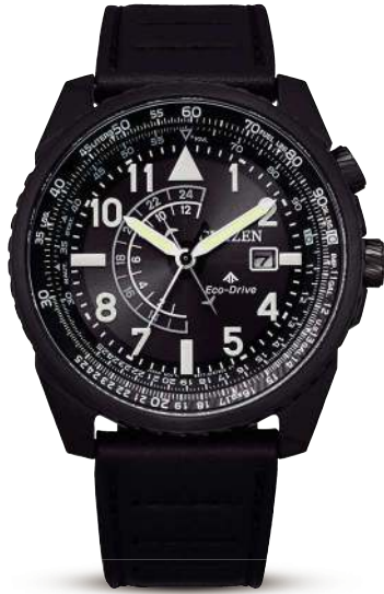
BJ7135-02E $625.00 42 mm SSP MC LTHR BKL - WR200