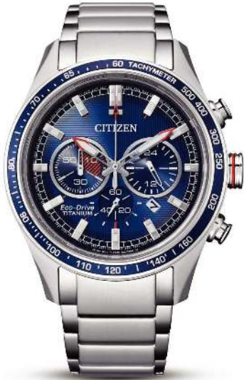
CA4490-85L $695.00 43mm TIC SC TIC FCP SP WR100