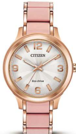
FE7073-54A $395.00 37 mm SSP MC SSPU FCP SP WR100