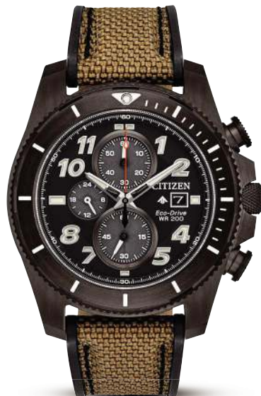
CA0727-04E $695.00 44 mm SSC CS NYPU BKL - WR200