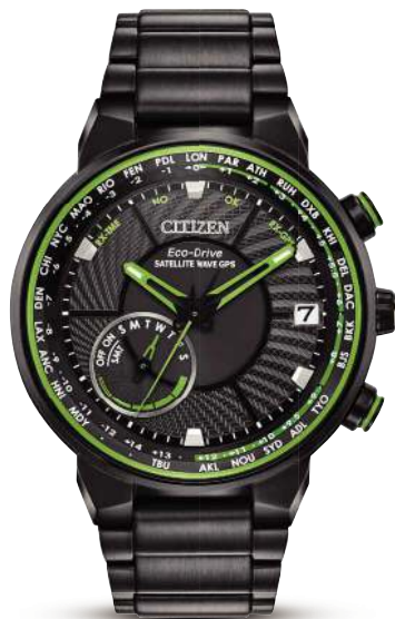
CC3035-50E $1,050.00 44 mm SSP MC SSP FCP SP WR100