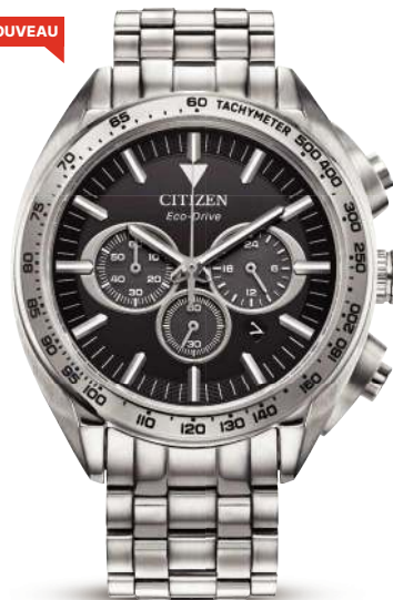
CA4540-54E $850.00 43 mm SS SC SS HDP PC WR100