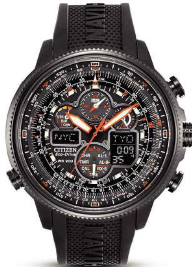
JY8035-04E $875.00 48 mm SSP CM PU HDP CB WR200