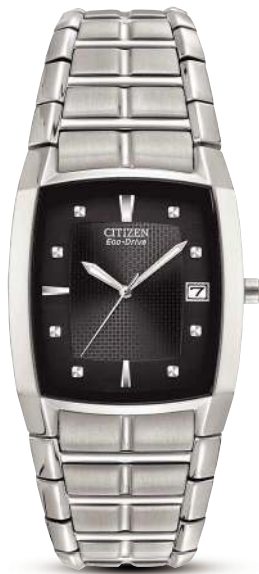
BM6550-58E $395.00 33x31 mm SS MC SS DCP SP WR