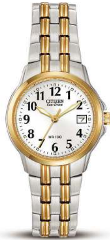
EW1544-53A $395.00 26 mm SSP MC SSP FCP SP WR100