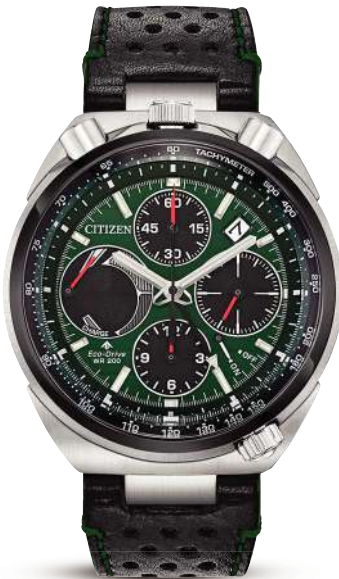
AV0076-00X $1,195.00 45 mm SSP CS LTHR DCP - WR200