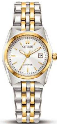
EW2299-50A $395.00 28 mm SSP MC SSP FCP SP WR100