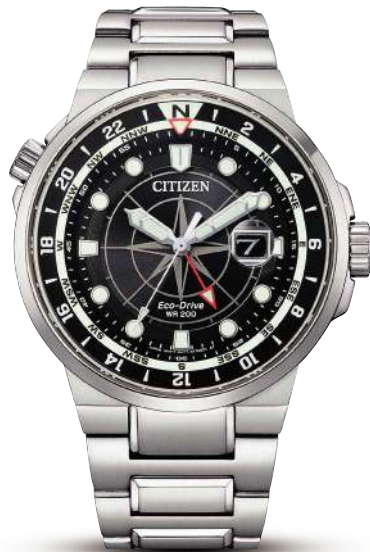
BJ7140-53E $650.00 44 mm SS SC SS HDP SP WR200