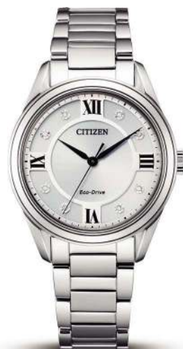
EM0870-58A $595.00 32 mm SS SC SS DCP SP WR50

8 DIAMONDS / DIAMANTS MOTHER-OF-PEARL / NACRE