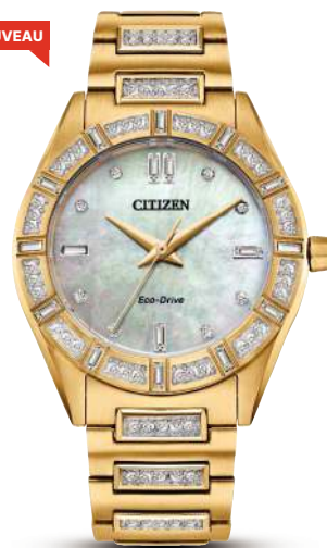
EM1022-51D $525.00 34 mm SSP SC SSP FCP SP WR50