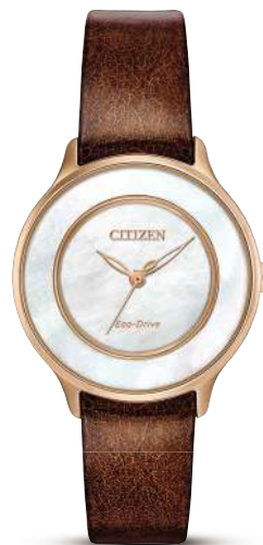
EM0383-08D $395.00 30 mm SSP SC LTHR BKL - WR50