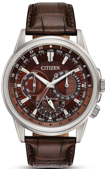
BU2020-29X $525.00 44 mm SS CM LTHR DCP - WR100