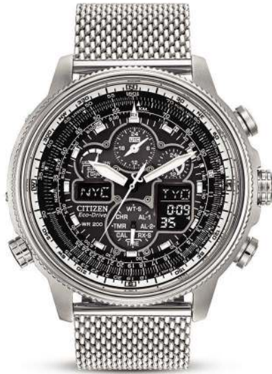
JY8030-83E $895.00 48 mm SS CM SS DCP SP WR200