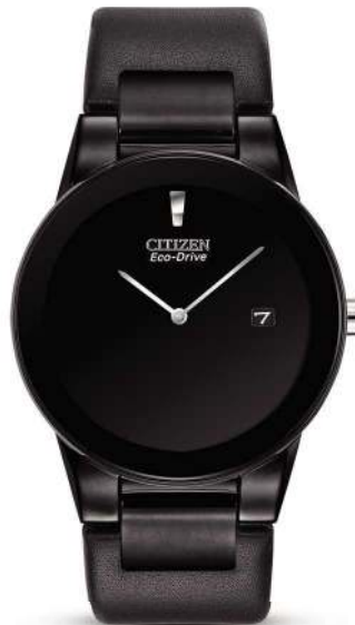
AU1065-07E $350.00 40 mm SSP MC LTHR BKL - WR