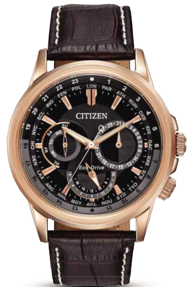
BU2023-04E $550.00 44 mm SSP CM LTHR DCP - WR100