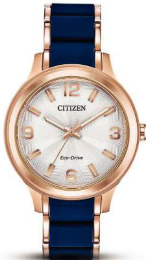
FE7073-71A $395.00 37 mm SSP MC SSPU FCP SP WR100