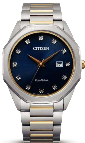
BM7494-51L $625.00 41 mm SSP SC SSP FCP SP WR100