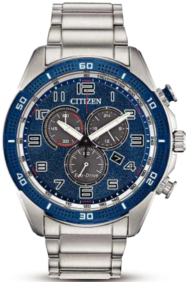
AT2440-51L $475.00 45 mm SS MC SS FCP SP WR100