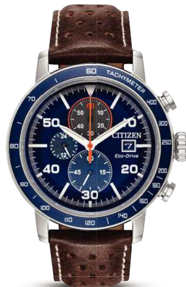
CA0648-09L $450.00 44 mm SS MC LTHR BKL - WR100