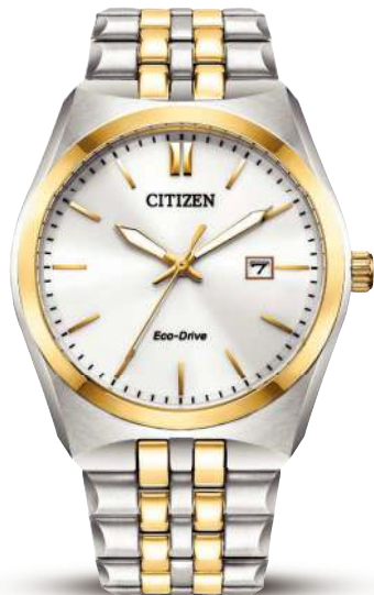
BM7334-58B $395.00 40 mm SSP MC SSP FCP SP WR100