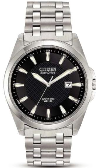
BM7100-59E $495.00 41 mm SS SC SS FCP SP WR100