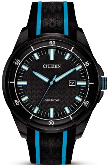
AW1605-09E $350.00 45 mm SSP MC PU BKL - WR100