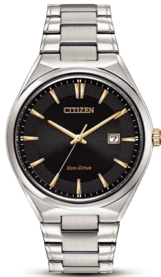
BM7310-56H $375.00 40 mm SSP MC SS FCP SP WR100