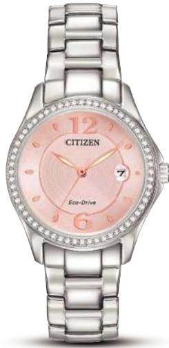
FE1140-86X $350.00 31 mm SSP MC SSP FCP SP WR50