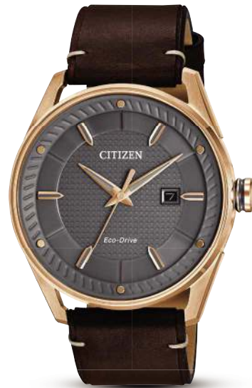
BM6983-00H $325.00 42 mm SSP MC LTHR BKL - WR100