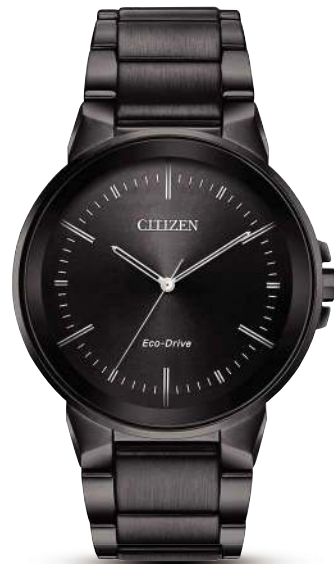
BJ6517-52E $425.00 41 mm SSP MC SSP FCP SP WR