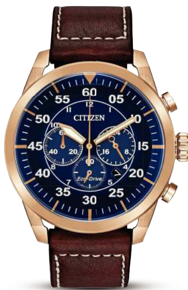
CA4213-18L $495.00 45 mm SSP MC LTHR BKL - WR100