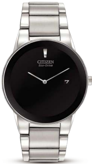
AU1060-51E $395.00 40 mm SS MC SS FCP SP WR