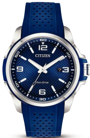
AW1158-05L $325.00 45 mm SS MC PU BKL - WR100