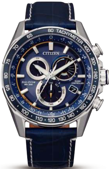
CB5918-02L $825.00 43 mm SS SC LTHR DCP - WR200