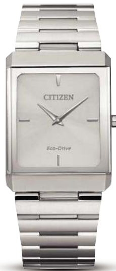
AR3100-56A $595.00 38x28 mm SS SC SS JLP PC WR