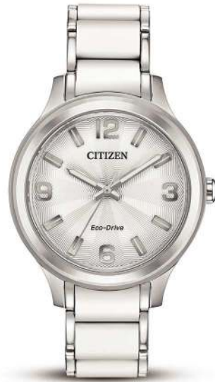
FE7070-52A $375.00 37 mm SS MC SSPU FCP SP WR100