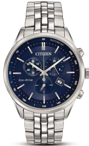
AT2141-52L $575.00 42 mm SS SC SS FCP SP WR100