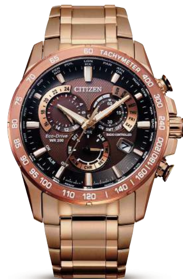
CB5896-54X $850.00 42 mm SSP CS SSP HDP SP WR200