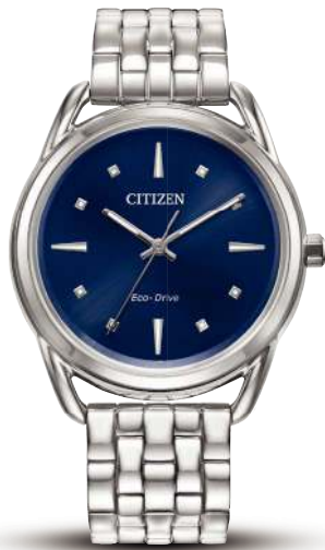
FE7090-55L $325.00 36 mm SS MC SS FCP SP WR