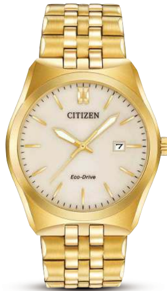
BM7332-53P $395.00 40 mm SSP MC SSP FCP SP WR100