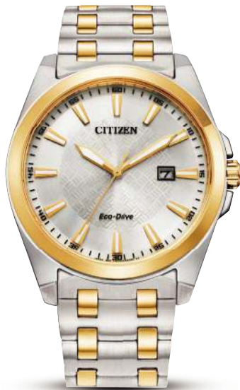
BM7534-59A $475.00 41 mm SSP SC SSP FCP SP WR100