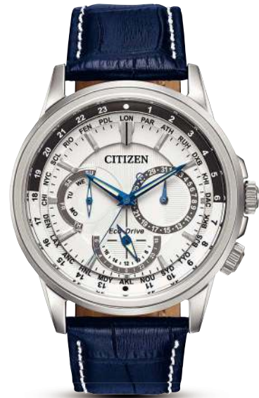
BU2020-02A $525.00 44 mm SS CM LTHR DCP - WR100