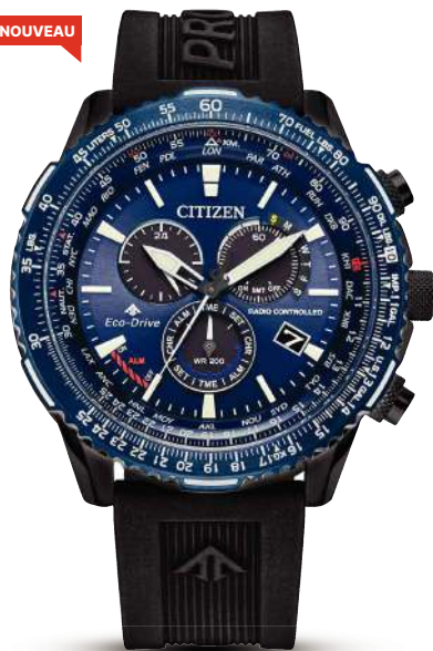
CB5006-02L $895.00 46 mm SSP CS PU BKL - WR200