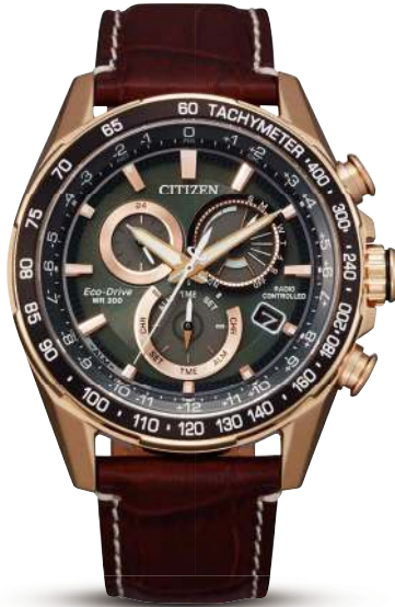
CB5919-00X $850.00 43 mm SSP SC LTHR DCP - WR200