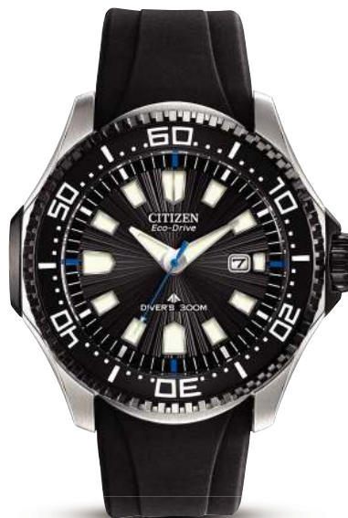
BN0085-01E $475.00 47 mm SSP CM PU BKL - 300M