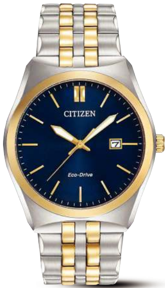
BM7334-58L $395.00 40 mm SSP MC SSP FCP SP WR100