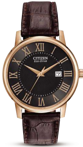
BM6759-03E $295.00 40 mm SSP MC LTHR BKL - WR