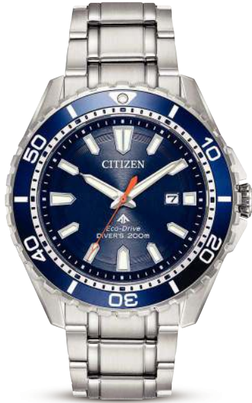
BN0191-55L $525.00 45 mm SS MC SS SCP PC 200M