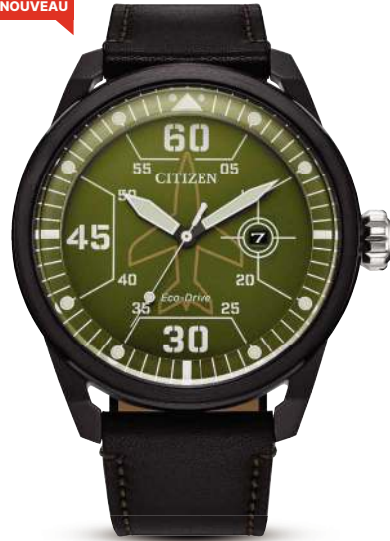
AW1735-03X $395.00 45 mm SSP MC LTHR BKL - WR100