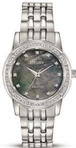
EM0770-52Y $475.00 31 mm SS MC SS FCP SP WR50