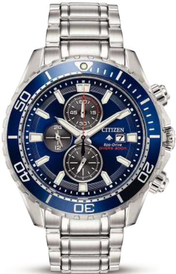
CA0710-82L $650.00 45 mm SS MC SS SCP PC 200M