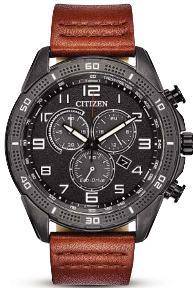
AT2447-01E $475.00 45 mm SSP MC LTHR BKL - WR100