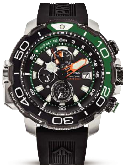
BJ2168-01E $1,095.00 46 mm SSC SC PU BKL - 200M