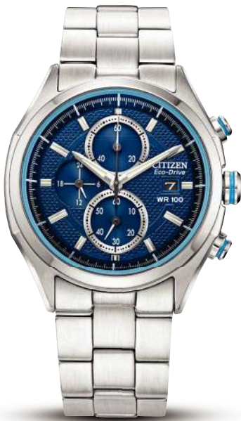
CA0430-54M $475.00 41 mm SS MC SS FCP SP WR100