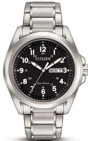
AW0050-82E $325.00 43 mm SS MC SS FCP SP WR100