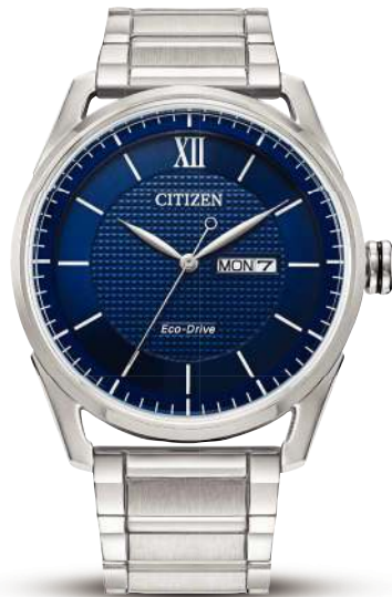
AW0081-54L $325.00 42 mm SS MC SS FCP SP WR100