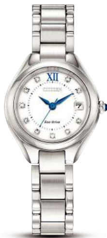
EW2540-83A $375.00 26 mm SS SC SS FCP SP WR50