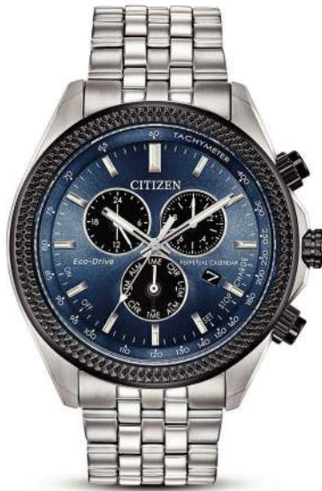
BL5568-54L $650.00 44 mm SSP MC SS HDP SP WR100