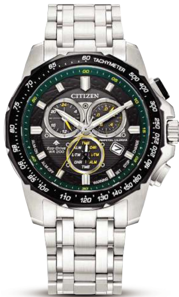
BL5578-51E $795.00 43 mm SSP SC SS SCP PC WR200