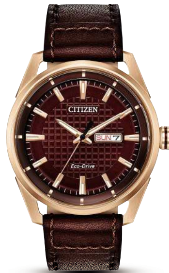
AW0083-08X $325.00 42 mm SSP MC LTHR BKL - WR100