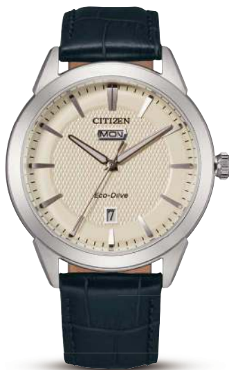
AW0090-11Z $450.00 40 mm SS SC LTHR DCP - WR100