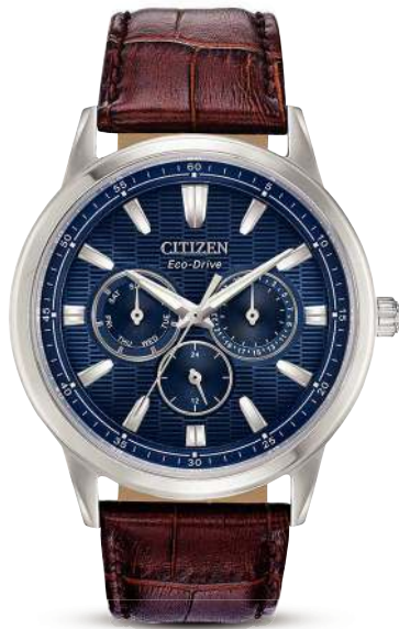
BU2070-12L $450.00 44 mm SS SC LTHR BKL - WR100