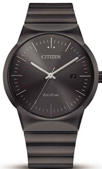
BM7587-52H $475.00 40 mm SSP MC SSP FCP PC WR