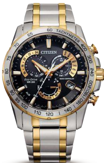
CB5894-50E $850.00 42 mm SSP CS SSP HDP SP WR200