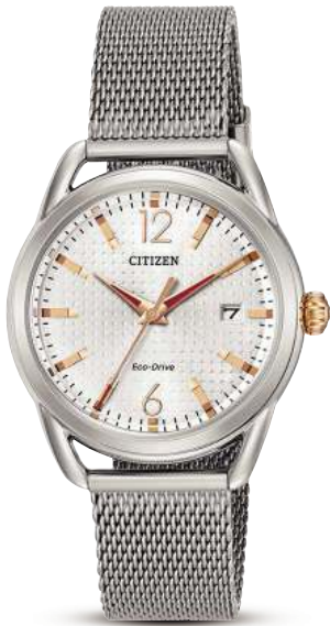
FE6081-51A $325.00 36 mm SSP MC SS BKL - WR