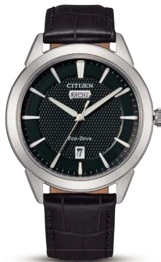
AW0090-02X $450.00 40 mm SS SC LTHR DCP - WR100