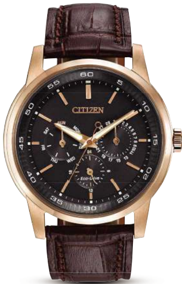
BU2013-08E $475.00 44 mm SSP MC LTHR BKL - WR100