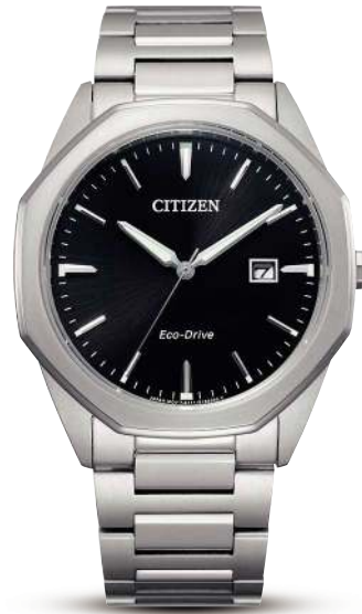
BM7490-52E $495.00 41 mm SS SC SS FCP SP WR100