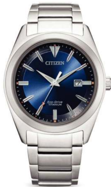
AW1640-83L $495.00 42mm TIC MC TIC FCP SP WR50