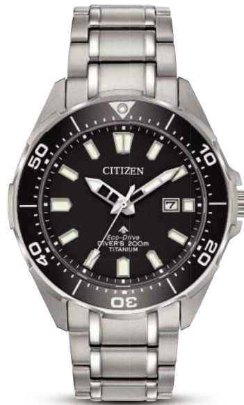
BN0200-56E $650.00 44 mm TIC CM TIC SCP PC 200M