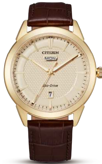
AW0092-07Q $475.00 40 mm SSP SC LTHR DCP - WR100