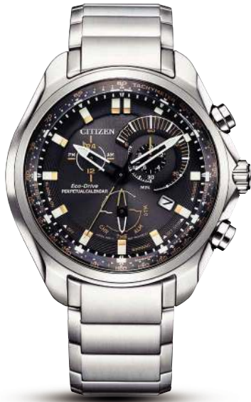
BL5600-53E $675.00 43 mm SS SC SS FCP PC WR100