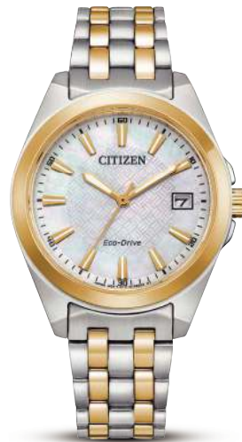
EO1224-54D $475.00 33 mm SSP SC SSP FCP SP WR100