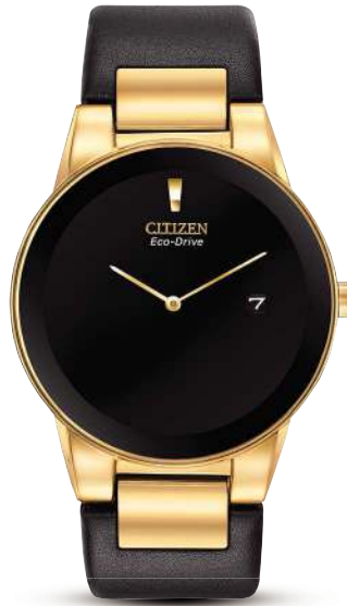
AU1062-05E $350.00 40 mm SSP MC LTHR BKL - WR