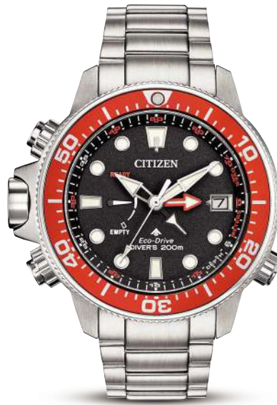
BN2039-59E $950.00 46 mm SS MC SS SCP PC 200M