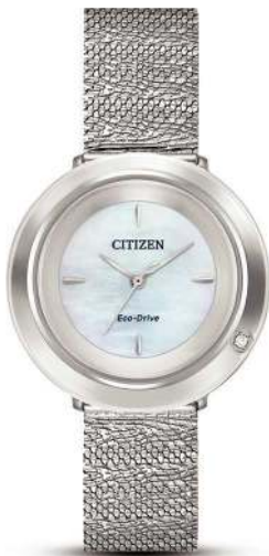
EM0640-58D $495.00 32 mm SS SC SS SLC - WR50

1 DIAMOND / DIAMANT MOTHER-OF-PEARL / NACRE