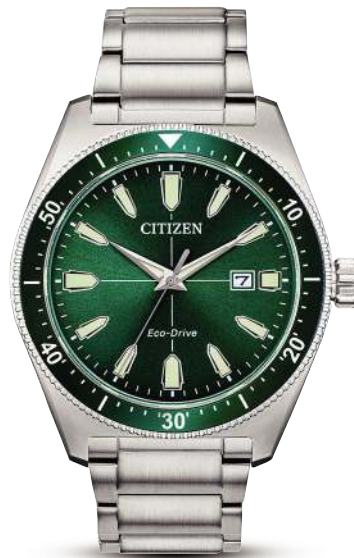
AW1598-70X $475.00 43 mm SS MC SS FCP SP WR100