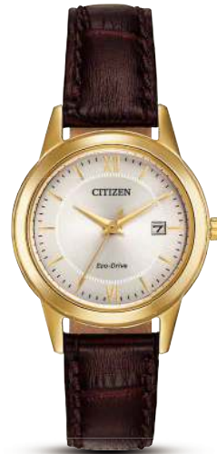
FE1082-05A $295.00 29 mm SSP MC LTHR BKL - WR