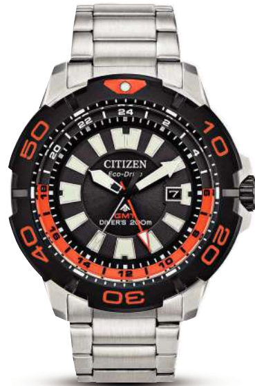
BJ7129-56E $695.00 44 mm SSP CS SS FCL PC 200M