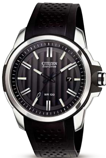
AW1150-07E $325.00 45 mm SS MC PU BKL - WR100