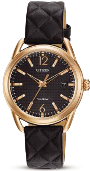
FE6083-13E $295.00 36 mm SSP MC LTHR BKL - WR