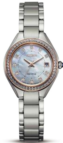
EW2556-59Y $450.00 26 mm SSP SC SS FCP SP WR50