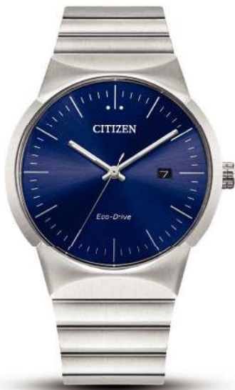
BM7580-51L $450.00 40 mm SS MC SS FCP PC WR