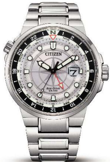
BJ7140-53A $650.00 44 mm SS SC SS HDP SP WR200