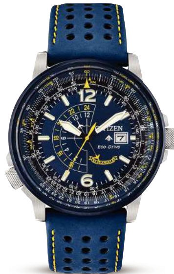
BJ7007-02L $550.00 42 mm SSP CM LTHR BKL - WR200

Le logo officiel des Blue Angels apparaît au dos du boîtier.