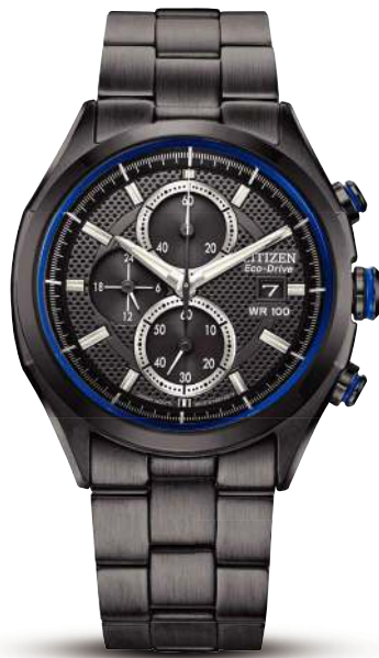
CA0438-52E $495.00 41 mm SSP MC SSP FCP SP WR100