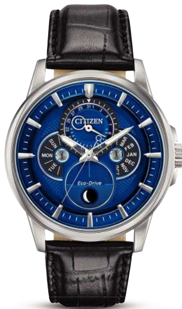
BU0050-02L $550.00 44 mm SS MC LTHR DCP - WR100