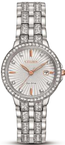
EW2340-58A $475.00 28 mm SSP MC SS FCP SP WR