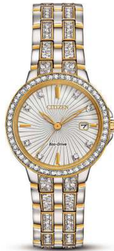
EW2344-57A $495.00 28 mm SSP MC SSP FCP SP WR