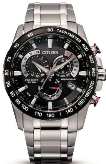
CB5898-59E $850.00 42 mm SSP CS SS HDP SP WR200