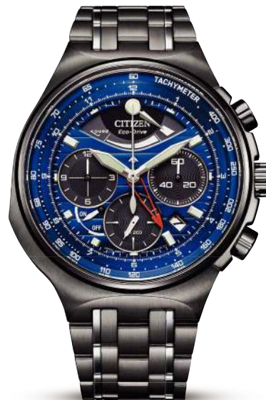
AV0097-51L $1,495.00 44 mm SSP SC SSP HDP PC WR200