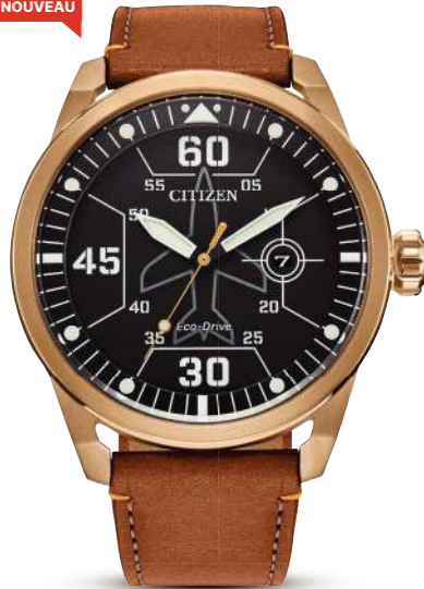
AW1733-09E $395.00 45 mm SSP MC LTHR BKL - WR100