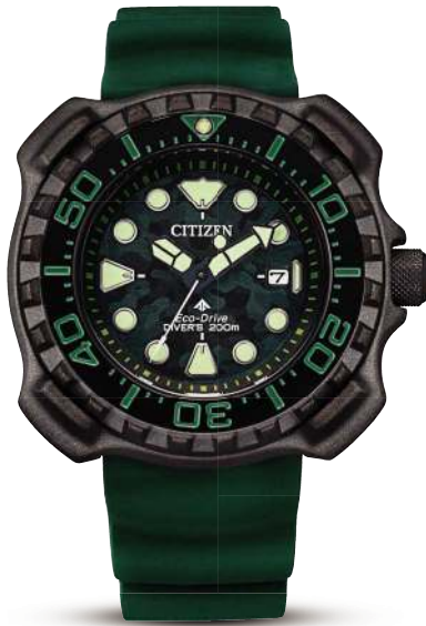
BN0228-06W $725.00 47mm TIC MC PU BKL - 200M