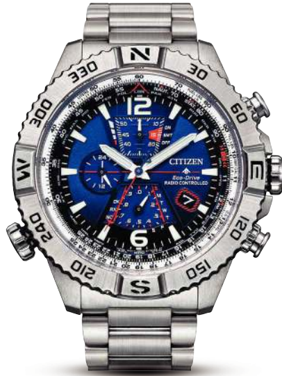
AT8220-55L $950.00 48 mm SS SC SS HDP PC WR200