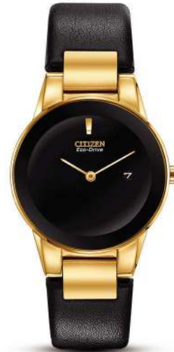
GA1052-04E $350.00 30 mm SSP MC LTHR BKL - WR