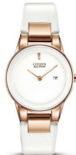
GA1053-01A $350.00 30 mm SSP MC LTHR BKL - WR