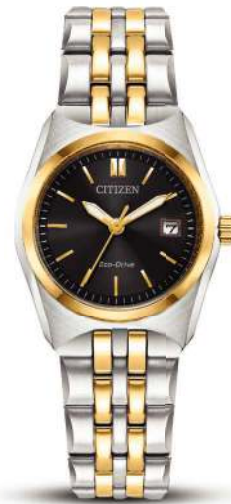
EW2299-50E $395.00 28 mm SSP MC SSP FCP SP WR100