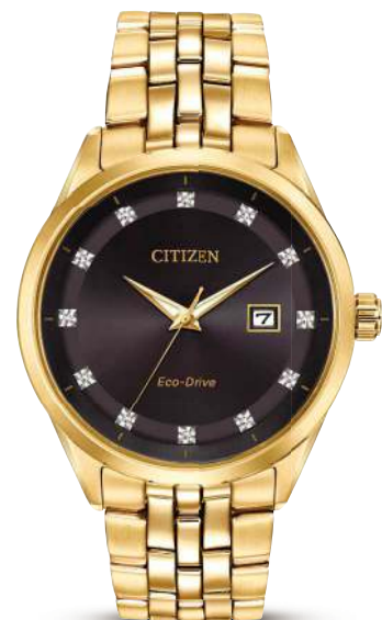
BM7252-51G $625.00 41 mm SSP SC SSP FCP SP WR100