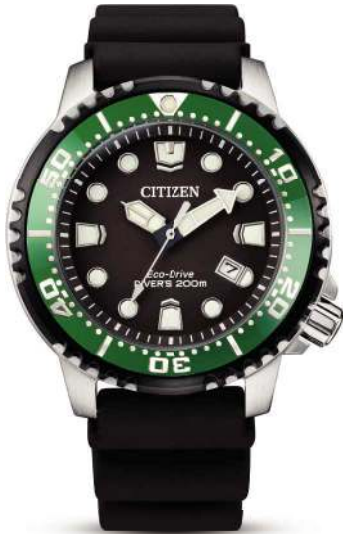
BN0155-08E $475.00 44 mm SSP CM PU BKL - 200M