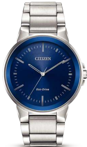
BJ6510-51L $395.00 41 mm SS MC SS FCP SP WR