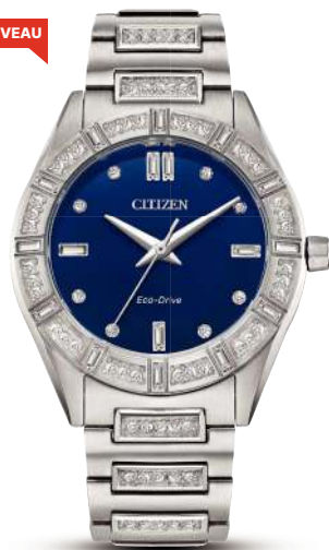
EM1020-57L $475.00 34 mm SS SC SS FCP SP WR50