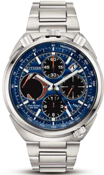
AV0070-57L $1,195.00 45 mm SS CS SS HDP PC WR200