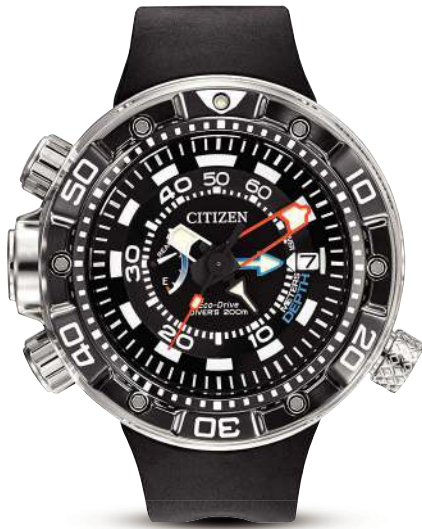
BN2029-01E $1,150.00 53 mm SSC CM PU BKL - 200M