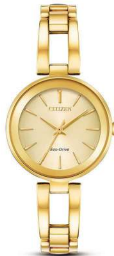
EM0638-50P $395.00 28 mm SSP MC SSP FCP SP WR