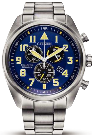
AT2480-57L $595.00 44 mm TIC SC TIC FCP PC WR100