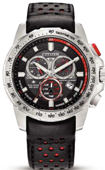
BL5570-01E $750.00 43 mm SSP SC LTHR DCP - WR200