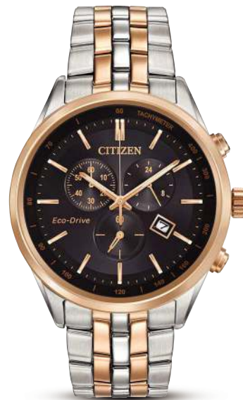
AT2146-59E $595.00 42 mm SSP SC SSP FCP SP WR100