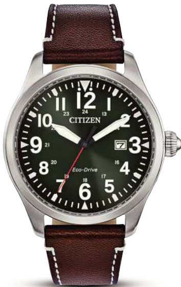
BM6838-09X $325.00 42 mm SS MC LTHR BKL - WR100