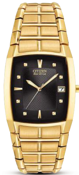
BM6552-52E $425.00 33x31 mm SSP MC SSP DCP SP WR