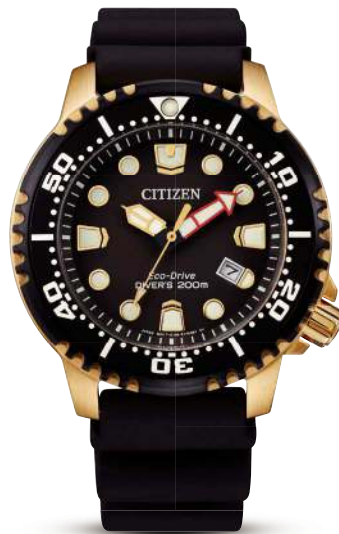
BN0152-06E $495.00 44 mm SSP CM PU BKL - 200M