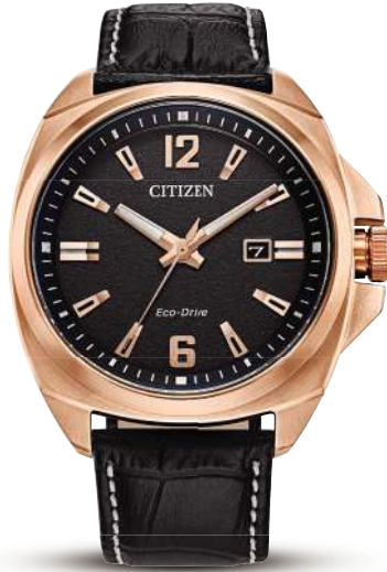
AW1723-02E $550.00 42 mm SSP SC LTHR DCP - WR100