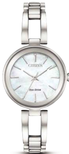
EM0630-51D $350.00 28 mm SS MC SS FCP SP WR