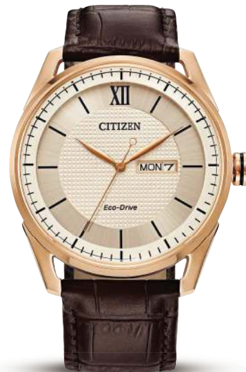
AW0082-01A $325.00 42 mm SSP MC LTHR BKL - WR100