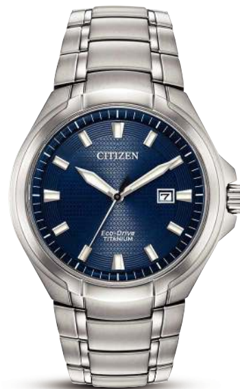
BM7431-51L $495.00 43 mm TIC SC TIC FCP PC WR100