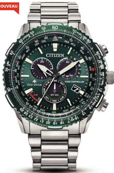
CB5004-59W $925.00 46 mm SSP CS SS SCP PC WR200