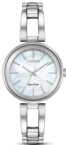
EM0630-51D $295.00 28 mm SS MC SS FCP SP WR