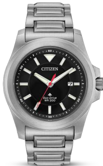
BN0211-50E $575.00 42 mm SSC CS SSC SCP SP WR200