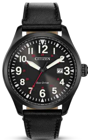
BM6835-15E $295.00 42 mm SSP MC LTHR BKL - WR100