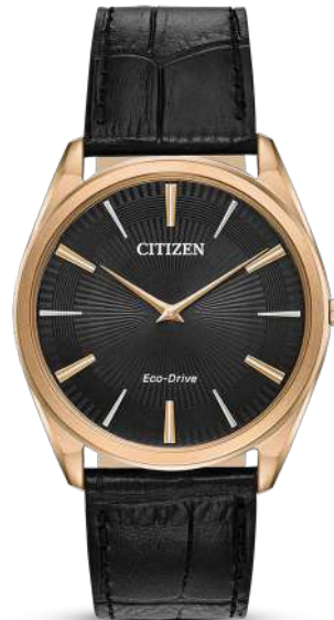
AR3073-06E $475.00 38 mm SSP SC LTHR BKL - WR