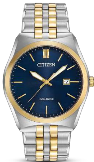
BM7334-58L $350.00 40 mm SSP MC SSP FCP SP WR100