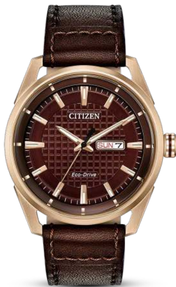
AW0083-08X $275.00 42 mm SSP MC LTHR BKL - WR100