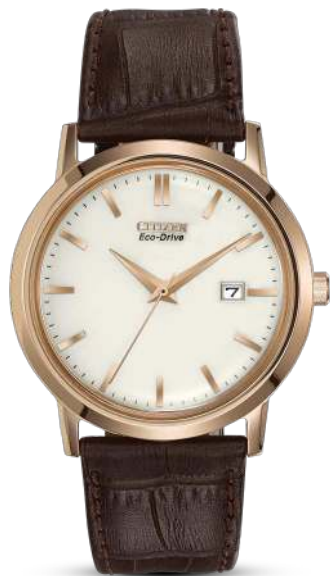
BM7193-07B $265.00 40 mm SSP MC LTHR BKL - WR