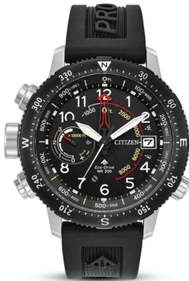
BN5058-07E $750.00 46 mm SSP CM PU BKL - WR200