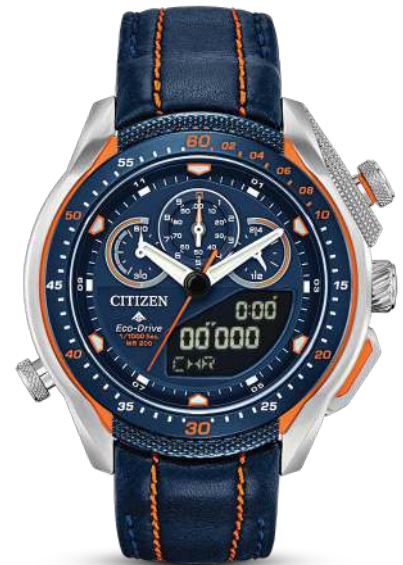
JW0139-05L $925.00 46 mm SSP CS LTHR BKL - WR200