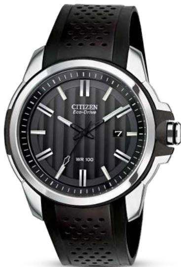
AW1150-07E $275.00 45 mm SS MC PU BKL - WR100