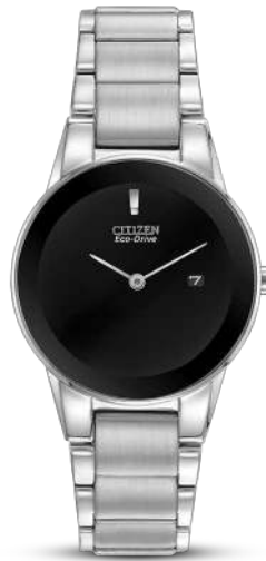
GA1050-51E $295.00 30 mm SS MC SS FCP SP WR