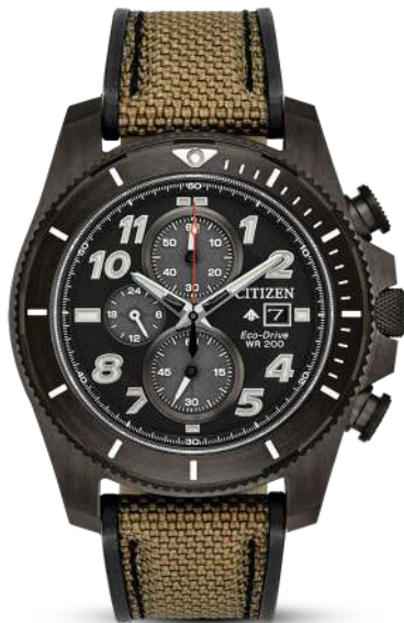
CA0727-04E $695.00 44 mm SSC CS NYPU BKL - WR200