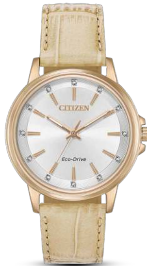
FE7033-08A $325.00 37 mm SSP MC LTHR BKL - WR50