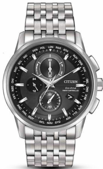
AT8110-53E $750.00 43 mm SS SC SS DCP PC WR100