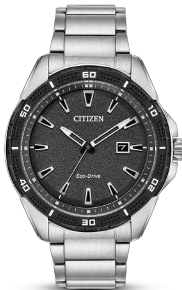
AW1588-57E $325.00 45 mm SS MC SS FCP SP WR100