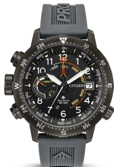
BN5057-00E $795.00 46 mm SSP CM PU BKL - WR200