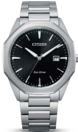
BM7490-52E $475.00 41 mm SS SC SS FCP SP WR100