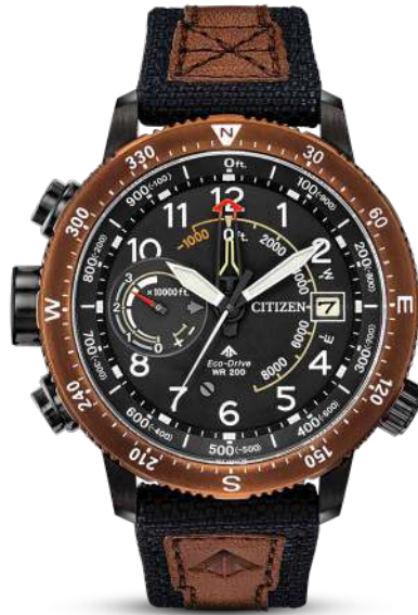
BN5055-05E $795.00 46 mm SSP CM NYLN BKL - WR200