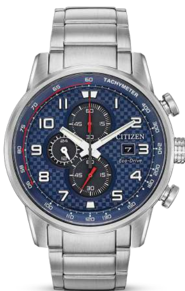
CA0680-57L $495.00 45 mm SS MC SS FCP SP WR100