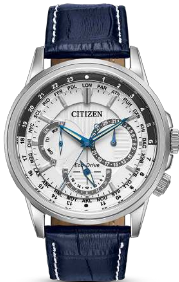
BU2020-02A $450.00 44 mm SS CM LTHR DCP - WR100