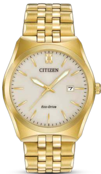
BM7332-53P $350.00 40 mm SSP MC SSP FCP SP WR100