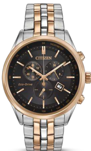
AT2146-59E $495.00 42 mm SSP SC SSP FCP SP WR100