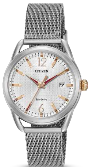
FE6081-51A $295.00 36 mm SSP MC SS BKL - WR