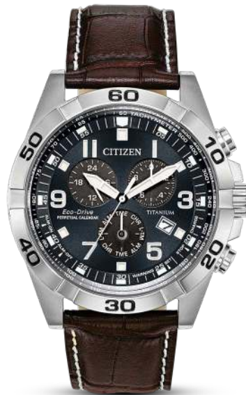
BL5551-06L $550.00 43 mm TIC MC LTHR BKL - WR100