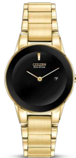
GA1052-55E $325.00 30 mm SSP MC SSP FCP SP WR