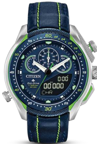
JW0138-08L $925.00 46 mm SSP SC LTHR BKL - WR200