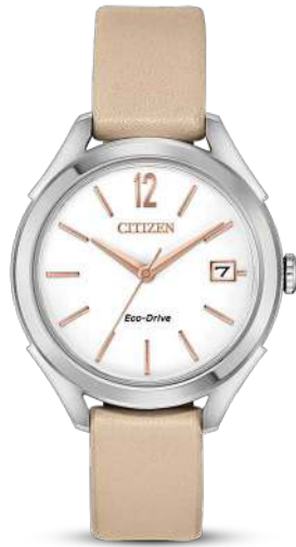
FE6140-03A $250.00 34 mm SS MC LTHR BKL - WR