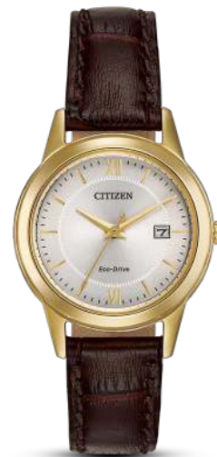
FE1082-05A $250.00 29 mm SSP MC LTHR BKL - WR