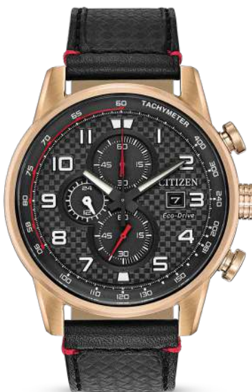
CA0683-08E $475.00 45 mm SSP MC LTHR BKL - WR100