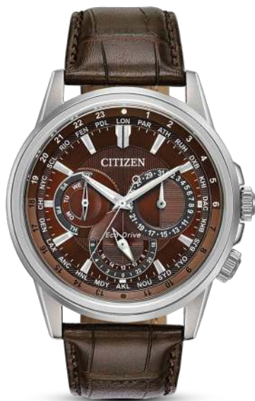
BU2020-29X $450.00 44 mm SS CM LTHR DCP - WR100