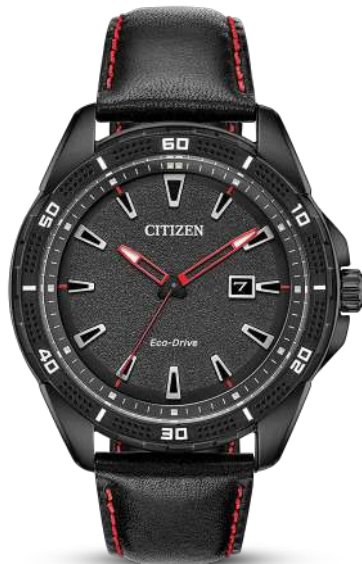
AW1585-04E $325.00 45 mm SSP MC LTHR BKL - WR100