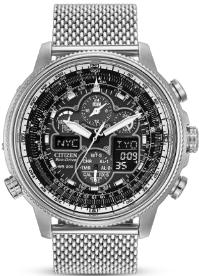
JY8030-83E $795.00 48 mm SS CM SS DCP SP WR200