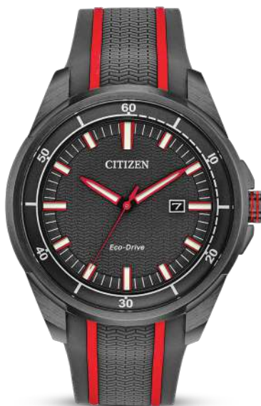
AW1607-03H $325.00 45 mm SSP MC PU BKL - WR100