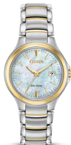
EW2524-55N $350.00 30 mm SSP MC SSP FCP SP WR50