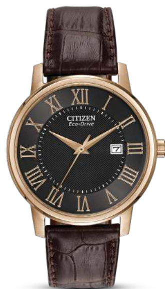
BM6759-03E $250.00 40 mm SSP MC LTHR BKL - WR