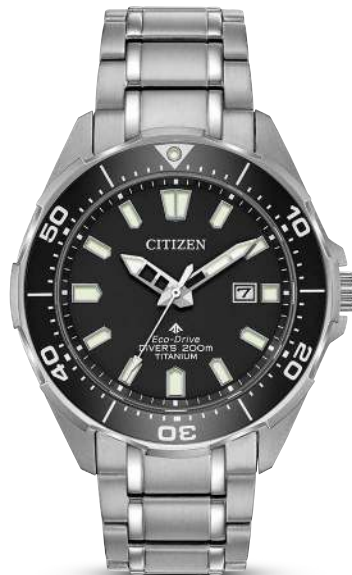
BN0200-56E $595.00 44 mm TIC CM TIC SCP PC 200M