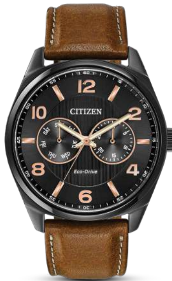
AO9025-05E $295.00 43 mm SSP MC LTHR BKL - WR100