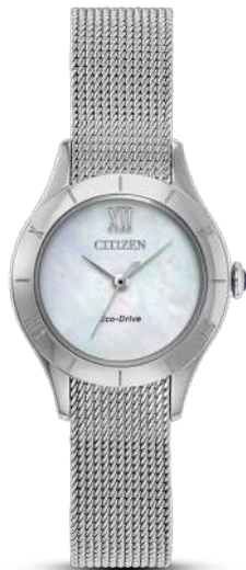
EM0780-83D $395.00 29 mm SS SC SS SLC - WR50