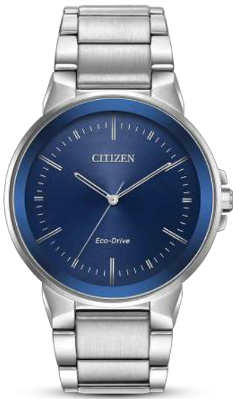
BJ6510-51L $325.00 41 mm SS MC SS FCP SP WR