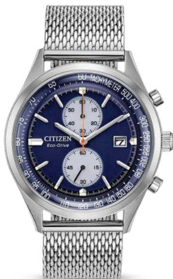
CA7020-58L $475.00 43 mm SS MC SS SLC - WR100