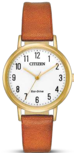
EM0572-05A $265.00 30 mm SSP MC LTHR BKL - WR50