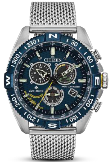
CB5848-57L $895.00 46 mm SSP SC SS DCP SP WR200

Use of the Blue Angels name and logo is with the permission, but not endorsement, of the U.S. Navy. L'usage du nom et logo de Blue Angels est avec l'autorisation, mais pas l'approbation du U.S. Navy.