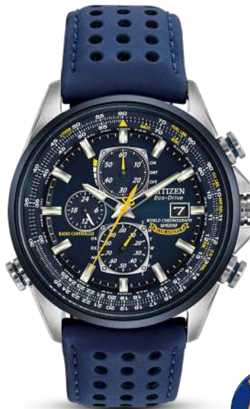
AT8020-03L $695.00 43 mm SSP CS PUL BKL - WR200