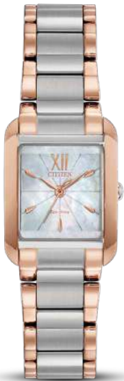
EW5556-52D $475.00 28X22 mm SSP SC SSP DCP SP WR50