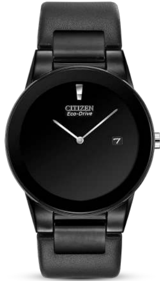
AU1065-07E $265.00 40 mm SSP MC LTHR BKL - WR