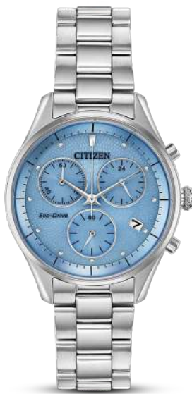
FB1440-57L $425.00 32 mm SS MC SS FCP PC WR