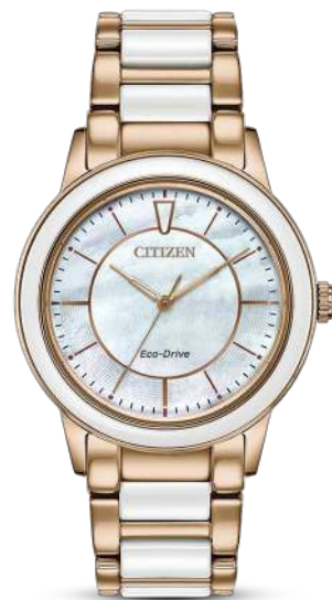
EM0743-55D $475.00 36 mm SSCP MC SSCP FCP SP WR100