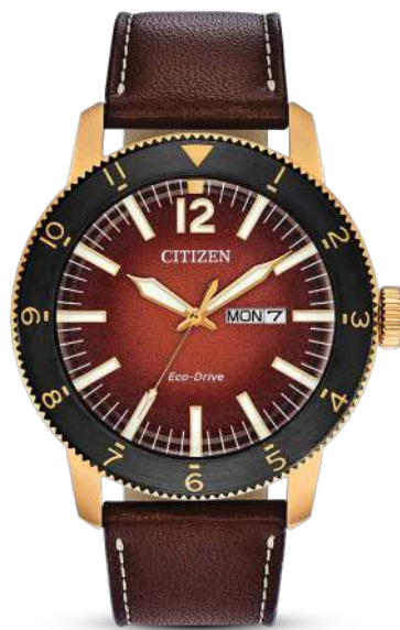
AW0076-03X $395.00 44 mm SSP MC LTHR BKL - WR100