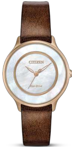
EM0383-08D $395.00 30 mm SSP SC LTHR BKL - WR50