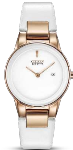
GA1053-01A $265.00 30 mm SSP MC LTHR BKL - WR