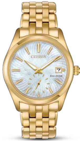
EV1032-51D $450.00 36 mm SSP MC SSP FCP SP WR100