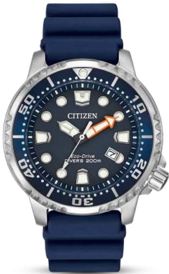
BN0151-09L $395.00 42 mm SS CM PU BKL - 200M