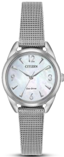
EM0680-53D $295.00 27 mm SS MC SS SLC - WR