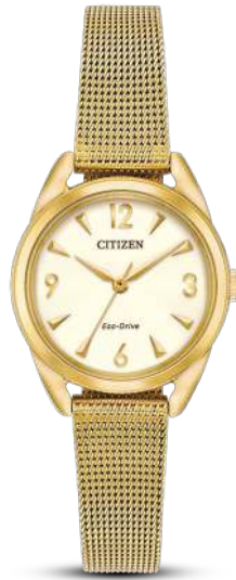
EM0682-58P $325.00 27 mm SSP MC SSP SLC - WR