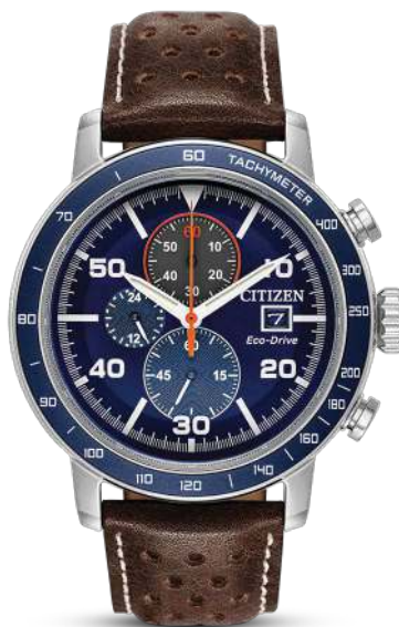
CA0648-09L $375.00 44 mm SS MC LTHR BKL - WR100