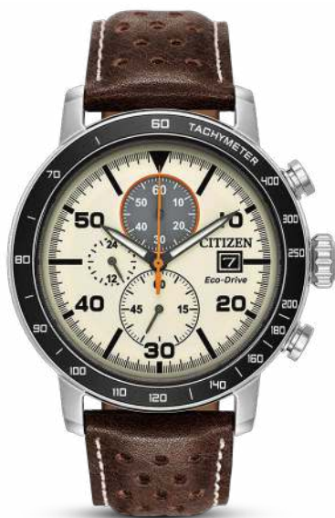
CA0649-06X $375.00 44 mm SS MC LTHR BKL - WR100