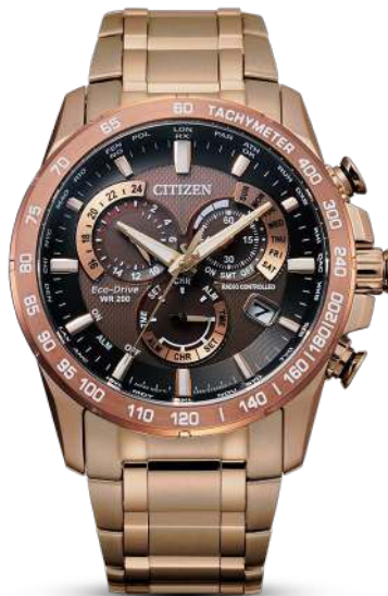
CB5896-54X $850.00 42 mm SSP CS SSP HDP SP WR200