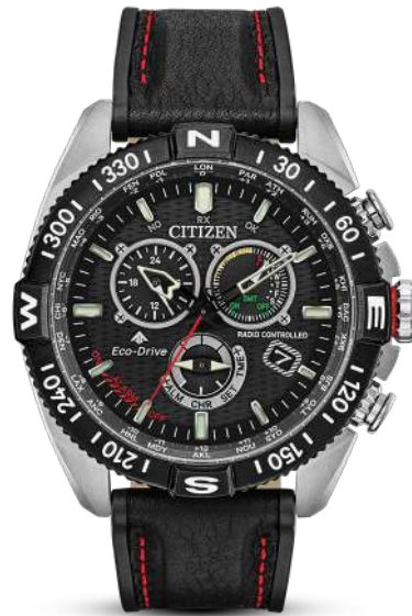
CB5841-05E $795.00 46 mm SSP SC LTHR BKL - WR200