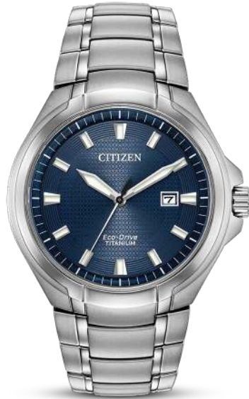
BM7431-51L $450.00 43 mm TIC SC TIC FCP PC WR100