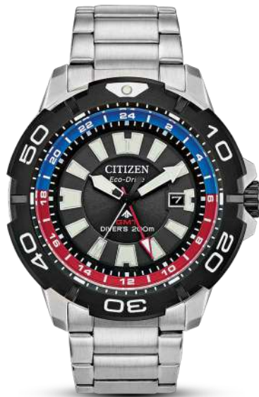
BJ7128-59E $650.00 44 mm SS CS SS FCL PC 200M