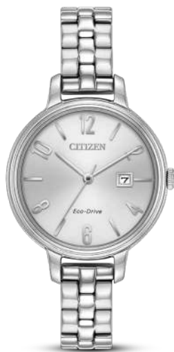
EW2440-53A $275.00 31 mm SS MC SS FCP SP WR50