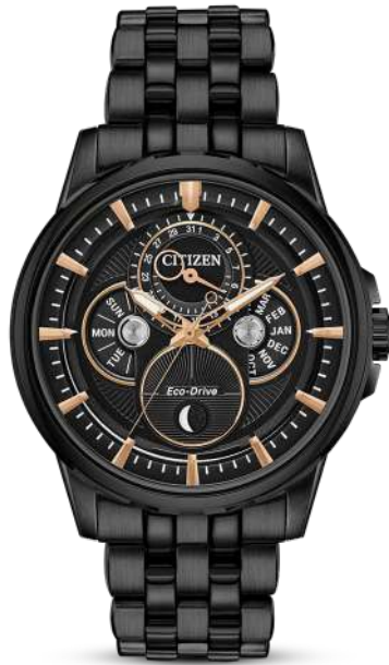
BU0057-54E $650.00 44 mm SSP MC SSP DCP SP WR100