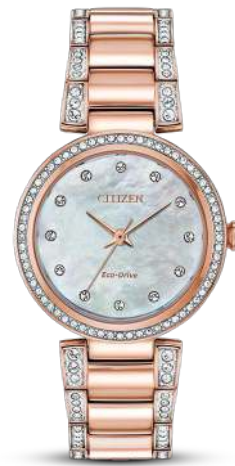
EM0843-51D $475.00 28 mm SSP MC SSP FCP SP WR50