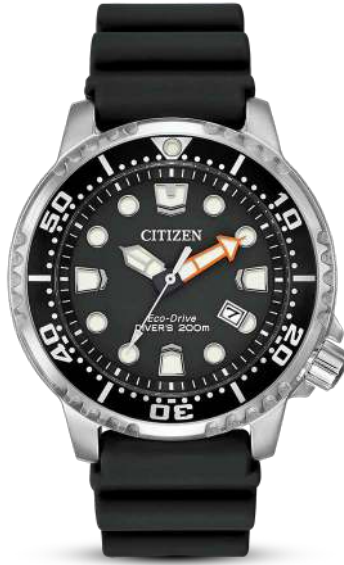
BN0150-28E $395.00 42 mm SS CM PU BKL - 200M