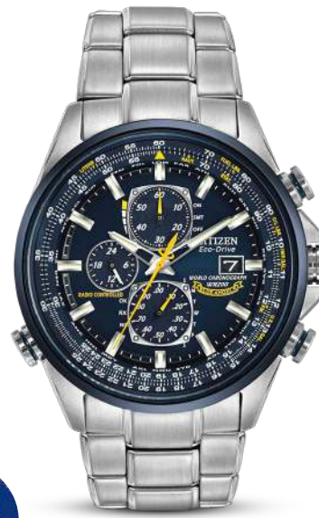
AT8020-54L $750.00 43 mm SSP CS SS HDP SP WR200