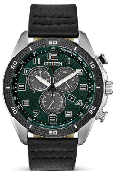
AT2441-08X $395.00 45 mm SS MC LTHR BKL - WR100