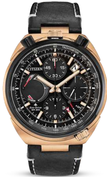
AV0073-08E $1,195.00 45 mm SSP CS LTHR DCP - WR200