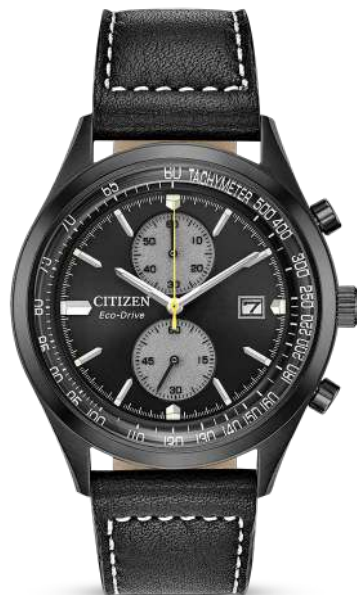
CA7027-08E $475.00 43 mm SSP MC LTHR BKL - WR100