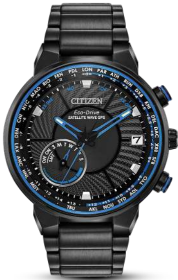
CC3038-51E $950.00 44 mm SSP MC SSP FCP SP WR100