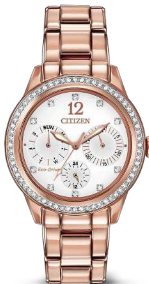
FD2013-50A $450.00 37 mm SSP MC SSP FCP SP WR