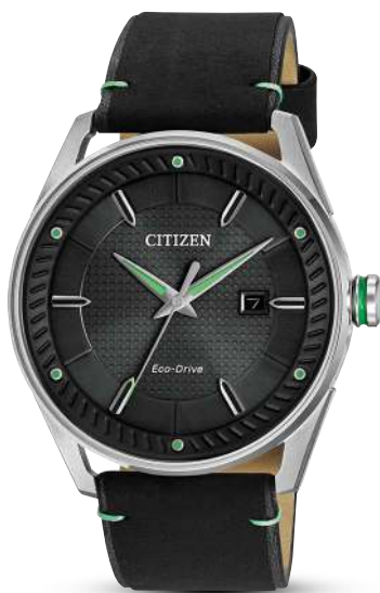
BM6980-08E $250.00 42 mm SS MC LTHR BKL - WR100