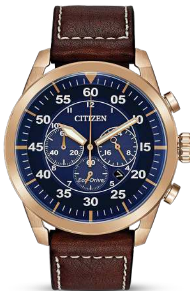
CA4213-18L $395.00 45 mm SSP MC LTHR BKL - WR100