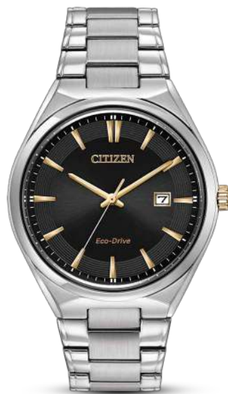
BM7310-56H $325.00 40 mm SSP MC SS FCP SP WR100