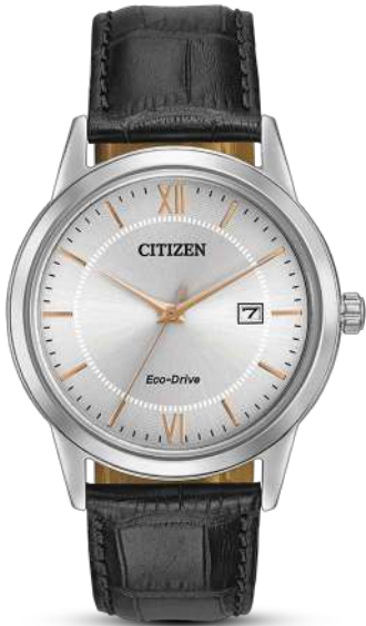
AW1236-03A $235.00 40 mm SS MC LTHR BKL - WR