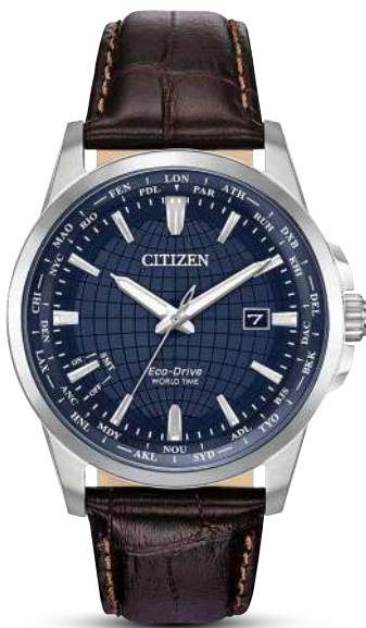
BX1000-06L $475.00 41 mm SS SC LTHR BKL SP WR50