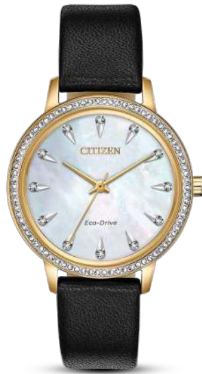
FE7042-07D $395.00 36 mm SSP MC LTHR BKL - WR50