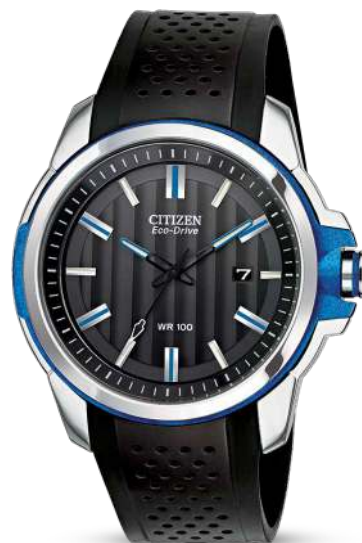
AW1151-04E $275.00 45 mm SS MC PU BKL - WR100