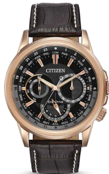
BU2023-04E $475.00 44 mm SSP CM LTHR DCP - WR100