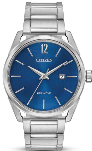
BM7410-51L $295.00 42 mm SS MC SS FCP SP WR100