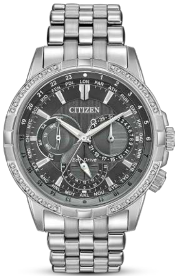
BU2080-51H $825.00 44 mm SS CM SS DCP SP WR100