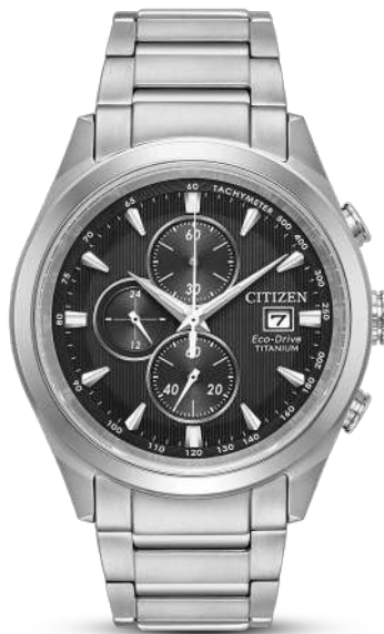
CA0650-58E $550.00 43 mm TIC SC TIC FCP PC WR100