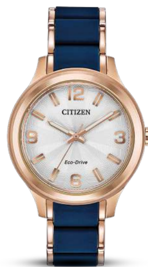
FE7073-71A $395.00 37 mm SSP MC SSPU FCP SP WR100