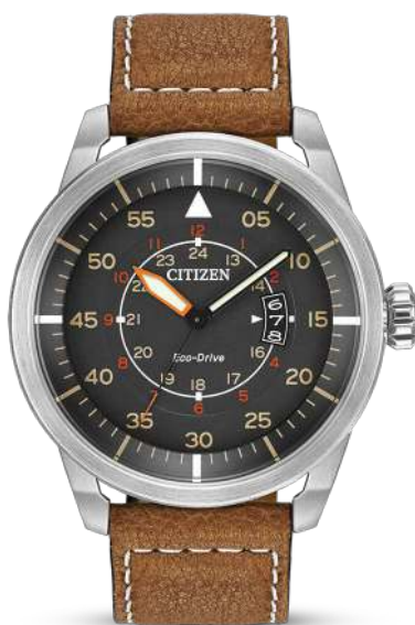
AW1361-10H $250.00 45 mm SS MC LTHR BKL - WR100