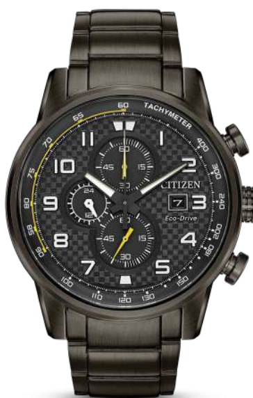
CA0687-58E $525.00 45 mm SSP MC SSP FCP SP WR100