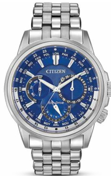
BU2021-51L $550.00 44 mm SS CM SS DCP SP WR100