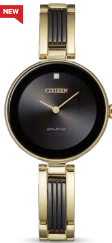
EX1539-57E $425.00 28 mm SSP MC SSP FCP SP WR