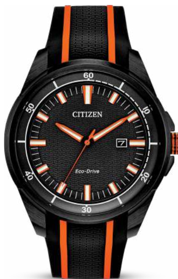
AW1608-01E $325.00 45 mm SSP MC PU BKL - WR100