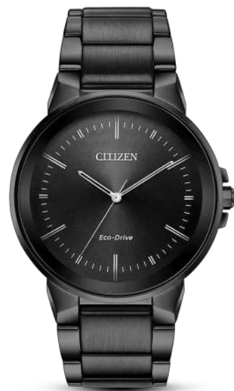
BJ6517-52E $350.00 41 mm SSP MC SSP FCP SP WR