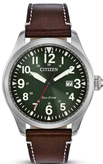
BM6838-09X $275.00 42m m SS MC LTHR BKL - WR100