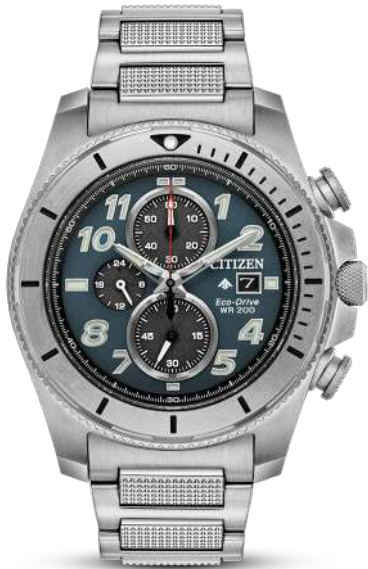
CA0720-54H $750.00 44 mm SSC CS SSC SCP SP WR200