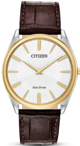
AR3074-03A $475.00 38 mm SSP SC LTHR BKL - WR