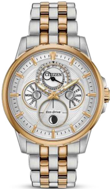
BU0056-57A $650.00 44 mm SSP MC SSP DCP SP WR100