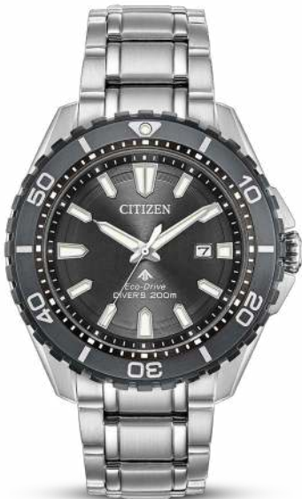
BN0198-56H $495.00 45 mm SSP MC SS SCP PC 200M