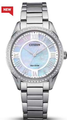
EM0880-54D $1,050.00 32 mm SS SC SS DCP SP WR50