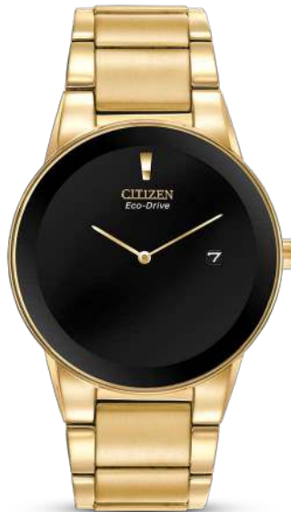
AU1062-56E $325.00 40 mm SSP MC SSP FCP SP WR