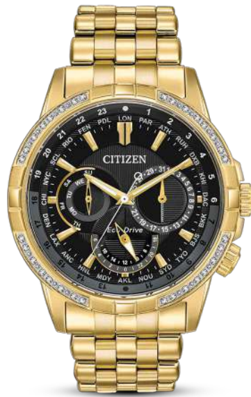
BU2082-56E $875.00 44 mm SSP CM SSP DCP SP WR100