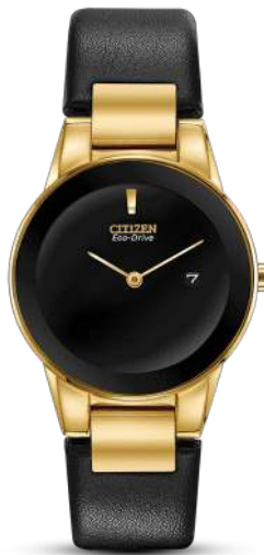
GA1052-04E $265.00 30 mm SSP MC LTHR BKL - WR