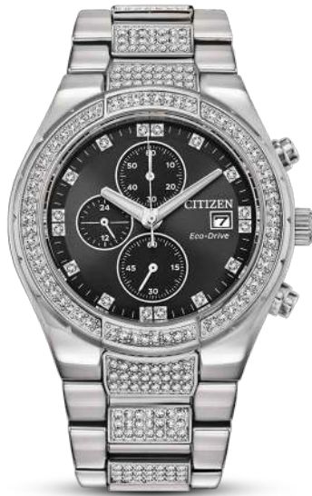
CA0750-53E $675.00 42 mm SS MC SS FCP SP WR50