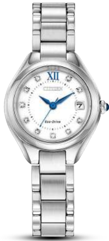
EW2540-83A $375.00 26 mm SS MC SS FCP SP WR50