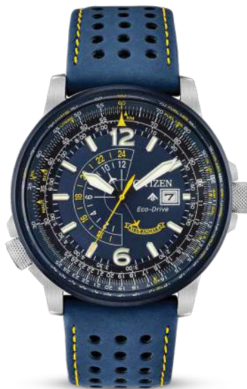
BJ7007-02L $475.00 42 mm SSP CM LTHR BKL - WR200

Le logo officiel des Blue Angels apparaît au dos du boîtier.