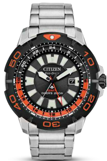
BJ7129-56E $650.00 44 mm SS CS SS FCL PC 200M