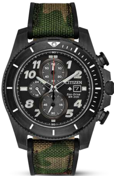
CA0727-12E $695.00 44 mm SSC CS NYPU BKL - WR200