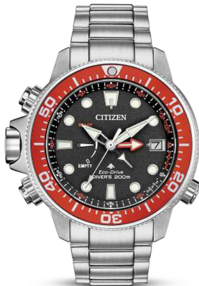
BN2039-59E $895.00 46 mm SS MC SS SCP PC 200M