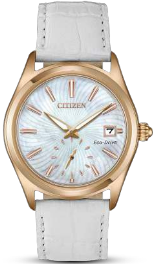
EV1033-08D $395.00 36 mm SSP MC LTHR BKL - WR100