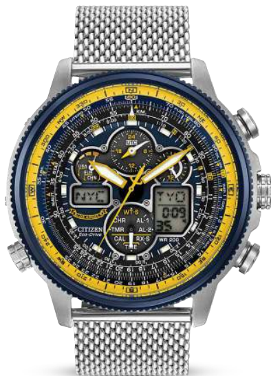
JY8031-56L $875.00 48 mm SSP CM SS DCP SP WR200