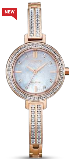
EM0863-53D $495.00 25 mm SSP MC SSP JLP SP WR50