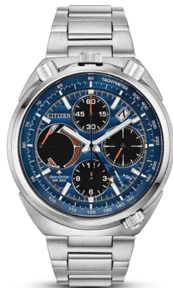
AV0070-57L $1,195.00 45 mm SS CS SS HDP PC WR200