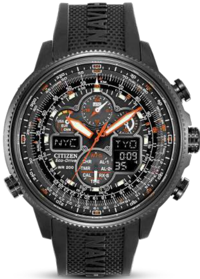
JY8035-04E $750.00 48 mm SSP CM PU HDP CB WR200