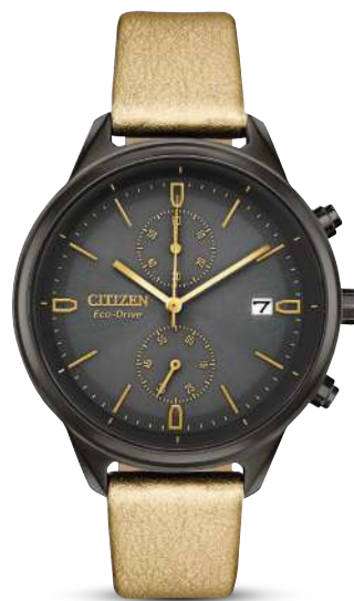
FB2007-04H $395.00 39 mm SSP MC LTHR BKL - WR50