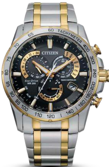
CB5894-50E $850.00 42 mm SSP CS SSP HDP SP WR200