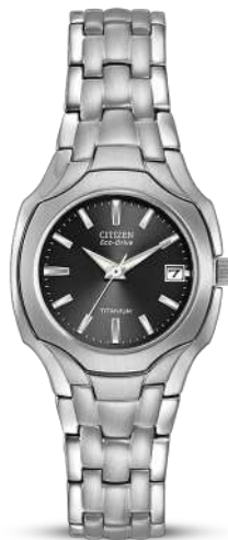
EW1400-53H $425.00 25 mm TIC MC TIC FCP PC WR