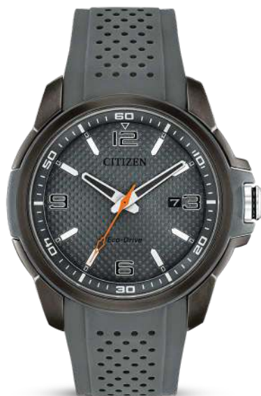
AW1157-08H $295.00 45 mm SSP MC PU BKL - WR100