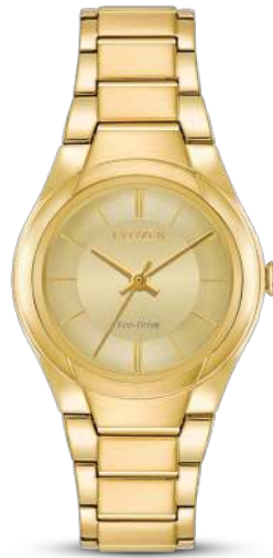
FE2092-57P $350.00 29 mm SSP MC SSP FCP SP WR50