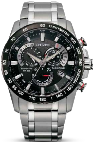
CB5898-59E $850.00 42 mm SSP CS SS HDP SP WR200