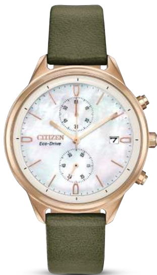
FB2008-01D $395.00 39 mm SSP MC LTHR BKL - WR50