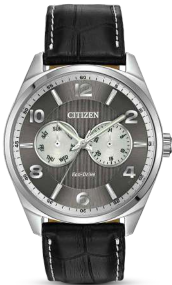
AO9020-17H $275.00 43 mm SS MC LTHR BKL - WR100