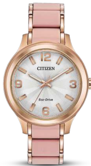
FE7073-54A $395.00 37 mm SSP MC SSPU FCP SP WR100