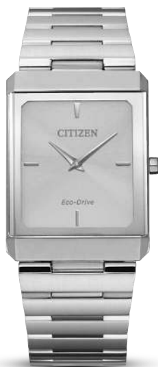
AR3100-56A $595.00 38x28 mm SS SC SS JLP PC WR