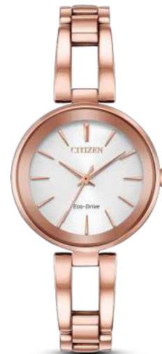
EM0633-53A $350.00 28 mm SSP MC SSP FCP SP WR