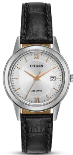
FE1086-04A $235.00 29 mm SS MC LTHR BKL - WR