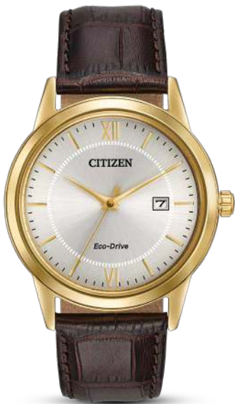
AW1232-04A $250.00 40 mm SSP MC LTHR BKL - WR