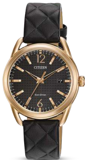
FE6083-13E $275.00 36 mm SSP MC LTHR BKL - WR