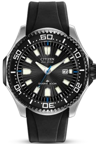
BN0085-01E $395.00 47 mm SSP CM PU BKL - 300M