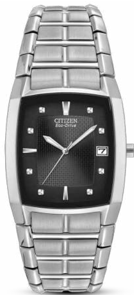
BM6550-58E $325.00 33x31 mm SS MC SS DCP SP WR