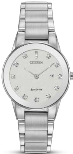
GA1050-51B $395.00 30 mm SS MC SS FCP SP WR