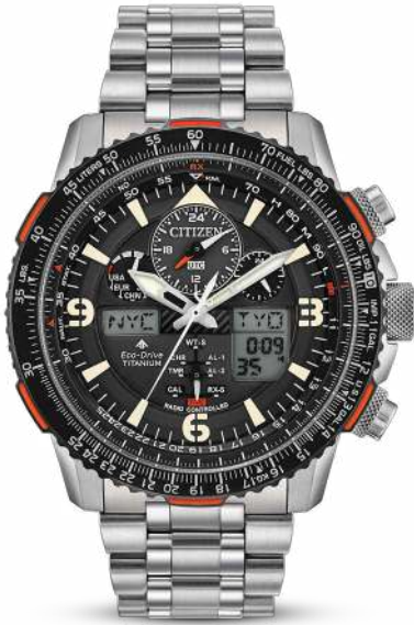
JY8108-53E $1,250.00 45 mm TIC CS TIC HDP SP WR200