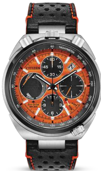
AV0078-04X $1,195.00 45 mm SSP CS LTHR DCP - WR200