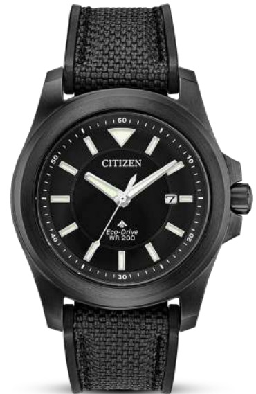
BN0217-02E $525.00 42 mm SSC CS NYPY BKL - WR200