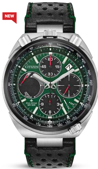
AV0076-00X $1,195.00 45 mm SSP CS LTHR DCP - WR200