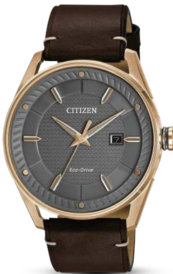
BM6983-00H $275.00 42 mm SSP MC LTHR BKL - WR100