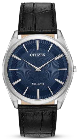
AR3070-04L $450.00 38 mm SS SC LTHR BKL - WR