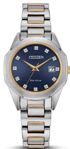
EW2584-53L $595.00 28 mm SSP SC SSP FCP SP WR50