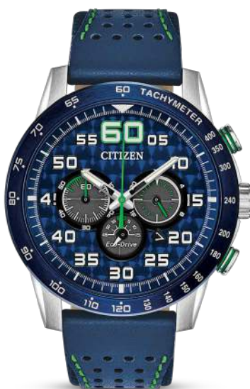
CA4438-00L $475.00 44 mm SSP MC LTHR BKL - WR100