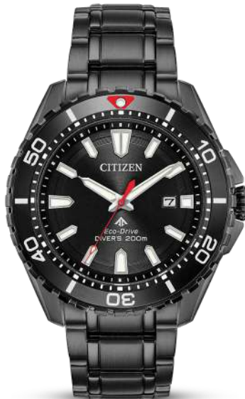
BN0195-54E $550.00 45 mm SSP MC SSP SCP PC 200M