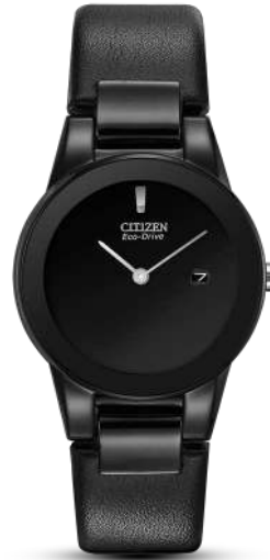
GA1055-06E $265.00 30 mm SSP MC LTHR BKL - WR