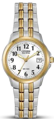
EW1544-53A $325.00 26 mm SSP MC SSP FCP SP WR100