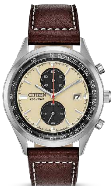
CA7020-07A $450.00 43 mm SS MC LTHR BKL - WR100