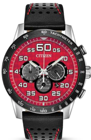
CA4430-01X $475.00 44 mm SSP MC LTHR BKL - WR100