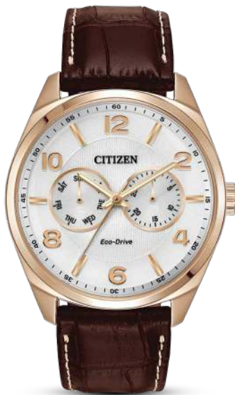
AO9023-01A $295.00 43 mm SSP MC LTHR BKL - WR100