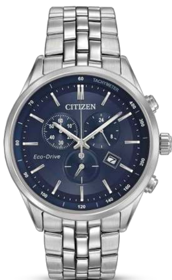
AT2141-52L $475.00 42 mm SS SC SS FCP SP WR100