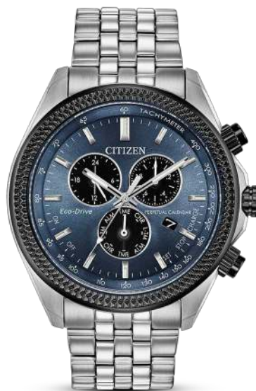
BL5568-54L $595.00 44 mm SSP MC SS HDP SP WR100