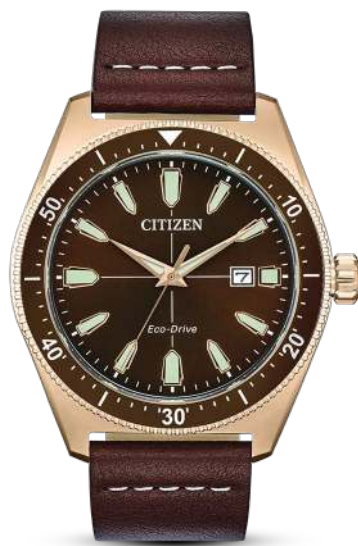
AW1593-06X $395.00 43 mm SSP MC LTHR BKL - WR100