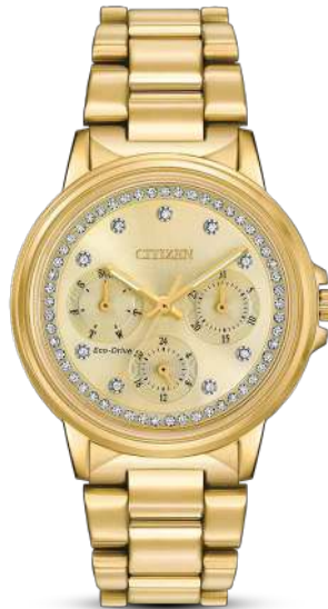
FD2042-51P $495.00 36 mm SSP MC SSP FCP SP WR50