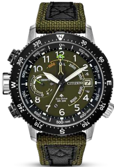
BN5050-09X $795.00 46 mm SSP CM NYLN BKL - WR200