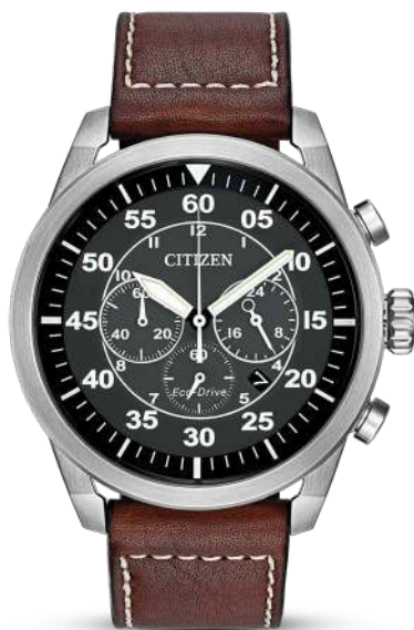
CA4210-24E $375.00 45 mm SS MC LTHR BKL - WR100