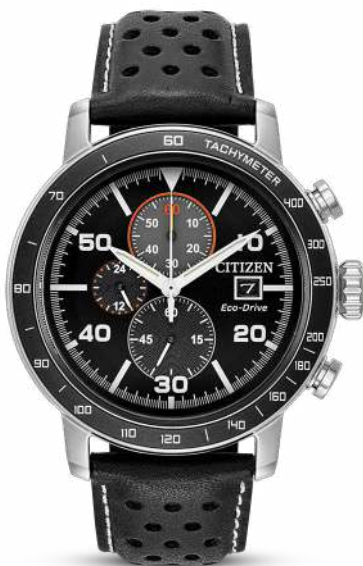
CA0649-14E $375.00 44 mm SS MC LTHR BKL - WR100