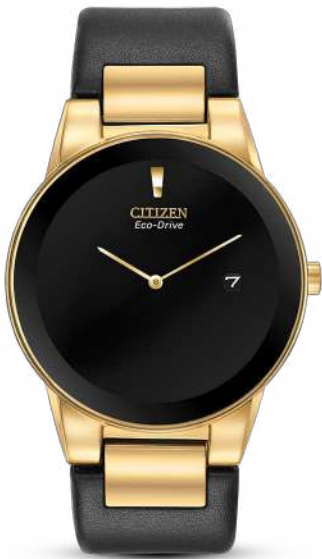
AU1062-05E $265.00 40 mm SSP MC LTHR BKL - WR