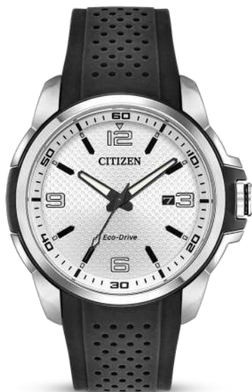
AW1150-07A $275.00 45 mm SS MC PU BKL - WR100