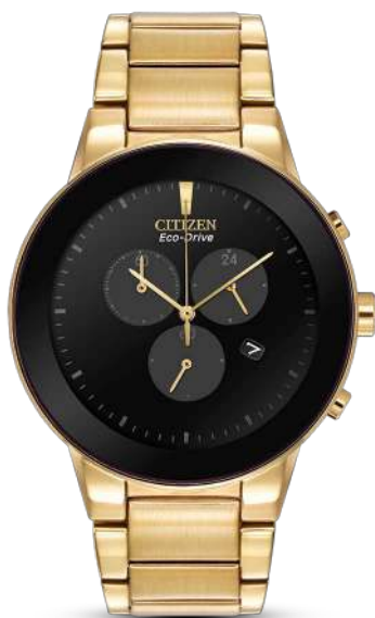
AT2242-55E $425.00 43 mm SSP MC SSP FCP SP WR