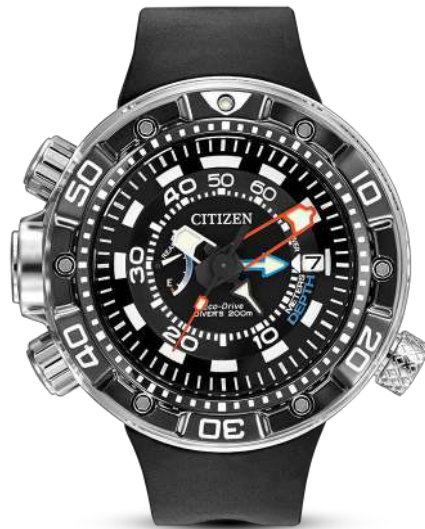
BN2029-01E $1,050.00 53 mm SSC CM PU BKL - 200M