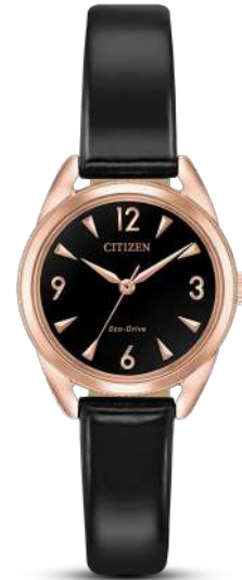
EM0688-01E $275.00 27 mm SSP MC LTHR BKL - WR