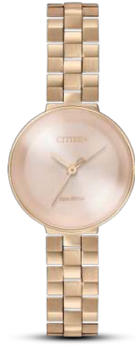
EW5503-83X $575.00 25 mm SSP CS SSP DCP PC WR50