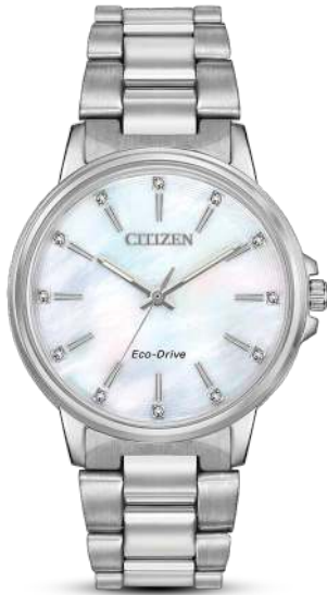
FE7030-57D $375.00 37 mm SS MC SS FCP SP WR50