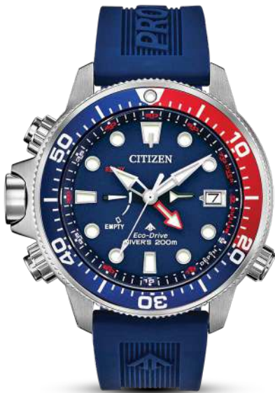
BN2038-01L $895.00 46 mm SS MC PU BKL - 200M