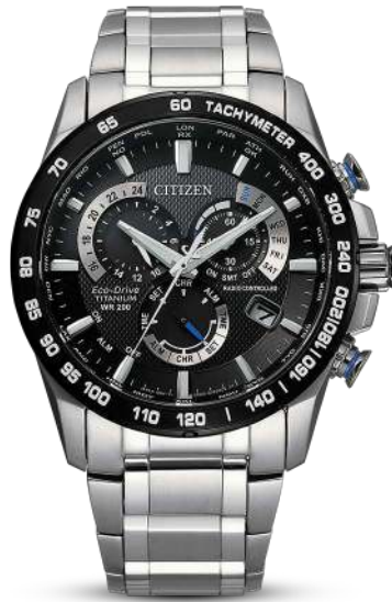
CB5908-57E $995.00 42 mm TIPC CS TIC HDP SP WR200