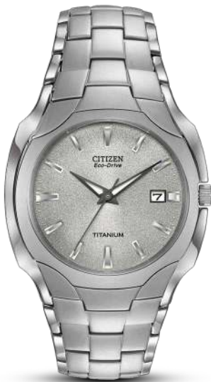
BM7440-51A $425.00 38 mm TIC MC TIC FCP PC WR