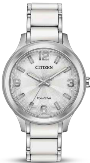
FE7070-52A $375.00 37 mm SS MC SSPU FCP SP WR100