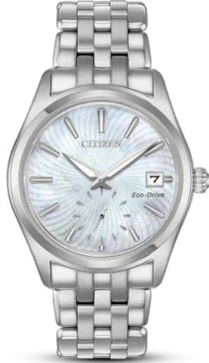
EV1030-57D $425.00 36 mm SS MC SS FCP SP WR100