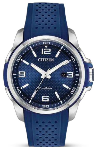
AW1158-05L $275.00 45 mm SS MC PU BKL - WR100