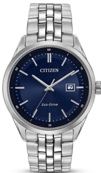
BM7251-53L $375.00 41 mm SS SC SS FCP SP WR100