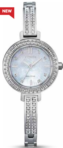
EM0860-51D $450.00 25 mm SS MC SS JLP SP WR50