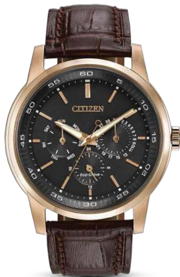
BU2013-08E $365.00 44 mm SSP MC LTHR BKL - WR100