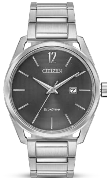
BM7410-51H $295.00 42 mm SS MC SS FCP SP WR100