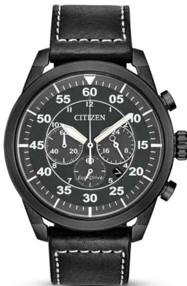
CA4215-21H $395.00 45 mm SSP MC LTHR BKL - WR100