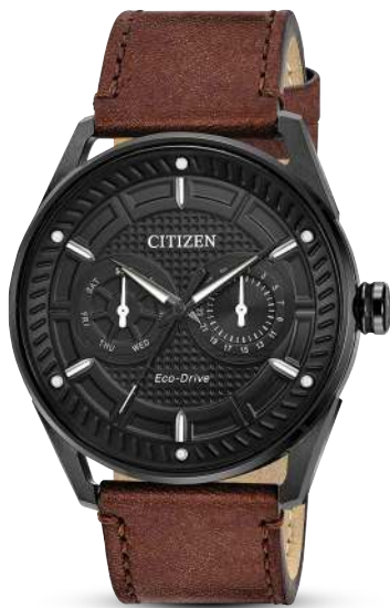
BU4025-08E $350.00 42 mm SSP MC LTHR BKL - WR100