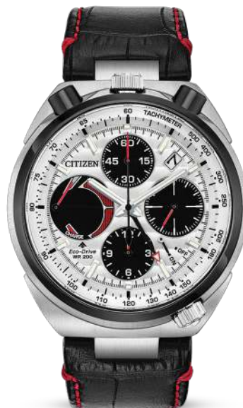
AV0071-03A $1,095.00 45 mm SSP CS LTHR DCP - WR200