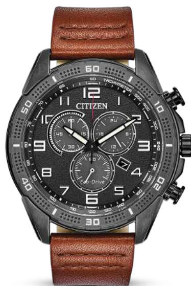
AT2447-01E $425.00 45 mm SSP MC LTHR BKL - WR100