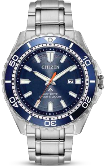
BN0191-55L $495.00 45 mm SS MC SS SCP PC 200M