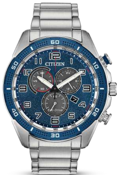
AT2440-51L $425.00 45 mm SS MC SS FCP SP WR100