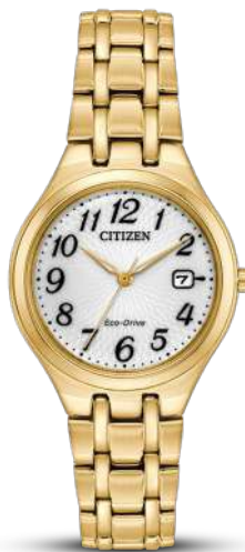
EW2482-53A $325.00 28 mm SSP MC SSP FCP SP WR