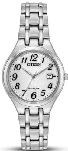
EW2480-59A $295.00 28 mm SS MC SS FCP SP WR