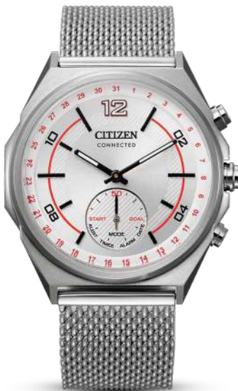
CX0000-71A $395.00 42 mm SS MC SS SLC - WR