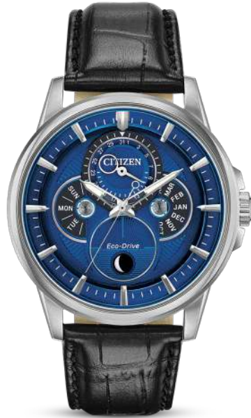
BU0050-02L $495.00 44 mm SS MC LTHR DCP - WR100