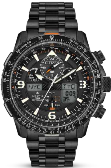
JY8075-51E $950.00 46 mm SSP CS SSP HDP PC WR200