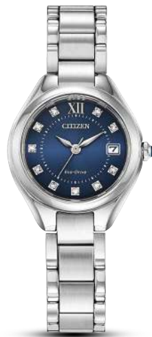
EW2540-83L $375.00 26 mm SS MC SS FCP SP WR50