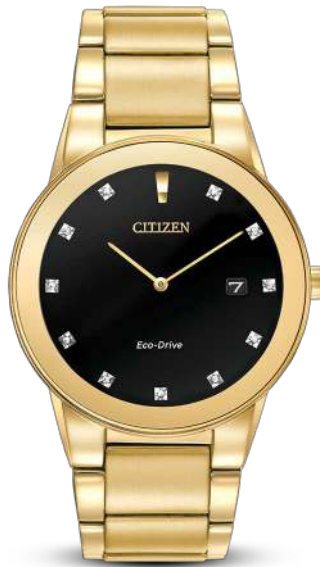
AU1062-56G $425.00 40 mm SSP MC SSP FCP SP WR