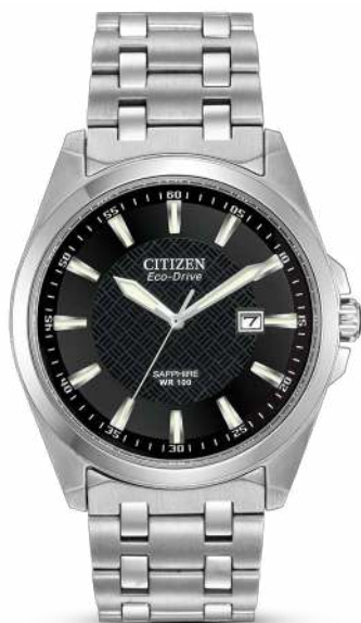
BM7100-59E $375.00 41 mm SS SC SS FCP SP WR100