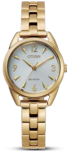
EM0682-74A $325.00 27 mm SSP MC SSP FCP SP WR