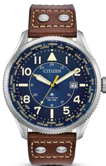
BX1010-11L $475.00 44 mm SS MC LTHR BKL - WR200