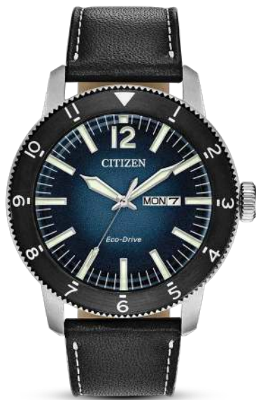
AW0078-08L $375.00 44 mm SSP MC LTHR BKL - WR100