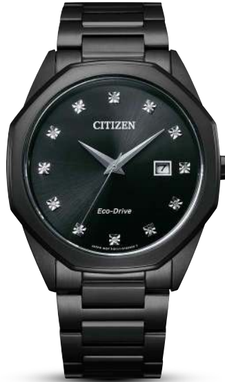
BM7495-59G $595.00 41 mm SSP SC SSP FCP SP WR100