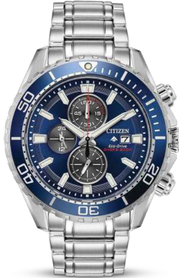
CA0710-82L $595.00 45 mm SS MC SS SCP PC 200M