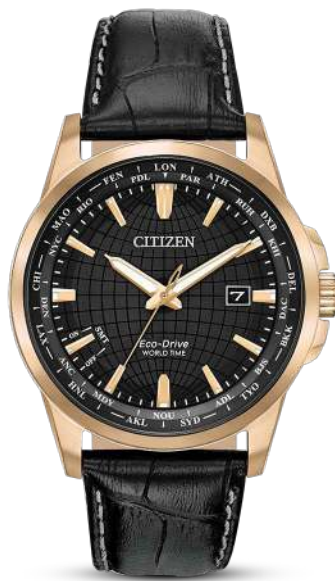
BX1003-08E $495.00 41 mm SSP SC LTHR BKL SP WR50