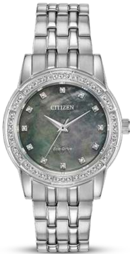
EM0770-52Y $475.00 31 mm SS MC SS FCP SP WR50