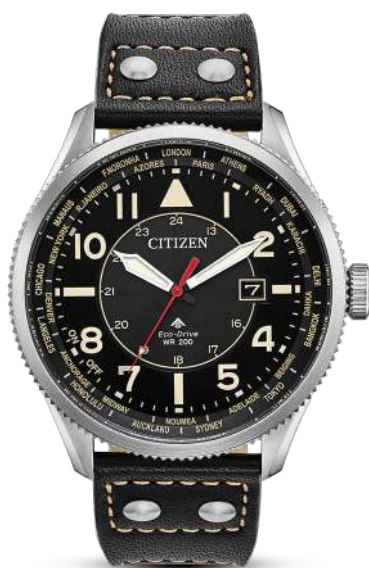
BX1010-02E $475.00 44 mm SS MC LTHR BKL - WR200