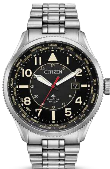
BX1010-53E $525.00 44 mm SS MC SS HDP SP WR200