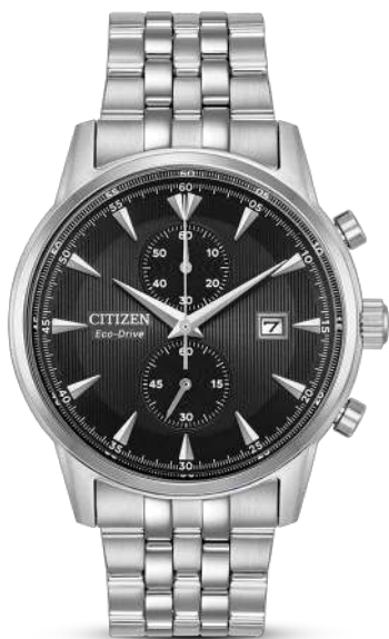
CA7000-55E $475.00 43 mm SS MC SS FCP SP WR100