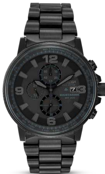
CA0295-58E $550.00 42 mm SSP MC SSP SCP SP WR200