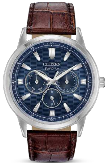
BU2070-12L $425.00 44 mm SS SC LTHR BKL - WR100