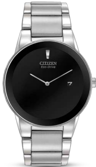
AU1060-51E $295.00 40 mm SS MC SS FCP SP WR