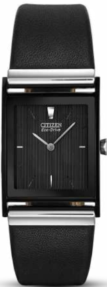
BL6005-01E $235.00 29x26 mm SSP MC LTHR BKL - WR