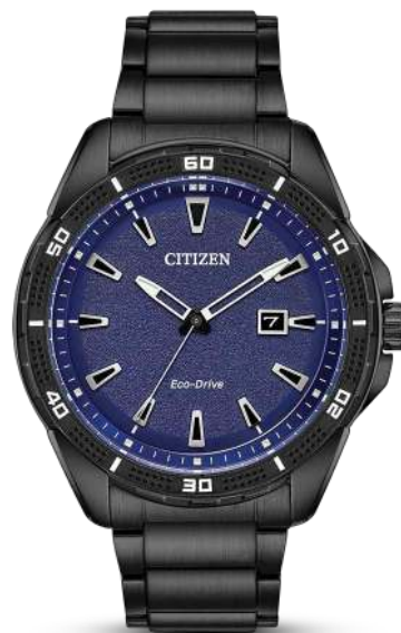
AW1585-55L $350.00 45 mm SSP MC SSP FCP SP WR100