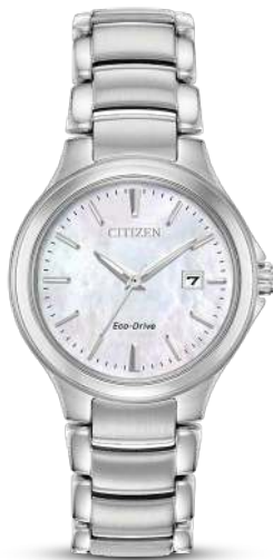
EW2520-56Y $325.00 30 mm SS MC SS FCP SP WR50