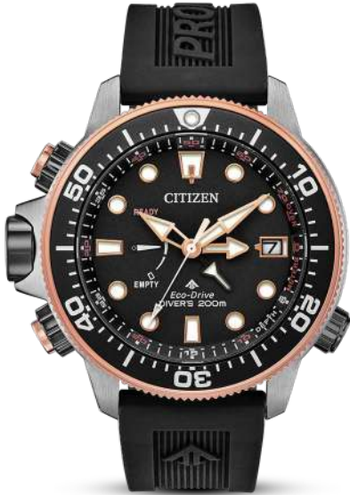
BN2037-03E $995.00 46 mm SSC MC PU BKL - 200M

30TH ANNIVERSARY PROMASTER LIMITED EDITION