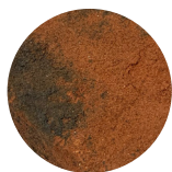
Landsort Röd mix