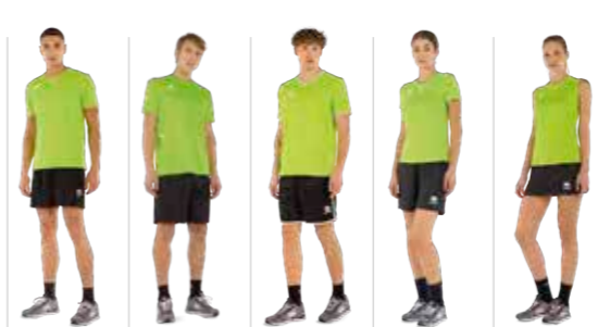
EVERTON shirt MARVIN shirt LENNOX shirt MARION shirt ALISON singlet