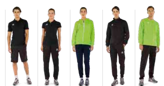
EVO polo EVO LADIES polo JACOB top KURT top MADISON top