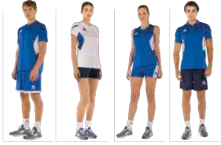
CURTIS shirt CORINNE shirt CARRY singlet CLARK polo