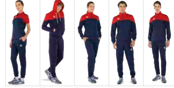
BONNIE polo BEN top BEA top BUDDY top BLAKE top