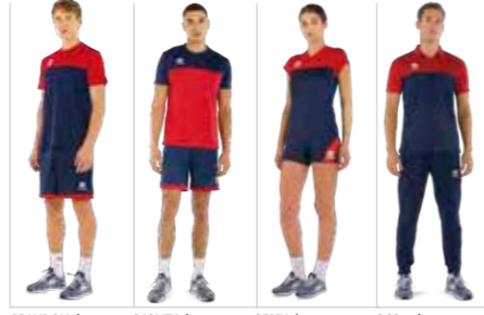
BRANDON shirt BARNEY short BESSY shirt BOB polo