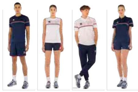
DIAMANTIS shirt DIVINA singlet DOMINIC polo DARYA polo