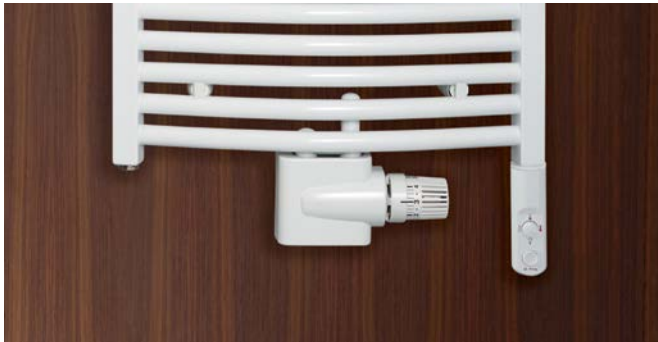
Ausführung Mixbetrieb mit Heizstab (Zubehör) und Anschluss-Armatur Zehnder Vario