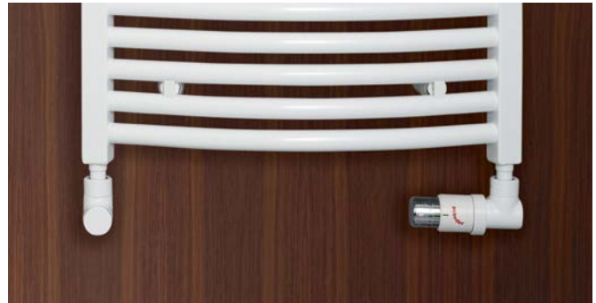
Ausführung Warmwasserbetrieb mit Anschlüssen rechts, links.