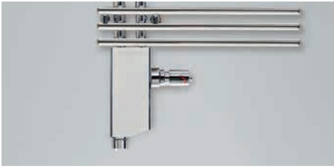
Anschluss-Armatur mit Blende in Chrom für Ausführung Mixbetrieb.