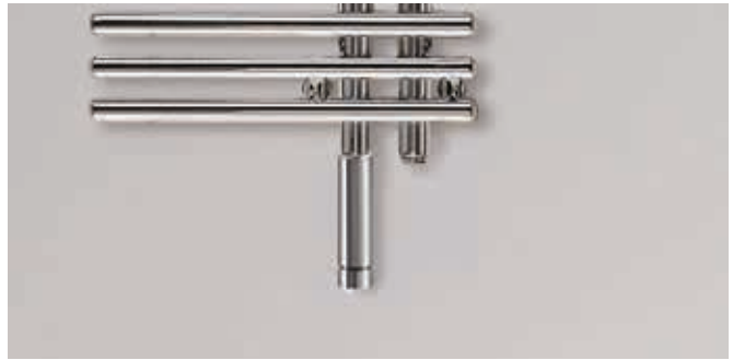
Ausführung Elektrobetrieb mit eingebautem Heizstab WIVAR II

V20190128, RAD_DAS, DE_de, Änderungen vorbehalten