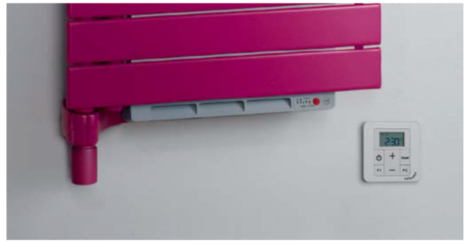
Elektrischer Heizlüfter mit Timerfunktion und Infrarot-Steuergerät