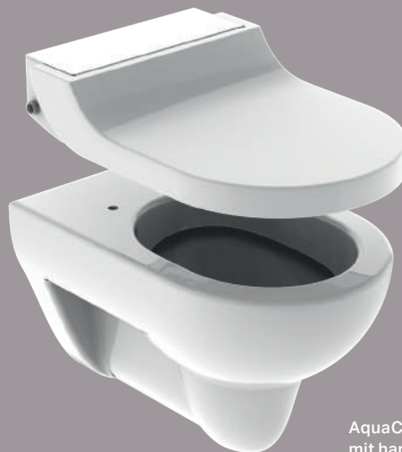
AquaClean Tuma WC-Aufsatz mit handelsüblicher Keramik

Vor allem in Mietwohnungen bietet die unkomplizierte Installation ohne größere Umbauten Vorteile. So können auch Mieter ihr Bad aufwerten und das Gefühl der Frische von Geberit AquaClean genießen.