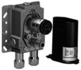
35 020 970 90 UP-Einhandbatterie -