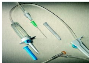
EQUIPO PARA ADMINISTRACION IV

OBSERVACIONES: Producto para uso único, deséchelo después de usarlo, reemplazar el equipo cada 24 horas como máximo, no utilice este producto si el empaque esta roto o dañado.