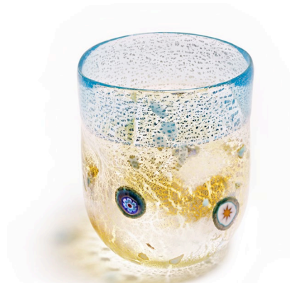
BA14: Murano Trinkglas Bagonghi Blau | 330ml | Ø 8cm | h 10cm