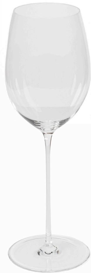
GE10: Gentile Weissweinglas 300ml | Ø 7,8cm | h 23cm