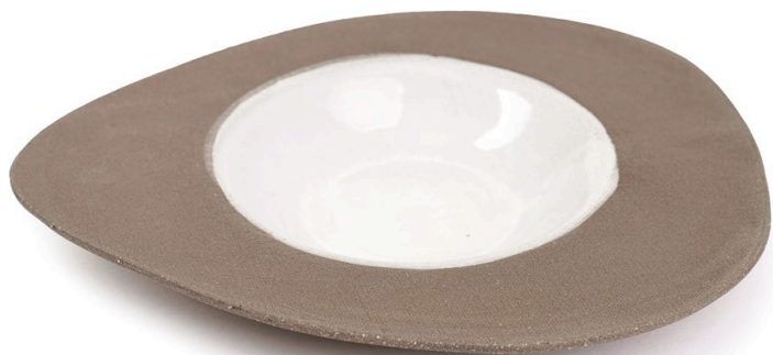
ET13: Mond Tiefer Teller l 26cm | b 23cm | h 3cm Steinzeug handgeformt