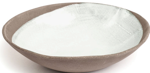
ET15: Mond Schale groß l 23cm | b 22cm | h 6cm Steinzeug handgeformt