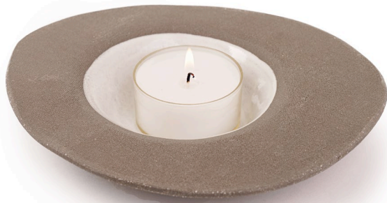
ET17: Mond Teller klein mit Teelicht l 20cm | b 17cm | h 3cm Steinzeug handgeformt Maxi-Teelicht: Ø 5,5cm | h 2,5cm