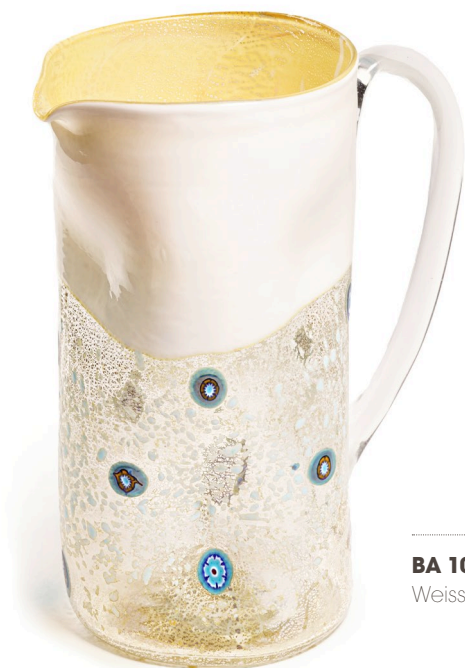
BA 10: Murano Karaffe Bagonghi Weiss | 1800ml | Ø13cm | h 22cm

Das Murano Trinkglas „Bagonghi“ ist in 6 Farben erhältlich, so findet sich für jeden Anlass und für jedes Ambiente der perfekte Begleiter für Ihren gedeckten Tisch!