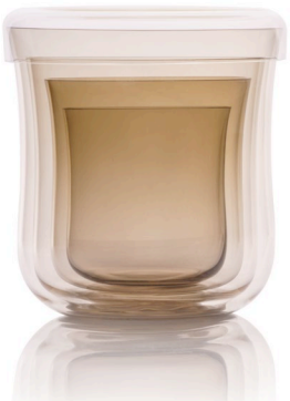
GE16: Gentile Trinkglas 4-er Set mit Deckel Fume | hauchzartes Musselinglas