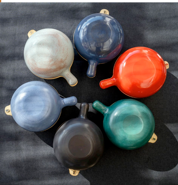
PK01: Bräter aus Steinzeug handgeformt Ø 38 x 25cm | h 18cm

Ob Sie saftige Braten, zartes Gemüse oder knusprige Aufläufe zubereiten möchten, dieser keramische Bratentopf ist der perfekte Begleiter für Ihre kulinarischen Abenteuer im Ofen. Der Ton nimmt die Wärme des Ofens gleichmäßig auf und leitet sie im Backrohr, sowie am und im offenen Feuer schonend an das Backgut weiter. Das Besondere an diesem Topf ist, dass sowohl das Ober- als auch das Unterteil das gleiche Fassungsvermögen haben. Das ermöglicht es Ihnen, den Topf einfach zu wenden und den Inhalt gleichmäßig zu garen. Der Bratentopf ist in vielen lebendigen Farben erhältlich und kann nach Wunsch personalisiert werden.