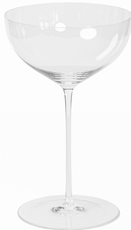
GE12: Gentile Champagnerglas 230ml | Ø13cm | h 22cm