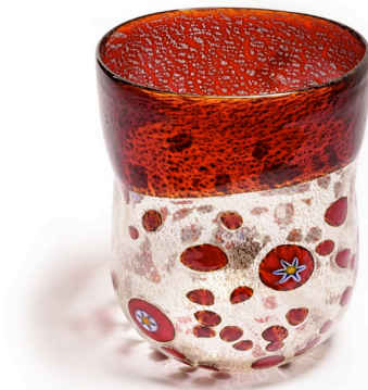
BA17: Murano Trinkglas Bagonghi Rot | 330ml | Ø 8cm | h 10cm