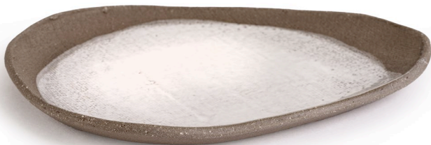
ET12: Mond Gedeckeller/ Untertasse l 15,5 cm | b 12cm | h 1,5 cm Steinzeug handgeformt