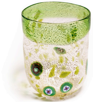
BA16: Murano Trinkglas Bagonghi Grün | 330ml | Ø 8cm | h 10cm