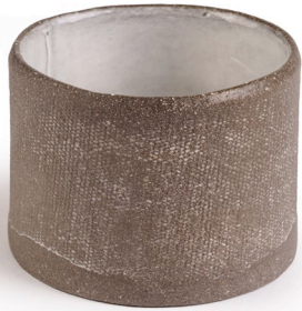
ET10: Mond Espressotasse Ø 6,5cm | h 4,5cm Steinzeug handgeformt