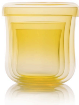
GE16: Gentile Trinkglas 4-er Set mit Deckel Gelb | hauchzartes Musselinglas