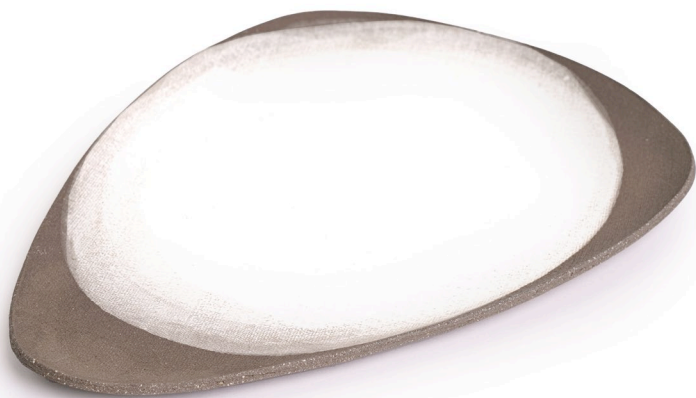
ET14: Mond Flacher Teller l 29,5 cm | b 23cm | h 1,5 cm Steinzeug handgeformt