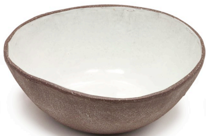
ET16 Mond Schale klein l 14cm | b 14cm | h 5cm Steinzeug handgeformt