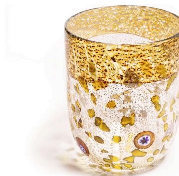
BA13: Murano Trinkglas Bagonghi Gold | 330ml | Ø 8cm | h 10cm