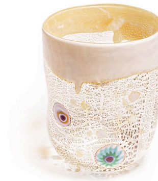
BA12: Murano Trinkglas Bagonghi Weiss | 330ml | Ø 8cm | h 10cm