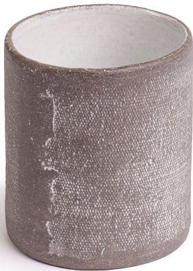
ET11: Mond Kaffeetasse Ø 6,5cm | h 7cm Steinzeug handgeformt