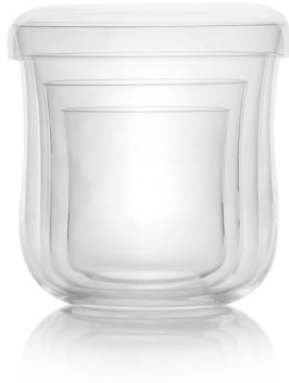
GE15: Gentile Trinkglas 4-er Set mit Deckel Transparent | hauchzartes Musselinglas