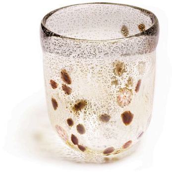
BA15: Murano Trinkglas Bagonghi Silber | 330ml | Ø 8cm | h 10cm