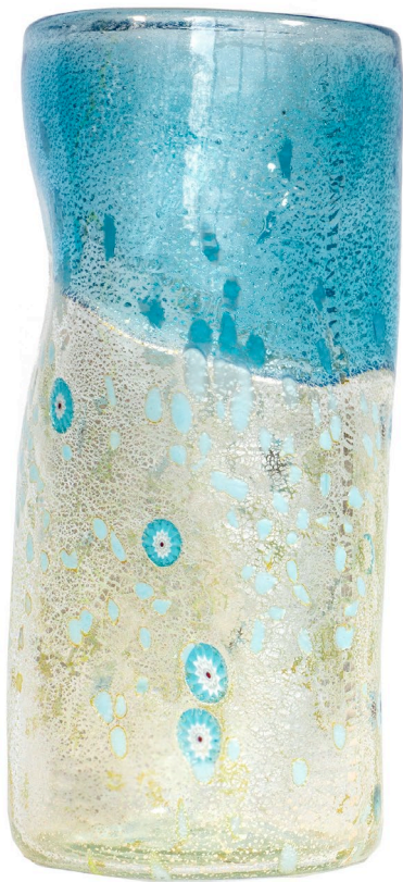
BA 11: Murano Vase Bagonghi Blau | 1700ml | Ø11cm | h 25cm

Die angegebenen Maße und auch die Fotos sind lediglich Richtwerte: es können sich kleine Änderungen durch die Handarbeit und das Naturmaterial ergeben. Jedes Stück ist ein Unikat!