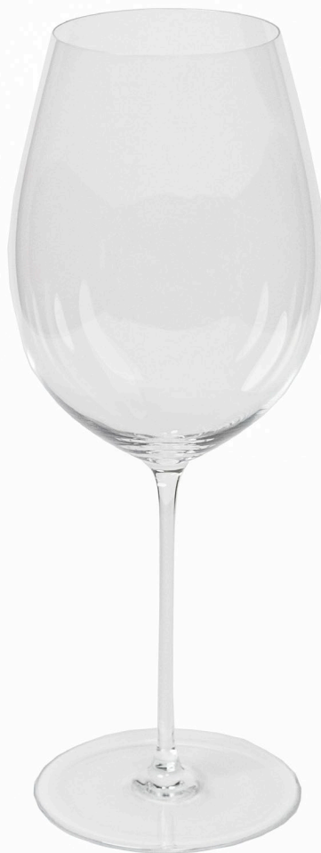
GE11: Gentile Rotweinglas 450ml | Ø 8,7cm | h 25cm