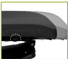
Schuifzitting / ziddiepte- verstelling