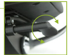
Bediening van het bewegings- mechanisme