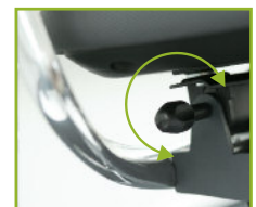
Zitneig- verstelling (zithoek)