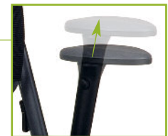
Armleuningen hoogte- verstelling