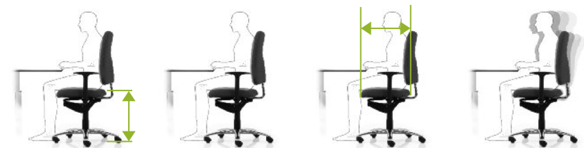
1 zithoogte verstellen

De beste zithouding bereikt u als u rechtop zit en de hoek tussen zowel boven- en onderbeen als boven- en onderarm ongeveer 90 graden bedraagt. Als u gebruik maakt van het bewegingsmechanisme (dynamisch zitten) neemt de rugbelasting verder af en blijft u fit!