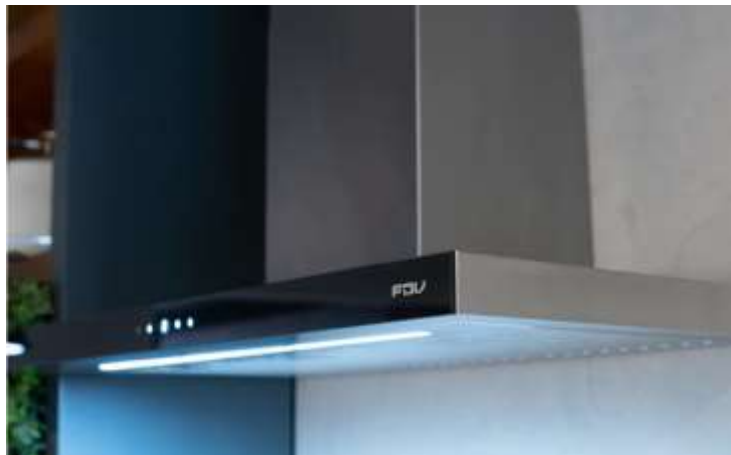
Campana Decorativa FDV