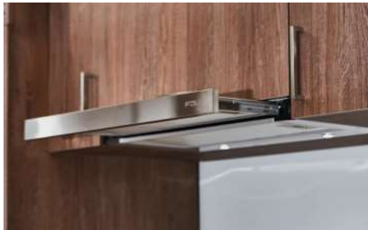
Campana Bajo Mueble FDV