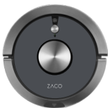
Metallic Grey 501905-Anthracite