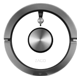
Snow White 501905-White