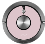
Cherry Blossom 501905-Rose