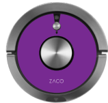
Wild Berry 501905-Berry