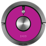
Hot Pink 501905-Hot-Pink