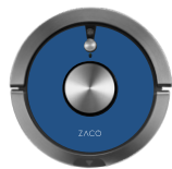
Royal Blue 501905-Dark-Blue