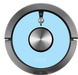
Sky Blue 501905-Sky-Blue