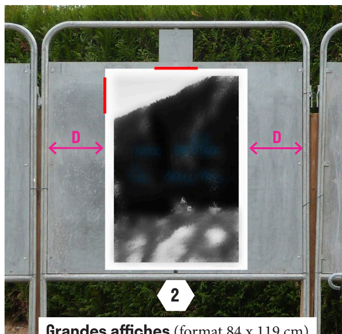
Grandes affiches (format 84 x 119 cm) 1 affiche par panneau