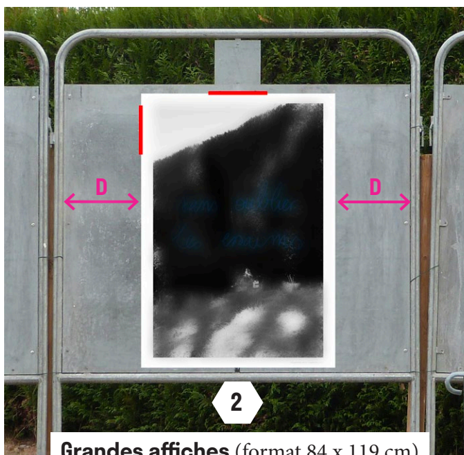
Grandes affiches (format 84 x 119 cm)