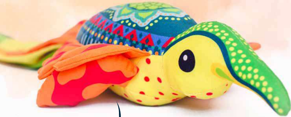
LORA THE PURTLE