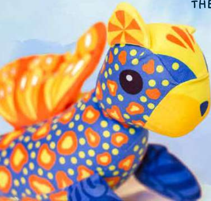
LINA THE SEALFLY