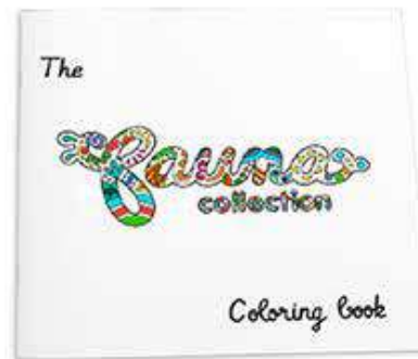
Libro de colorear