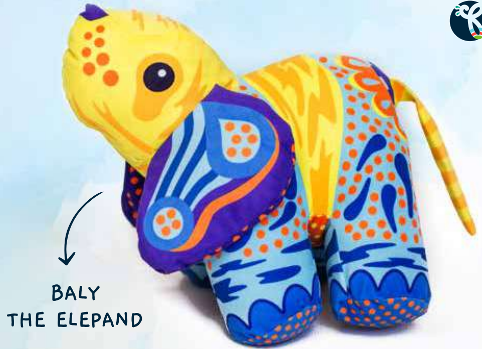
BALY THE ELEPAND