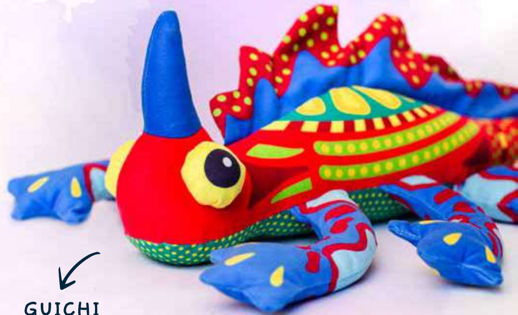
GUICHI THE RHINARD