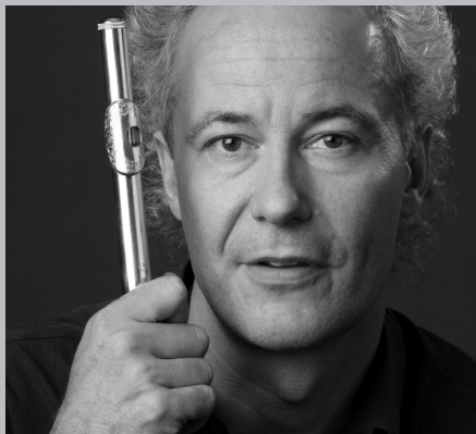
Felix Renggli

Ce CD témoigne d'un compagnonnage de vingt années. Depuis 1999, date de la création des Swiss Chamber Concerts, j'ai commandé à Xavier Dayer huit nouvelles œuvres allant du solo à la camerata. Cinq, aux titres évocateurs, sont ici gravées: Solus cum solo / Come heavy sleep / De Umbris (II) / Nocturne / Mémoire, cercles . Leur écoute nous plonge d'emblée dans un monde sonore qui tisse peu à peu, entre ombre et lumière, la fresque fascinante d'une cathédrale, comme suspendue et immuable dans un espace constamment renouvelé.