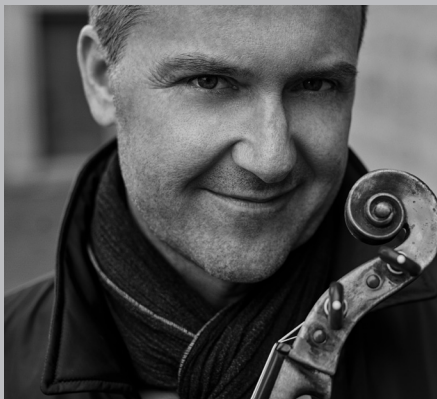
Jörg Dähler © Rainer Suck