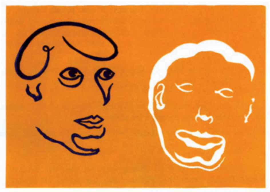
Bugles Calling, calligramme en couleur (Original A3) par/by Laurent Lourson