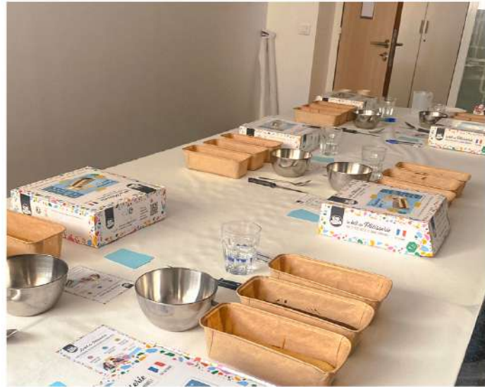
UNE ACTIVITÉ CLÉ EN MAIN

LUDIQUE ET GOURMANDE POUR SOUDER VOS ÉQUIPES