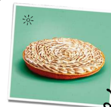
Tarte Citron-Mandarine Meringuée