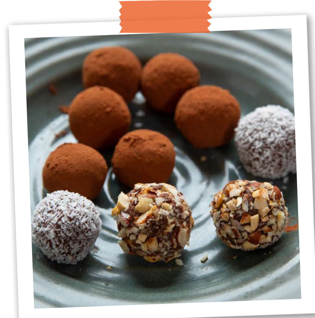
Kit truffes choco