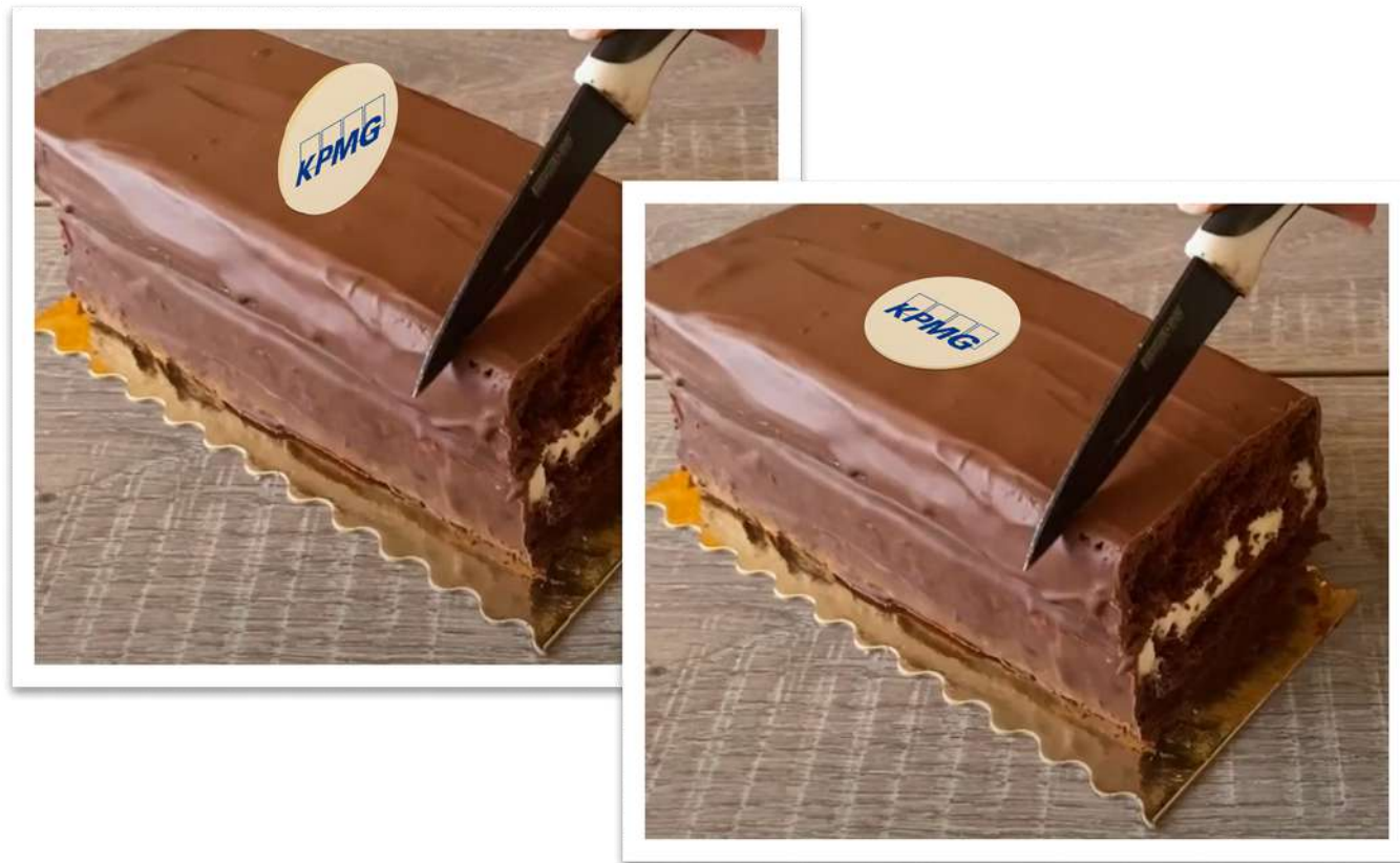
Stickers avec votre logo (apparence personnalisable)