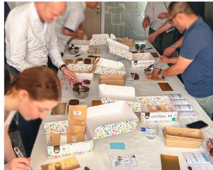
UNE JOURNÉE DÉLICIEUSEMENT CRÉATIVE !