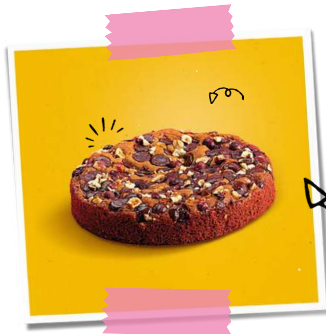
Cookie Choco- Noisette