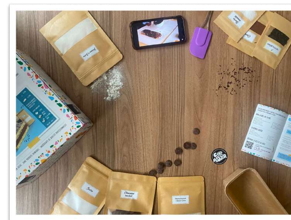
Contenu d'un kit de pâtisserie (Ingrédients, ustensiles, fiche recette)

EMBALLAGES RECYCL. ET BIODÉGR. USTENSILES RÉUTILISABLES