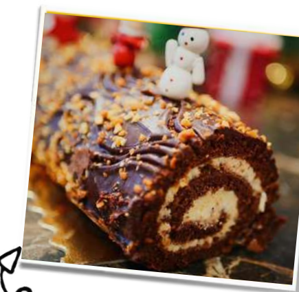
Bûche de Noël