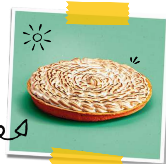
Tarte Citron Mandarine Meringuée

Recettes allégées en sucre, sans additif, sans alcool et à partager avec 6 à 8 personnes