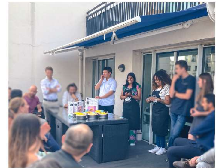
DES SOUVENIRS ET DES LIENS RENFORCÉS !

Tout est pris en charge : installation complète, matériel inclus. Vous n'avez qu'à profiter !