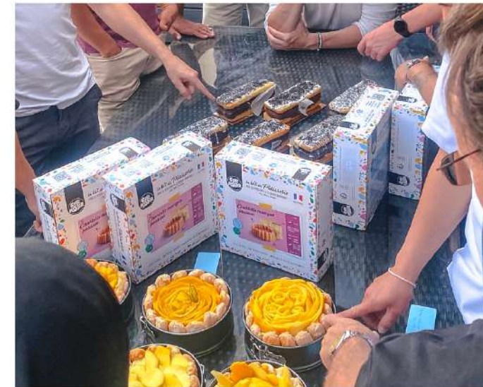
LA COMPÉTITION AMICALE ET SUCRÉE !