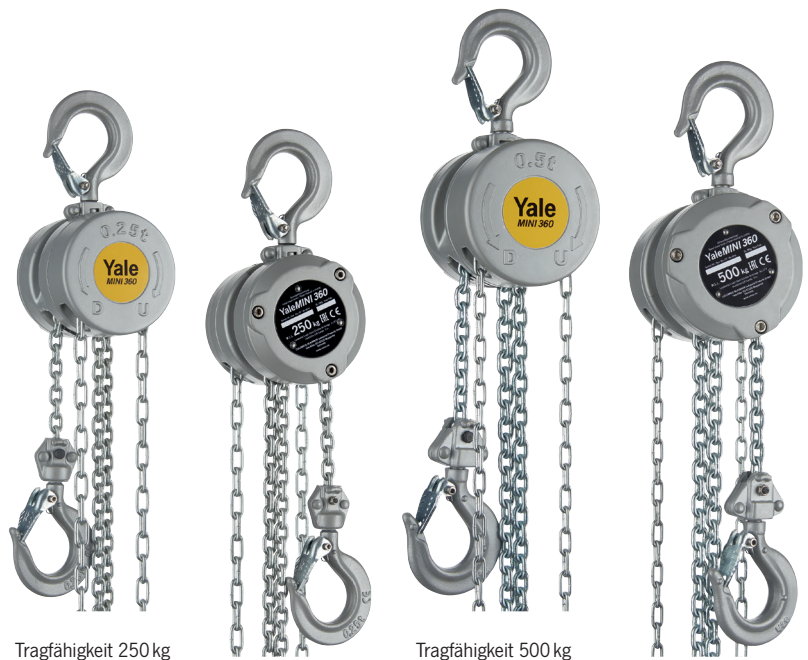
Tragfähigkeit 250 kg