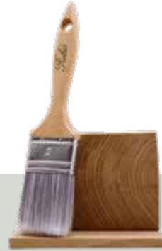
Pędzel WoodCream 2"