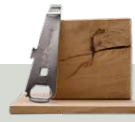
Otwieracz do puszek

Dostępne w wersji drewnianej i metalowej (wielokrotnego użytku)