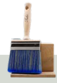
Szczotka blokowa 3x10

Idealny do nakładania WoodCream i WoodCream Softener • Zapewnia równomierną aplikację • Bardzo trwałe: wysoka jakość i stal nierdzewna (inox) • Idealny do nakładania produktów na bazie wody • Po użyciu WoodCream można po prostu spłukać pędzel wodą