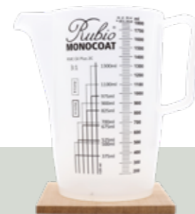
Miarka 1800 ml

Miarka do mieszania produktów (niektóre z naszych produktów wymagają połączenia z utwardzaczem lub Softenerem).