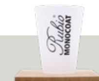
Miarka 400 ml

Miarka do mieszania produktów (niektóre z naszych produktów wymagają połączenia z utwardzaczem lub Softenerem).