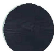
BOLD BLACK #7