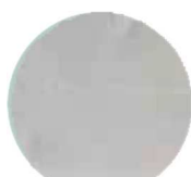
TIMELESS GREY #2