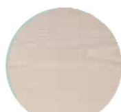
DIRTY GREY #1