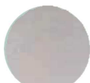
MISTY GREY #3