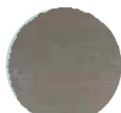
GREEN GREY #6