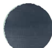
BLUE GREY #5