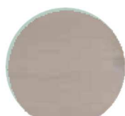
CHARMING GREY #8