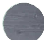
GRAVEL GREY #4