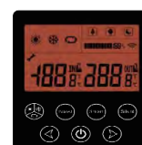
Panel de control integrado