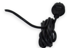
Kabelverlängerung auf 10 Meter 20 230V 35,29 €

Für weitere Informationen schauen Sie bitte im Netz unter www.royal-exclusiv.de . Einfach Artikelnummer oder Name in die Suchmaske eintragen oder email an: info@royal-exclusiv.de .