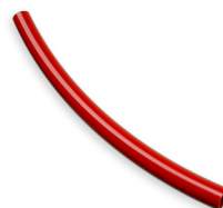
Anti-Kalk-Bypass Schlauchstück Ø 8mm 295 4,00 €