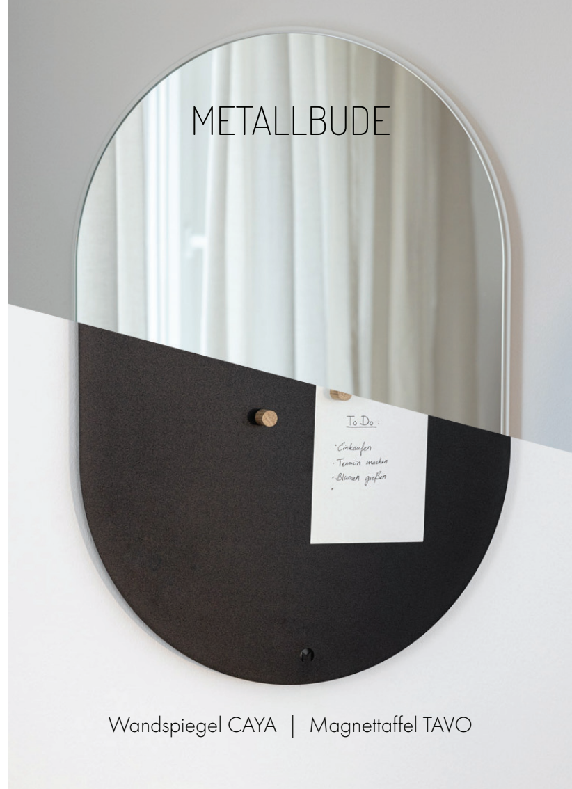
Wandspiegel CAYA | Magnettaffel TAVO