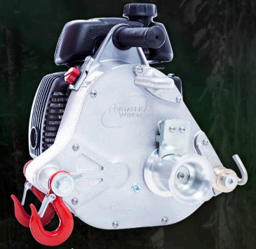
PROPULSÉ par HONDA PCW5000