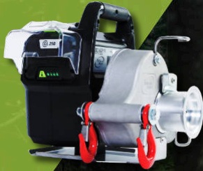
80/82 VOLT 82V max PCW3000-Li