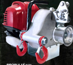
PROPULSÉ par HONDA PCW4000