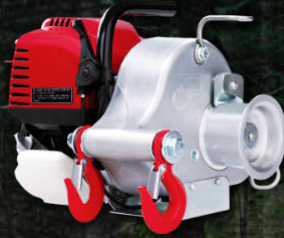
PROPULSÉ par HONDA PCW3000

VITESSE PAR MIN. S1: 26.6' / 8.1 M S2: 32.8' / 10 M S3: 38' / 11.6 M