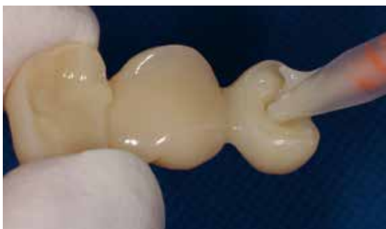
Application de Telio CS C&B

Pour le rebasage, appliquer Telio CS C&B mélangé dans l'intrados des couronnes. Gardez l'embout de mélange immergé dans le matériau afin d'éviter la formation de bulles. Si nécessaire, le matériau peut également être appliqué à l'aide d'une seringue autour des dents préparées afin d'éviter la formation de bulles le long de la préparation cervicale.