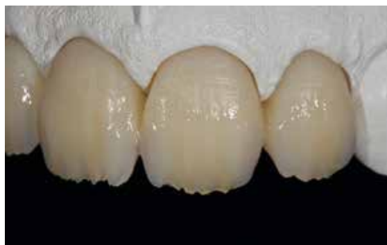
Application des maquillants SR Nexco...

Sabler la zone à compléter ( Al_2O_3 , 80 \mu m , 1–2 bar). Puis nettoyer au jet de vapeur et sécher à l'air comprimé exempt d'huile. Appliquer ensuite SR Connect, laisser agir pendant 2 à 3 min puis polymériser pendant 40 s (avec Bluephase® Style par exemple).