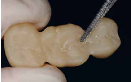
Utiliser des fraises carbure de tungstène à denture croisée et des disques...

Une fois l'usinage/grattage terminé, utiliser des fraises en carbure de tungstène pour séparer les éléments du disque.