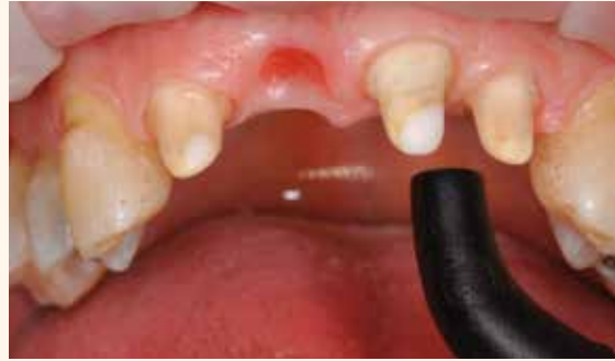
Ensuite, sécher avec une seringue à air et de l'air exempt d'huile. (Ne pas trop sécher la dentine).