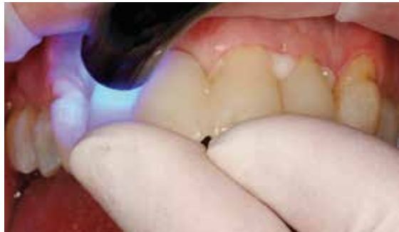
Polymérisation accélérée de la colle à l'aide d'une lampe à photopolymériser