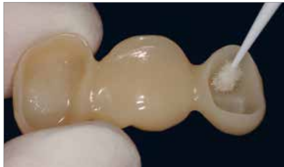
Brosser Telio Activator et laissez agir.

Nettoyer au jet de vapeur et sécher à l'air comprimé exempt d'huile. Mouiller ensuite, de manière extraorale, la zone dépolie, avec Telio Activator. Brosser Telio Activator pendant au moins 30 secondes sur toute la surface à l'aide d'une brosse à dents afin d'obtenir une distribution uniforme et une pénétration plus rapide. Ensuite, laisser agir l'activateur pendant 30 à 60 secondes supplémentaires (temps de réaction total de 1 à 2 minutes).