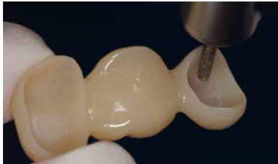
Dépolir les intrados

Préparer les surfaces intérieures par grattage et/ou sablage ( \text{Al}_2\text{O}_3 , grain 80-100 \mu\text{m} , 1-2 bar).