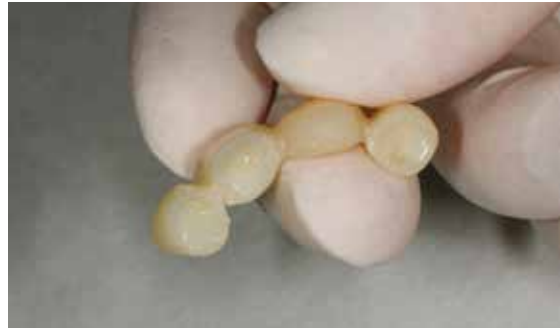
Application directe de Telio CS Link sur la restauration provisoire