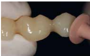
... avec fraises et polissoirs