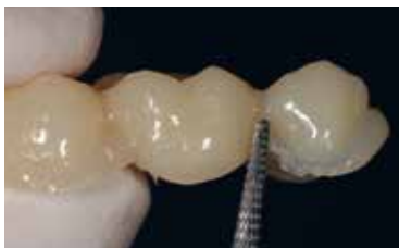
Élimination extraorale des excès...

Le temps de polymérisation est d'environ 3 min à température ambiante (23 ° C). Après cela, Telio CS C&B partiellement polymérisé présente une consistance à la fois dure et élastique et peut être retiré de la cavité orale avec la restauration Telio CAD. Après polymérisation complète (4–5 min), la finition est effectuée de manière extraorale. Les fraises en carbure de tungstène à denture croisée sont adaptées pour la finition ; pour le polissage, utiliser des polissoirs caoutchouc au carbure de silicone (par exemple OptraPol, Astropol).