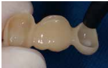
... et souffler à l'air.