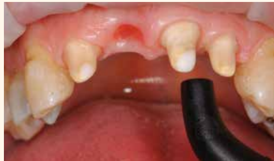
Répartir soigneusement les excès en un couche mince / sécher à la seringue à air. (Ne pas trop sécher la dentine).