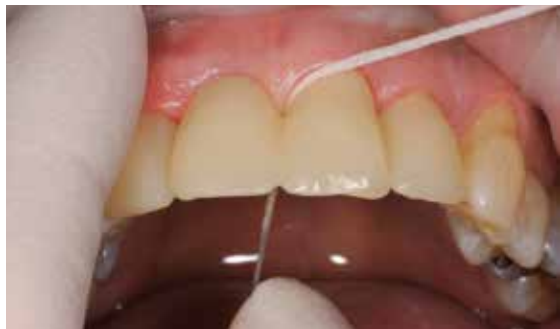
Élimination des excès avec un détartreur et du fil dentaire