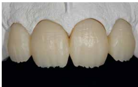
Restaurations Telio CAD partiellement réduites ajustées sur le modèle. La réduction peut être réalisée à l'aide d'un système CAD/CAM approprié ou par réduction manuelle.

Sabler la zone à compléter ( Al_2O_3 , 80 \mu m , 1–2 bar). Puis nettoyer au jet de vapeur et sécher à l'air comprimé exempt d'huile. Appliquer ensuite SR Connect, laisser agir pendant 2 à 3 min puis polymériser pendant 40 s (avec Bluephase® Style par exemple).