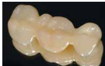
Restaurations Telio® CAD terminées