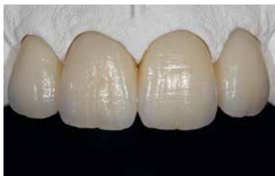
Restaurations personnalisées Telio CAD avant et après polymérisation