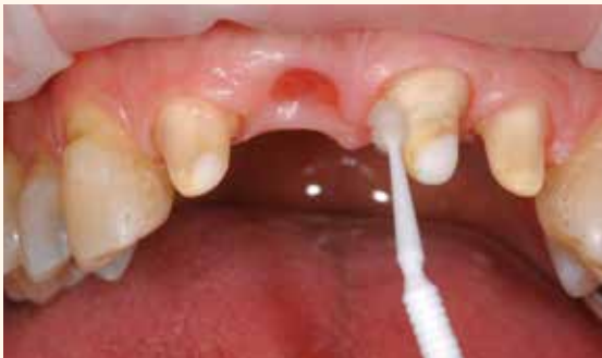
Appliquer Telio CS Desensitizer sur la dentine et broser pendant environ 10 secondes à l'aide d'un instrument approprié (pinceau, embout d'application).