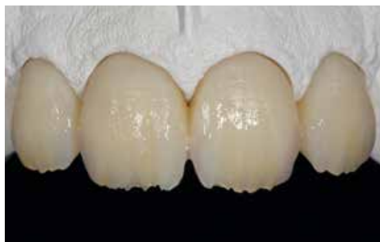
... et des masses SR Nexco