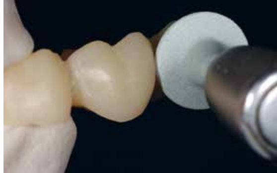
... pour la finition des blocs Telio CAD.

Respecter la procédure suivante pour la finition des restaurations Telio CAD :