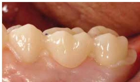
Bridge Telio CAD en place, avec les excès de matériau Telio CS C&B