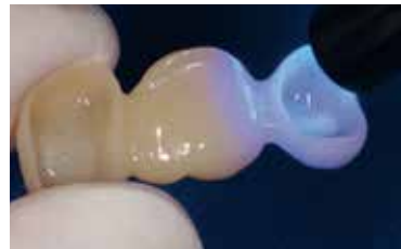
Photopolymériser l'adhésif Heliobond.

Pour le rebasage, appliquer Telio CS C&B mélangé dans l'intrados des couronnes. Gardez l'embout de mélange immergé dans le matériau afin d'éviter la formation de bulles. Si nécessaire, le matériau peut également être appliqué à l'aide d'une seringue autour des dents préparées afin d'éviter la formation de bulles le long de la préparation cervicale.