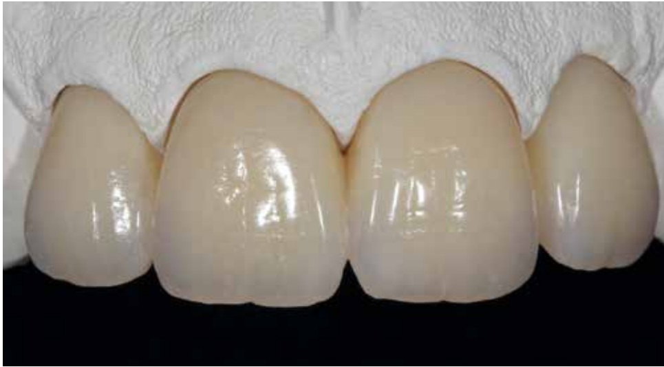
Restauration Telio CAD terminée, caractérisée avec SR Nexco sur le modèle de travail.