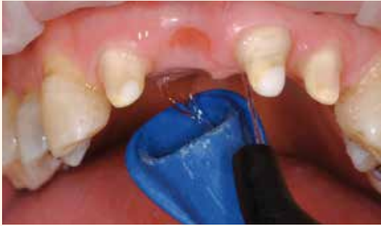
Rincer la préparation à l'eau.

Telio CS Desensitizer rend la phase de temporisation plus confortable pour les patients, car elle réduit la sensibilité des surfaces préparées qui peuvent être, dans certains cas, exposées à la dentine. Pour l'application de Telio CS Desensitizer, les surfaces de la dentine doivent être sèches et propres.