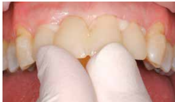
Mise en place sur les dents préparées