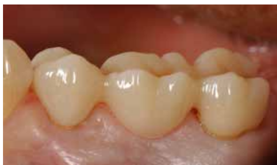
Restaurations Telio CAD terminées et collées