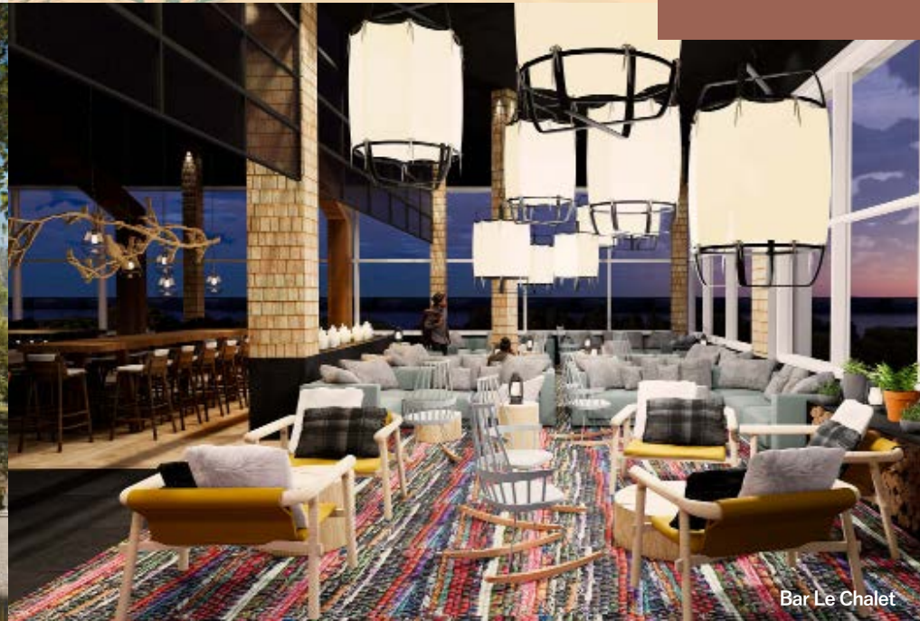
Bar Le Chalet