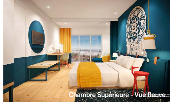
Chambre Supérieure - Vue fleuve

Face à la baie vitrée donnant sur le fleuve Saint-Laurent, le lit et le salon sont une invitation à la contemplation. Les soubassements en bois bordeaux, les couleurs lumineuses et le mobilier contemporain composent un espace chaleureux ouvert sur la nature extérieure. Même le bureau est doté d'une belle vue sur le fleuve. La chambre Deluxe dispose d'un espace de 38 m 2 pour une capacité maximale de 3 personnes et d'un balcon aménagé. Elle est offerte également en version Chambre Deluxe Famille, offrant un espace de 45 m 2 en chambre simple pour une capacité maximale de 5 personnes, ou en version communicante, selon les disponibilités.