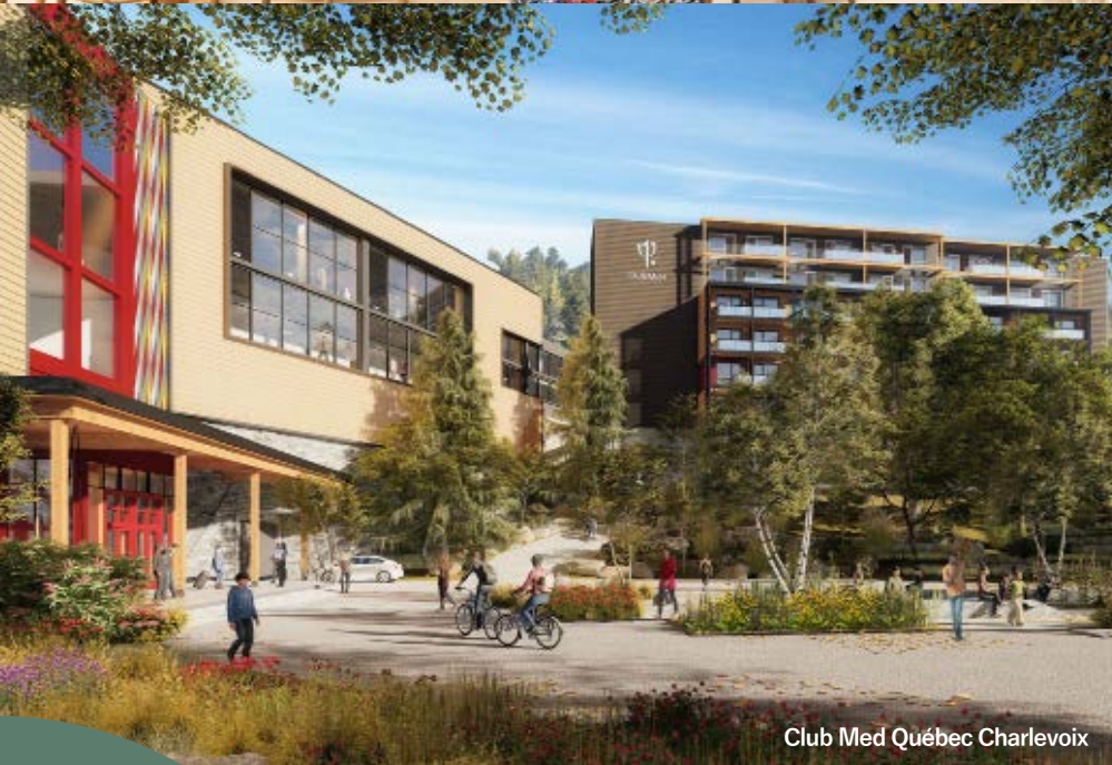
Club Med Québec Charlevoix