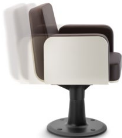
Woody RT 2312/S