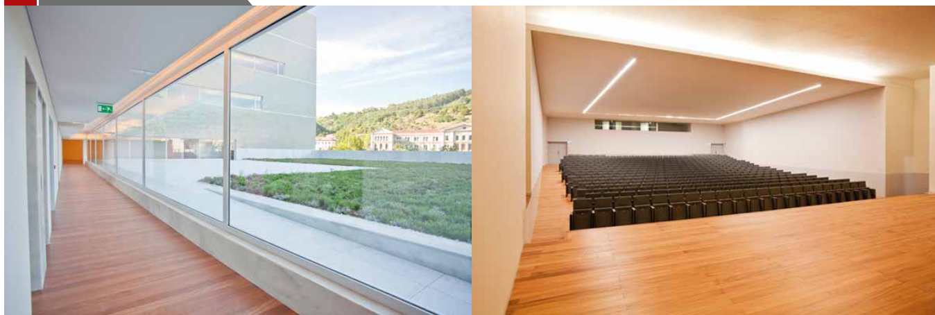
Doussie Tarima de Interior