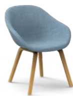
PEQUEÑO / Petita / Petit / Small / Klein