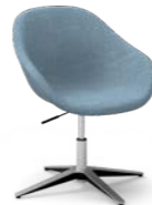
PEQUEÑO / Petita / Petit / Small / Klein