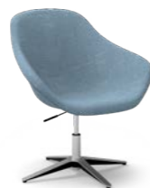
GRANDE / Gran / Grand / Big / Gross