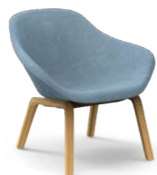
GRANDE / Gran / Grand / Big / Gross