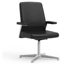
Cromada. Cromada / Chromée / Chrome / Verchromt.