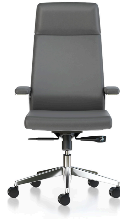
Cabezal y respaldo fijo. Capçal i respallter fix / Tête et dossier fixe / Fixed headrest and backrest / Feste Kopfstütze und Rückenlehne.