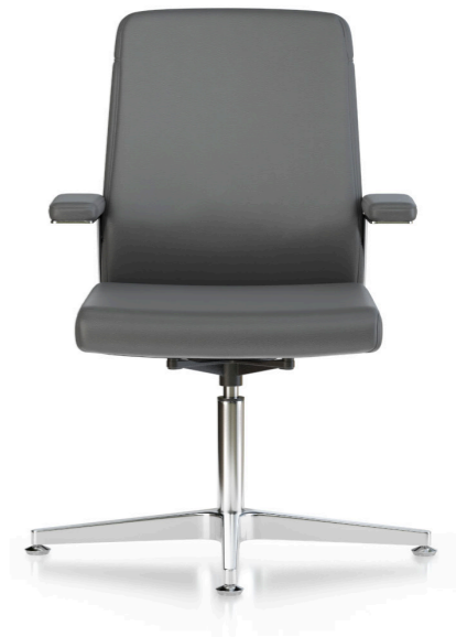
Respaldo fijo. Respallter fix / Dossier fixe / Fixed backrest / Feste Rückenlehne.