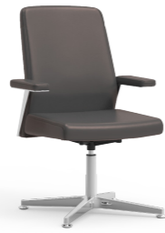
Giratoria. Giratorià / Giratoire / Swivel / Drehstuhl.