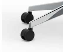
Ruedas de nailon Ø 65 mm Rodes de niló Ø 65 mm / Roulettes sol dur de nylon de Ø 65 mm / Nylon wheels Ø 50 mm / Ø 65 mm Nylon Rollen