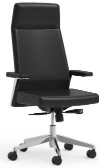
Silla de dirección. Cadira de direcció / Siège de direction / Executive chair / Chfessessel.