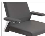
Brazos tapizados. Braços entapissats / Accoudoirs tapissés / Upholstered armrest / Gepolsterte Armauflage