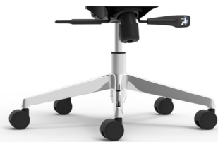
Aluminio pulido Alumini polit / Aluminium poli / Polished aluminium / Aluminium poliert.