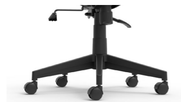
Negra de niló Negra de niló / Noir en nylon / Black nylon / schwarz aus Nylon.