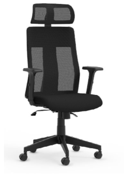
Silla de dirección. Cadira de direcció / Siège de direction / Executive chair / Chefsessel.