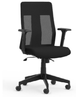
Respaldo medio. Respatller mitjà / Dossier moyen / Medium backrest / Mittlere Rückenlehne.