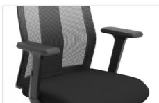
Brazos regulables en altura Braços regulables en altura / Accoudoirs réglables en hauteur / Height adjustable arms / T-förmige Armlehne höhenverstellbar