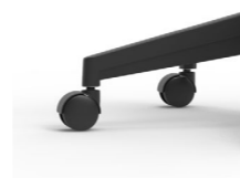
Duras de Ø 50 mm de nylon / Dures de Ø 50 mm de niló / Sol dur noires de Ø 50 mm en nylon / Black nylon Ø 50 mm / Leichtlaufrollen (Nylon) Ø 50 mm.