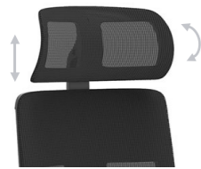
2 movimientos 2 moviments / 2 mouvements / 2 movements / 2 Bewegungen.