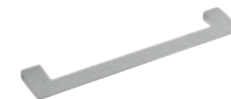
Maniglia in metallo. Metal handle. Tirador de metal. Poignée en métal.