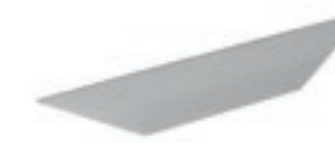
Maniglia in metallo. Metal handle. Tirador de metal. Poignée en métal.