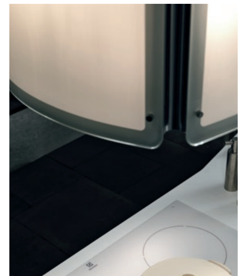
ARTEC ESSENZA / 71