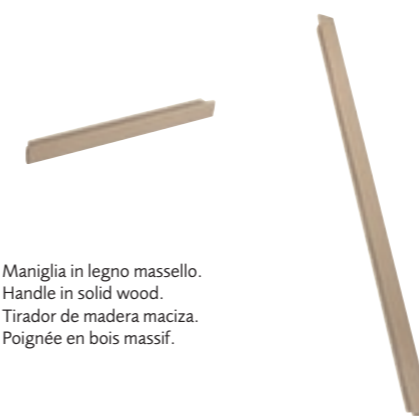
Maniglia in legno massello. Handle in solid wood. Tirador de madera maciza. Poignée en bois massif.