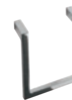
Maniglia in metallo. Metal handle. Tirador de metal. Poignée en métal.