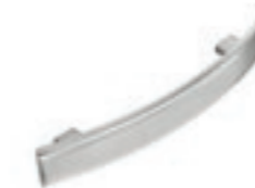
Maniglia in metallo. Metal handle. Tirador de metal. Poignée en métal.