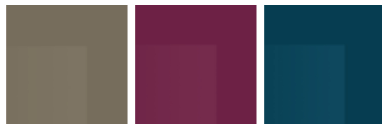
Bronzo Lampone Blu petrolio