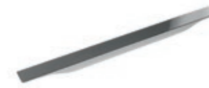
Maniglia in metallo. Metal handle. Tirador de metal. Poignée en métal.