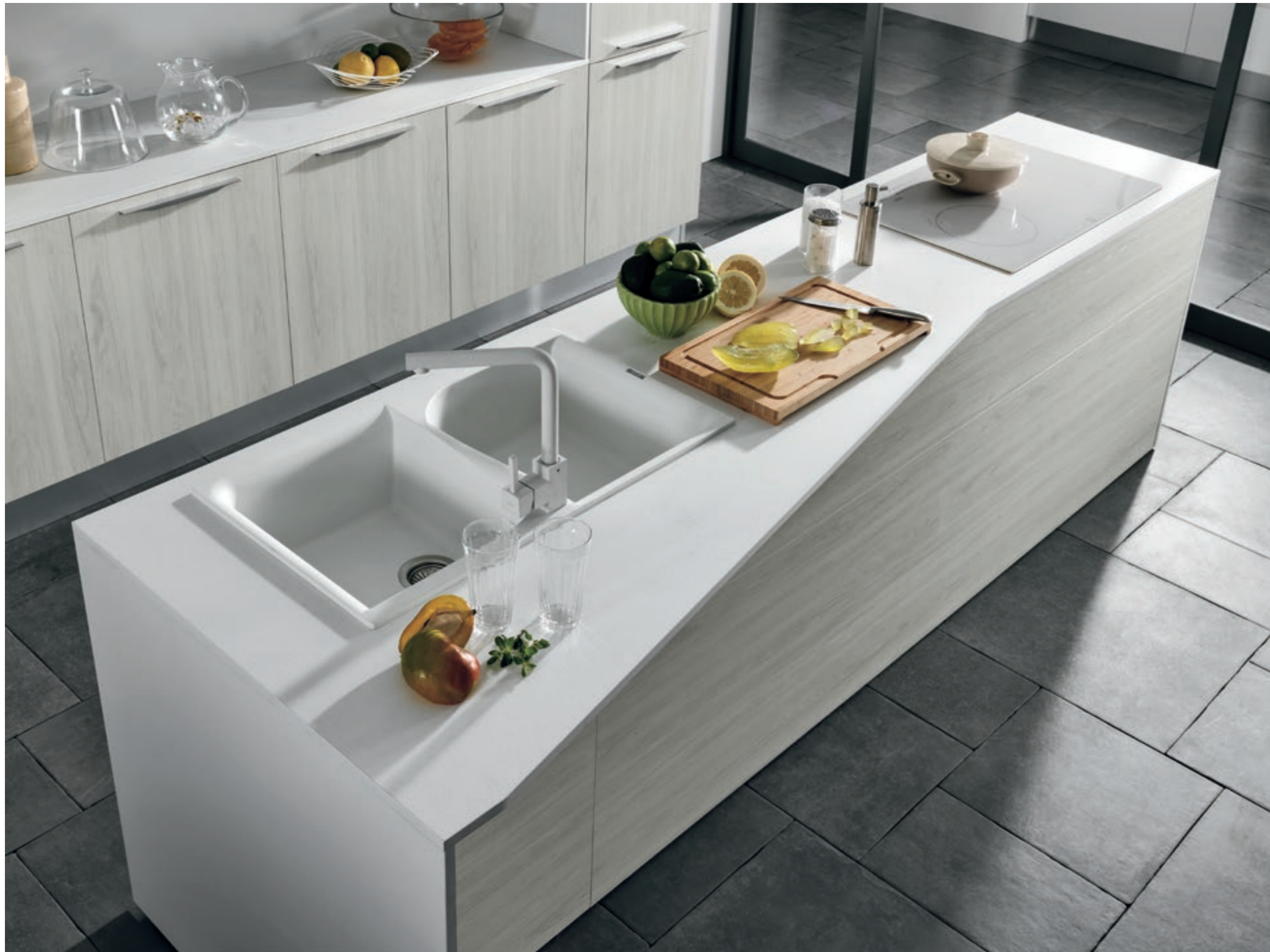
ARTEC ESSENZA / 70