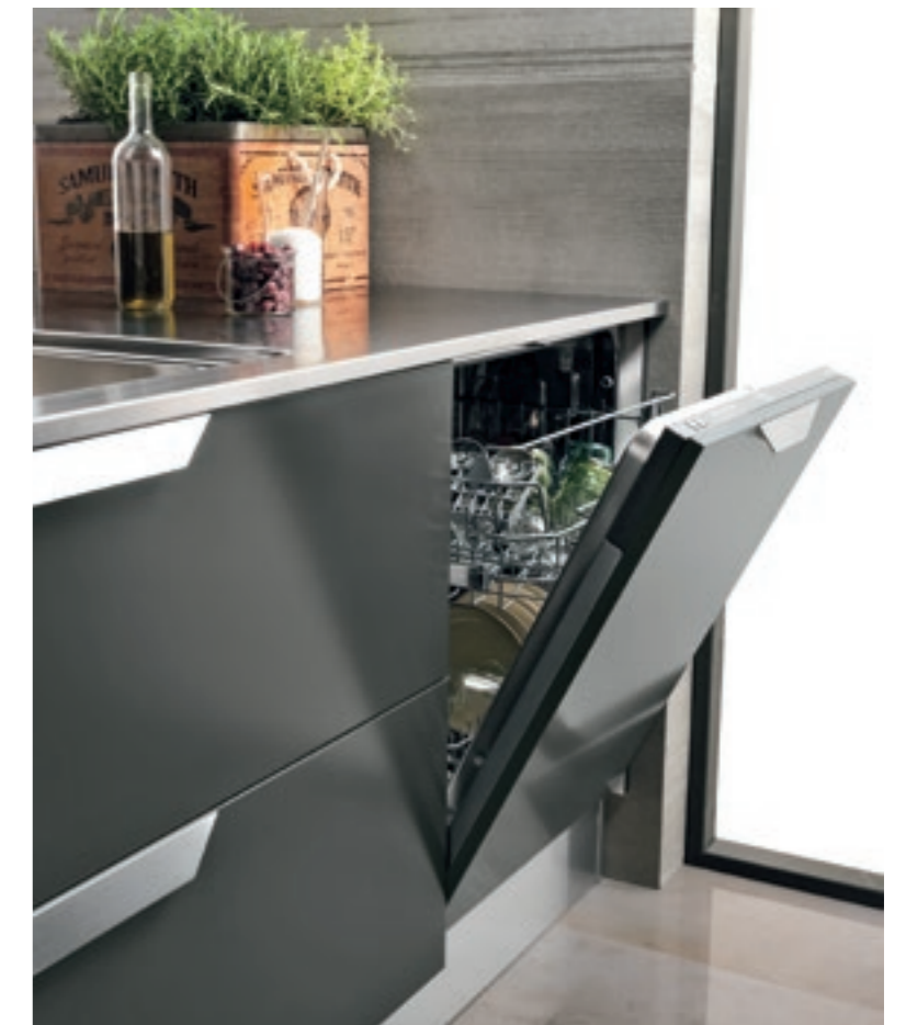
ARTEC ESSENZA / 95