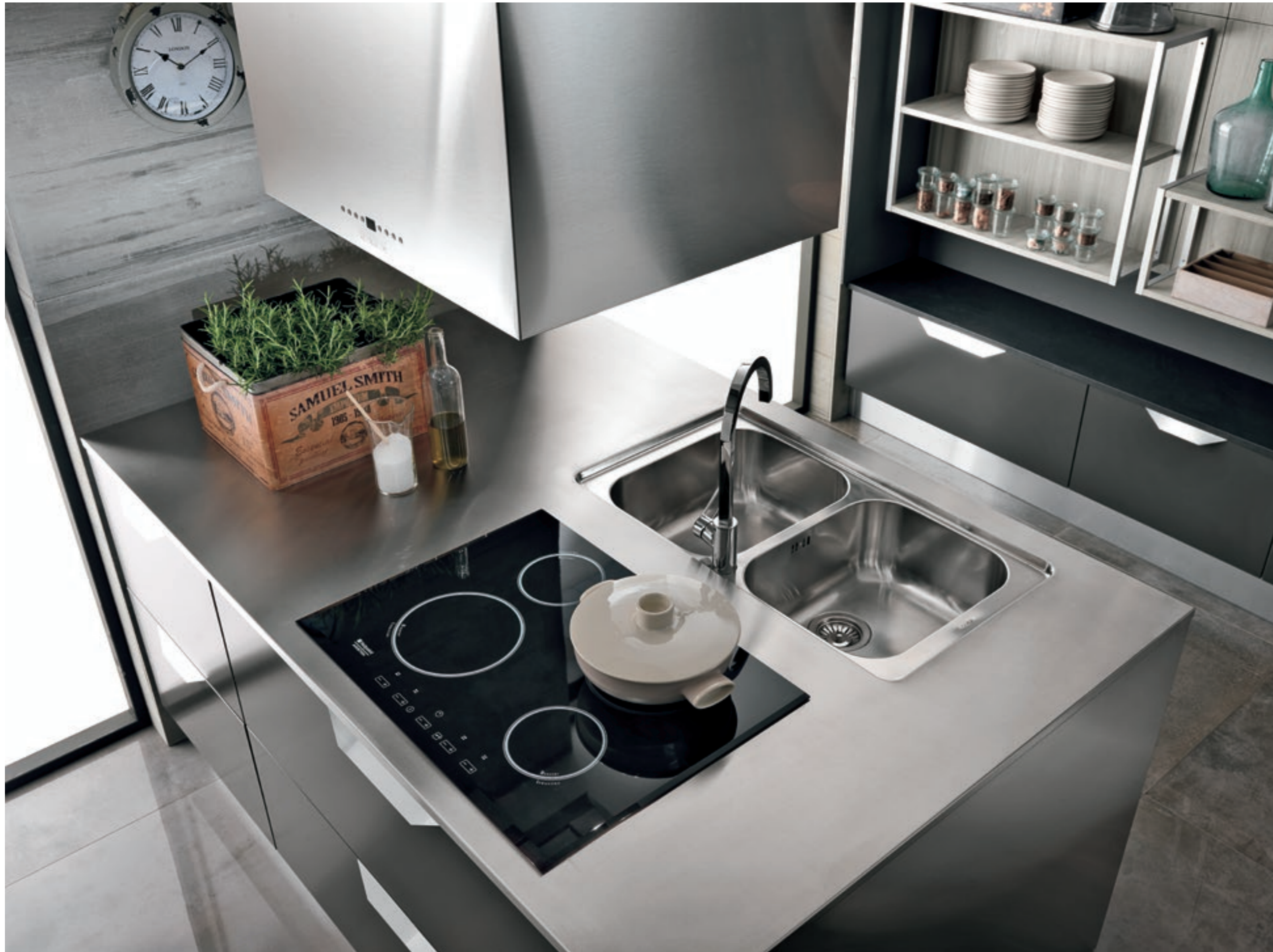
ARTEC ESSENZA / 94