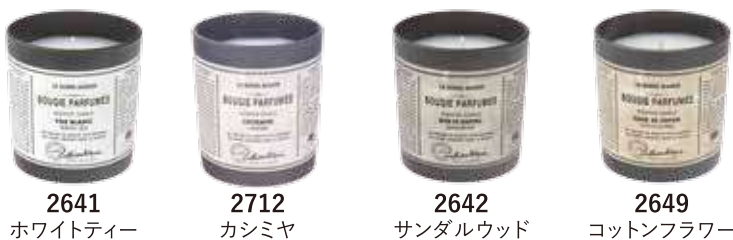
2641 ホワイトティーツー 2712 カシミア 2642 サンドルウッド 2649 コットンフラワー