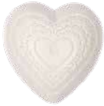
2700 ハートソープ(L) 200g ¥1,500 (税別)