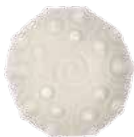
2761 貝殻ソープB 100g ¥600 (税別)