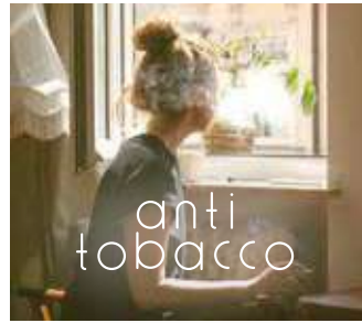
喫煙の匂いを緩和する アンチタバコ ウッディで深みある香り