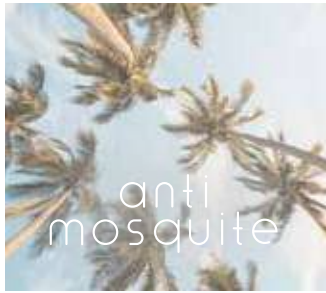
蚊などの虫を遠ざける アンチモスキート シトロネラの爽やかな香り