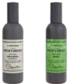
2632 サンドルウッド 2640 モヒート