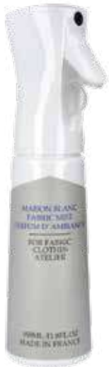
2505 ファブリックミスト