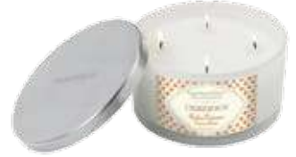
1246 プレシャスアンバー