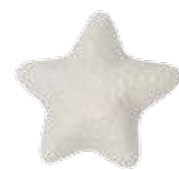
2764 貝殻ソープE 25g ¥500 (税別) 上代変更2022/11~