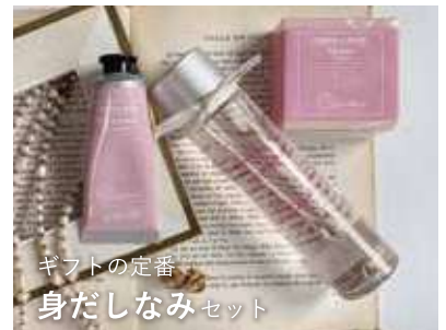
ギフトの定番 身だしなみセット

一日の疲れを癒すバスアイテムは、自分へのご褒美にも、プレゼントにも◎フローラルの優しい香りが、全身を包み込んでくれます。