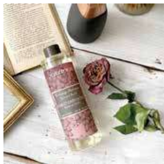
ブーケ用リフィル 250ml ¥3,280 (税別)

REVOL社とコラボした陶器製のガラスが美しいディフューザー。底面は三角状に切れ込みが入ったようなデザイン。 REVOL社とDURANCEのマークが底面に印字されています。