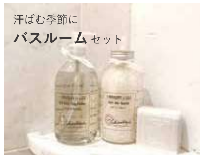
汗ばむ季節に バスルームセット

クリアガラスのデザインが、どのインテリアにも馴染みます。2022年に引き続き再流行中のキャンドルはマストアイテム。バスルームアイテムとの相性も Good！