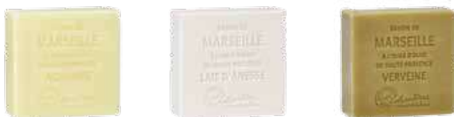
2650 シトラス World 1 2651 ミルク(ロバミルク) 2653 ベルベース