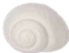
2762 貝殻ソープC 125g ¥1,000 (税別) 上代変更2022/11~