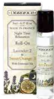
1426 ナイトロールオン