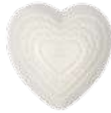
2701 ハートソープ(S) 100g ¥1,200 (税別) 上代変更2022/11~