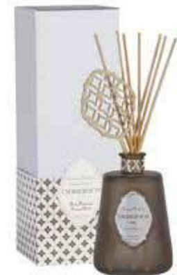
1269 プレシャスウッド