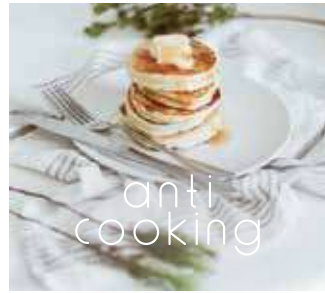
お料理の後の気になる匂いに アンチクッキング フローラル&フルーティー