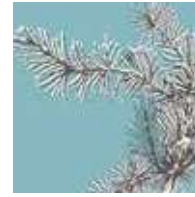
ブルーシダー 雄大でエレガントな シダーウッドの香り

ロメ オードトワレ 100ml ¥6,000 (税別) 上代変更2022/11~