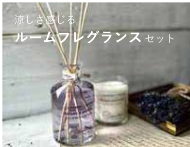
涼しさ感じる ルームフレグランスセット