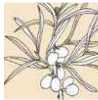
シーバックソー 柑橘系とウッディー のエlegantな香り