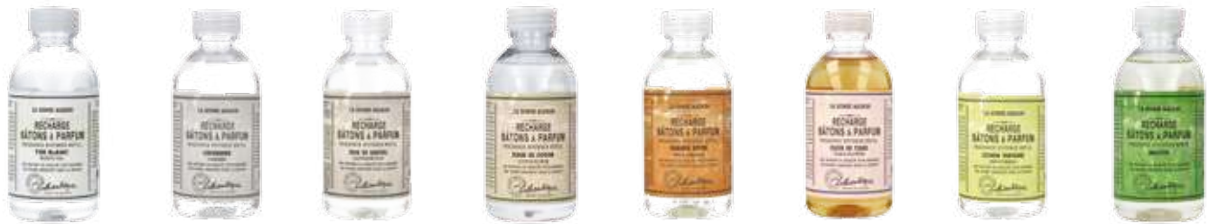
2611 ホワイトティーツー 2686 カシミア 2612 サンドルウッド 2619 コットンフラワー 2688 オランジュ 2685 ティアラ 2687 レモンバーベナ 2620 モヒート