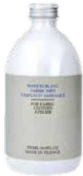
2506 詰め替えリフィル