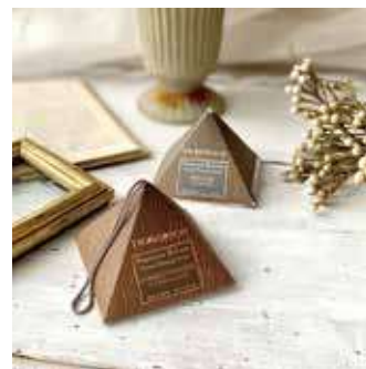
ハンギングサシェ 10g ¥1,480 (税別)