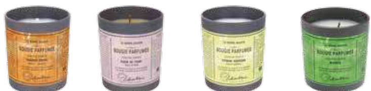
2714 オランジュ 2711 ティアラ 2713 レモンバーベナ 2690 モヒート