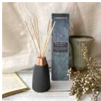
フレグランスブーケ 120ml ¥5,480 (税別)