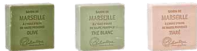
World 3 2654 オリーブ 2656 ホワイトティアー World 2 2658 ティアラ