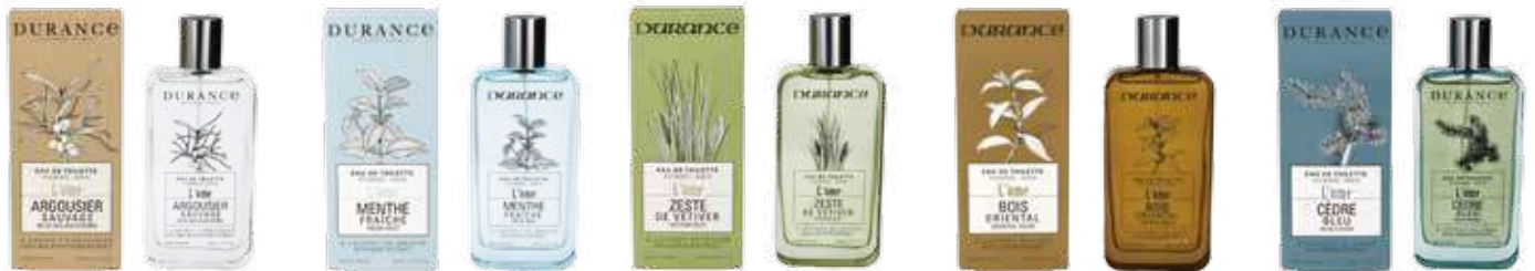
1706 シーバックソー 1708 フレッシュミント 1709 ベティベールゼスト 1710 オリエンタルウッド 1711 ブルーシダー