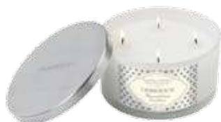
1245 コットンフラワー