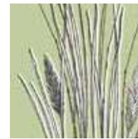
ベティベールゼスト 大地の香りを感じ させるベチバーの香り