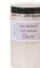
2037 ミルク(ロバミルク)