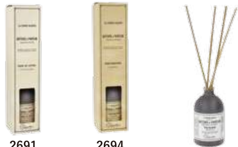
2691 コットンフラワー 2694 グレープフルーツ