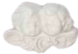
2781 アンジュソープB 100g ¥1,200 (税別) 上代変更2022/11~