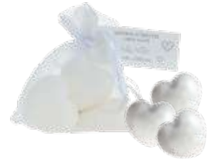
2702 ハートゲストソープ10g×3個 ¥2,000 (税別) 上代変更2022/11~