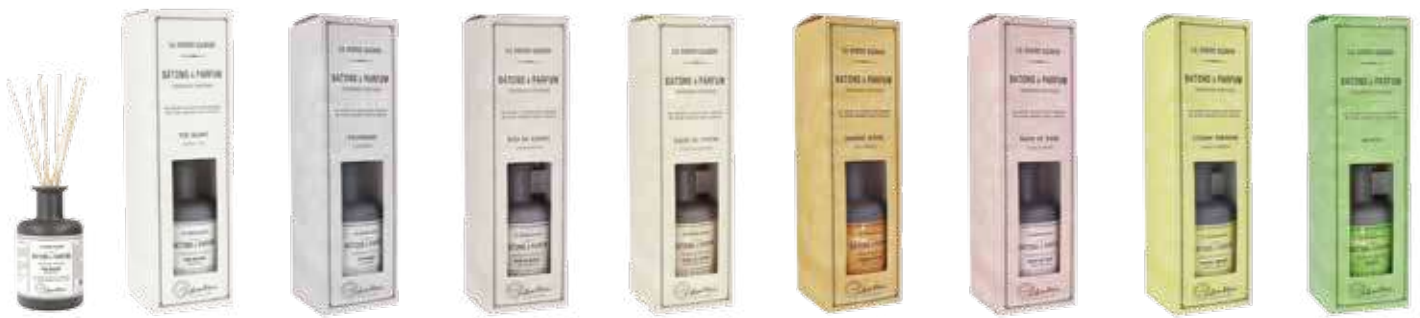
2601 ホワイトティーツー 2696 カシミア 2602 サンドルウッド 2609 コットンフラワー 2698 オランジュ 2695 ティアラ 2697 レモンバーベナ 2610 モヒート

フレグランスブーケ 200ml ¥4,000 (税別) 上代変更2022/11~