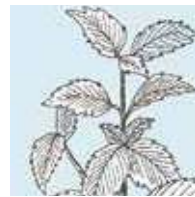
フレッシュミント 清涼感のある ペパーミントの香り