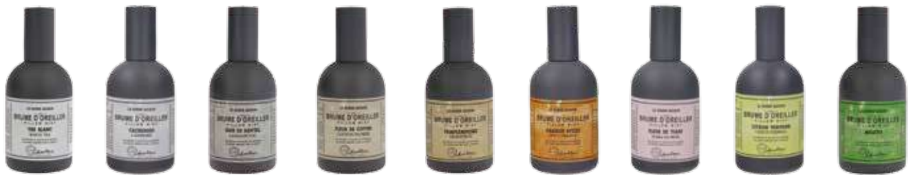
2621 ホワイトティー 2666 カシミヤ 2622 サンドルウッド 2629 コットンフラワー 2625 グレープフルーツ 2668 オランジュ 2665 ティアラ 2667 レモンバーベナ 2630 モヒート