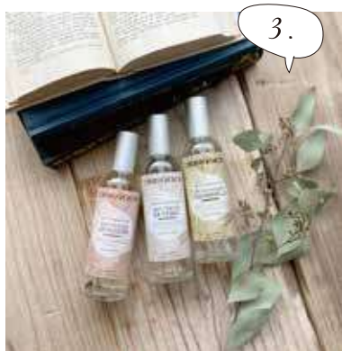
フレグランス ルームスプレー 100ml ¥2,800 (税別)