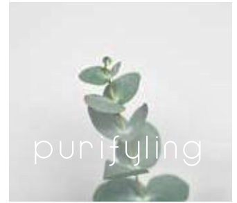
花粉の季節にもおすすめ ピュリファイリング ユーカリのフレッシュさ