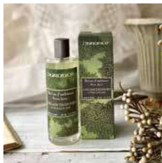
ルームスプレー 100ml ¥3,480 (税別)

フレグランスブーケ用のオイルリフィルです。別売りの[1150]リフィルスティックと併用いただくのがおすすめです。