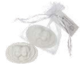
2783 アンジュゲストソープ 25g×2個 ¥2,000 (税別) 上代変更2022/11~