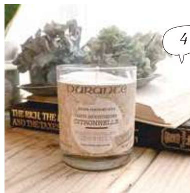
フレグランス キャンドル 180g ¥2,800 (税別)