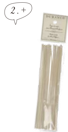
1150 フレグランスブーケ用リフィル スティック20本 ¥800 (税別)