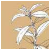
オリエンタルウッド 瞑想の世界へと誘う ラブダナブの香り