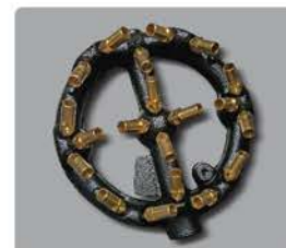
Quemador tipo jet con 22 salidas de 110,000 BTU/HR