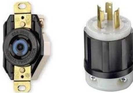
CONTACTO NEMA L6-20R y CLAVIJA NEMA L6-20P