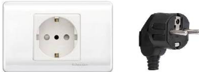
CONTACTO Y CLAVIJA SCHUKO

La potencia máxima del equipo es de 3.5kW