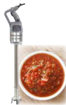
MP 550 Turbo 1.2 HP 12,000 rpm