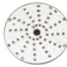
28058 3 mm (1/8") Rallador