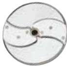
28064 3 mm (5/64") Rebanador