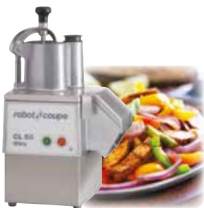
CL 50 Ultra 1.5 HP 425 rpm