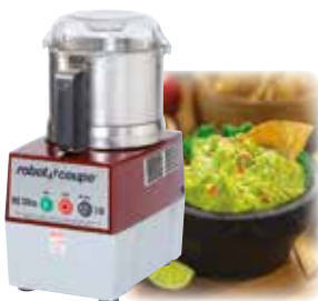
R 2 B Ultra 1 HP 1,725 rpm