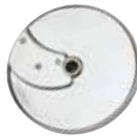
28065 5 mm (3/16") Rebanador