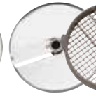
28112 10 mm (3/8") Kit de limpieza