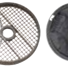
39881 Kit de limpieza