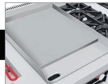
Exclusivo sistema recolector de grasa y residuos.