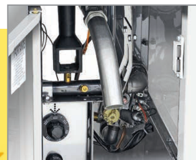
Mayor control y seguridad en el manejo de la freidora.