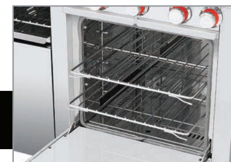
Horno mucho más productivo. ¡Puede hornear de todo! Pan, pasteles, aves, pescados, carnes, pasta, etc.