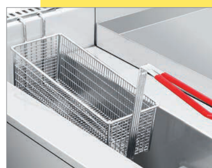
Prepare mayor cantidad de alimentos crujientes y doraditos en menos tiempo.