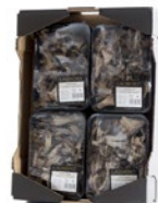
4 unit box / Cagette de 4 u.