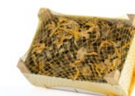
1 kg box / Cagette de 1 kg