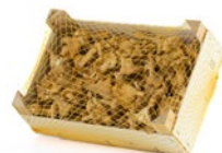
1 kg box / Cagette de 1 kg