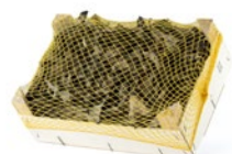
1 kg box / Cagette de 1 kg