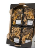
4 unit box / Cagette de 4 u.