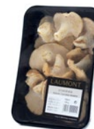
Tray / Barquette