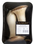
200 g tray / Barquette de 200 g