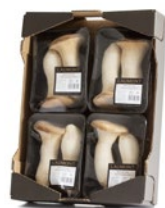
4 unit box / Cagette de 4 u.