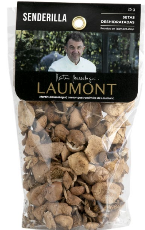
25 g bag Sac de 25 g Ref.: 23116

Ingrédients : Marasmius oreades sauvage.