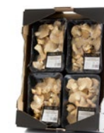
4 unit box / Cagette de 4 u.