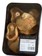
Tray / Barquette