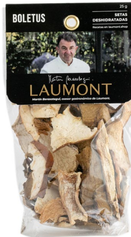
25 g bag Sac de 25 g Ref.: 20916