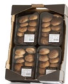
4 unit box / Cagette de 4 u.