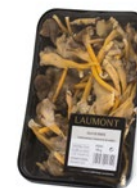
Tray / Barquette