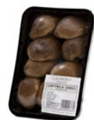
Tray / Barquette