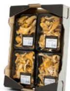
4 unit box / Cagette de 4 u.