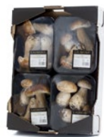
4 unit box. / Cagette de 4 u.