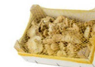
1 kg box / Cagette de 1 kg