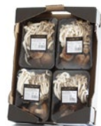
4 unit box / Cagette de 4 u.