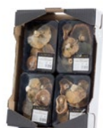
4 unit box / Cagette de 4 u.