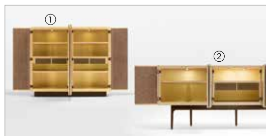
1 Moore 73000 fin.28 2 Moore 73005 fin.28