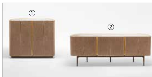
1 Moore 73000 fin.28 2 Moore 73005 fin.28