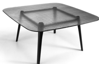
Table with 15 mm fused and tempered glass top, available in the transparent shades Smoke, Blue, Amber or Natural satin finish. Solid wood structure available in natural Oak or grey finish.

Tavolo con piano in vetro da 15 mm fuso a gran fuoco e temperato, disponibile nelle tinte trasparenti Fumo, Blu, Ambra o Naturale effetto satinato. Struttura in legno massello disponibile nelle finiture rovere naturale o tinto grigio.