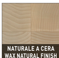
NATURALE A CERA WAX NATURAL FINISH