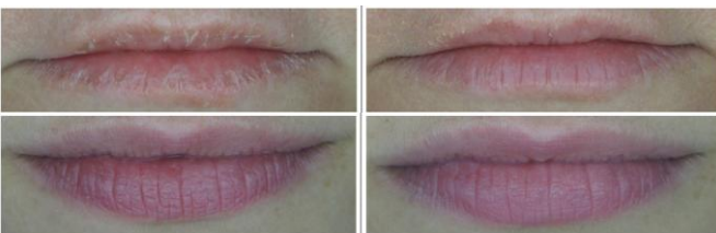
Macrofotografías de los labios antes y después de una aplicación dos veces al día de un bálsamo labial reparador con DRAGON'S BLOOD LP AL 5% durante 7 días.

Esta composición hace de DRAGON'S BLOOD LP , un ingrediente valioso y listo para usar para el tratamiento de la piel seca y dañada y los labios agrietados. Un ingrediente funcional con múltiples propiedades.