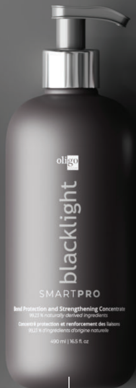
Concentré protection et renforcement de liaisons