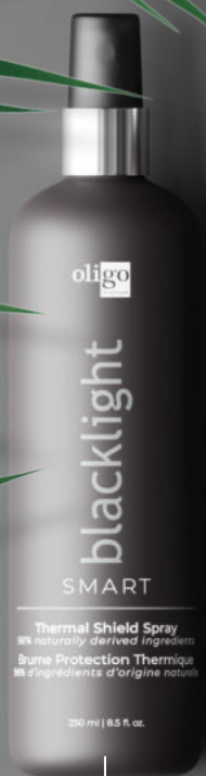
Brume Protection Thermique