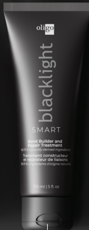
Traitement constructeur et réparateur de liaisons