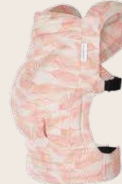
Tiimeless Palmdiia Coral