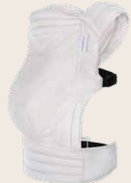
Tiimeless Palmdiia Pure