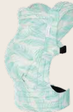
Tiimeless Palmdiia Mint