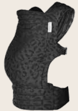
Tiimeless Leodiia Black