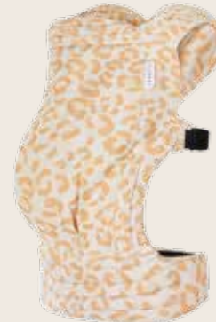
Tiimeless Leodiia India