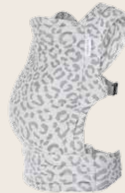
Tiimeless Leodiia Snow

Die Babytrage ist für Neugeborene ab 4 kg und Kleinkinder bis 15 kg geeignet. Du kannst die Trage alleine ohne Hilfe anziehen und auch auf dem Rücken tragen.