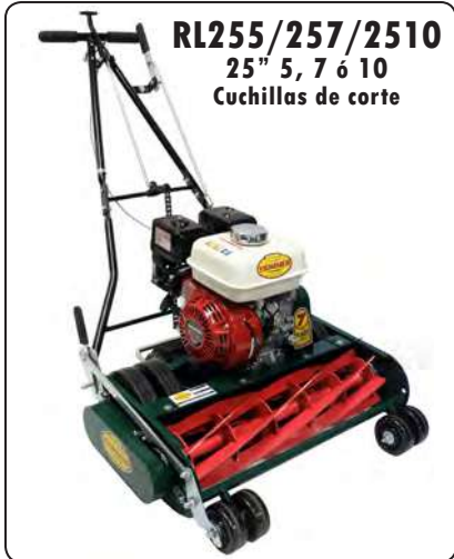
RL255/257/2510 25" 5, 7 6 10 Cuchillas de corte