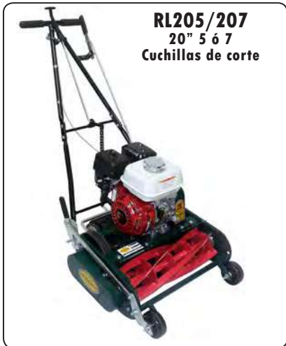
RL205/207 20" 5 6 7 Cuchillas de corte

CALIDAD COMERCIAL · RESULTADOS PROFESIONALES